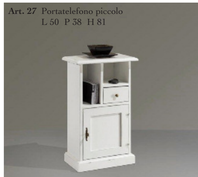
Art. 27 Portatelefono piccolo L 50 P 38 H 81