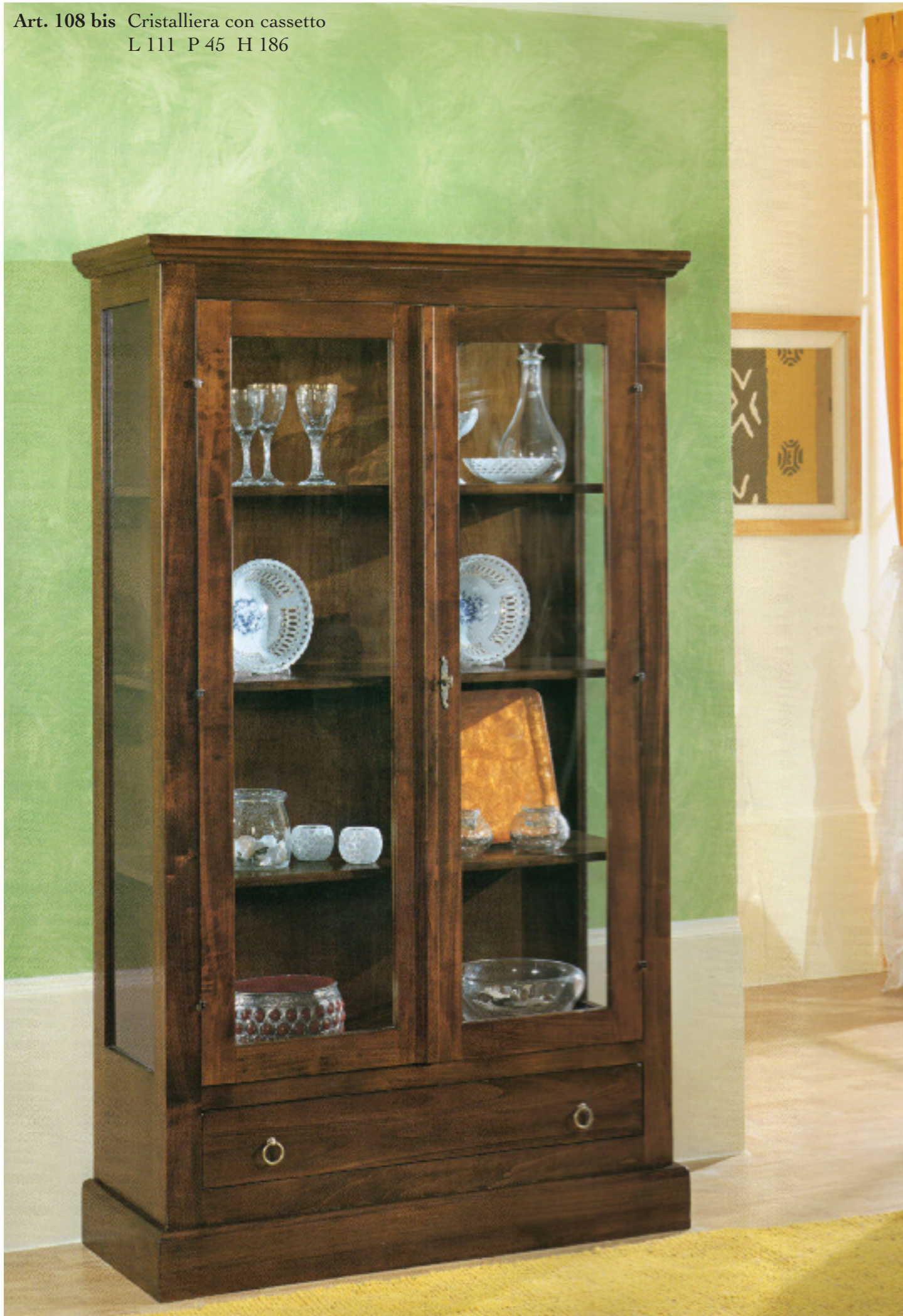
Art. 108 bis Cristalliera con cassetto L 111 P 45 H 186