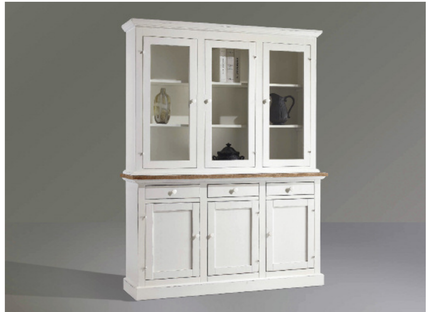
Art. 13 Shabby Vetrina 3 ante Piano impiallacciato in frassino noce sbiancato e spazzolato, struttura bianco laccato L 165 P 47 H 214