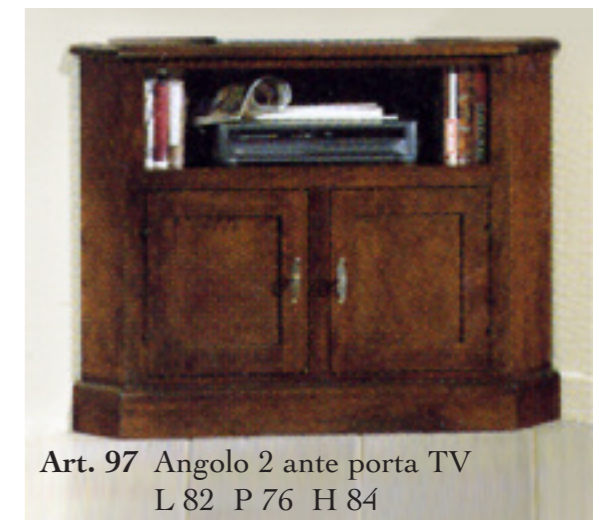
Art. 97 Angolo 2 ante porta TV L 82 P 76 H 84