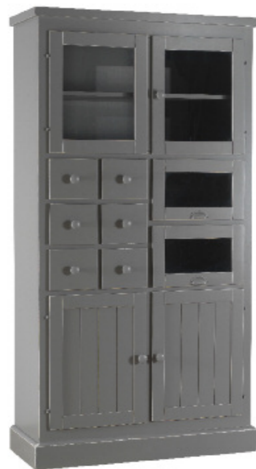
Art. 47 Margot Dispensa dogata finitura grigio anticato L 111 P 46 H 203