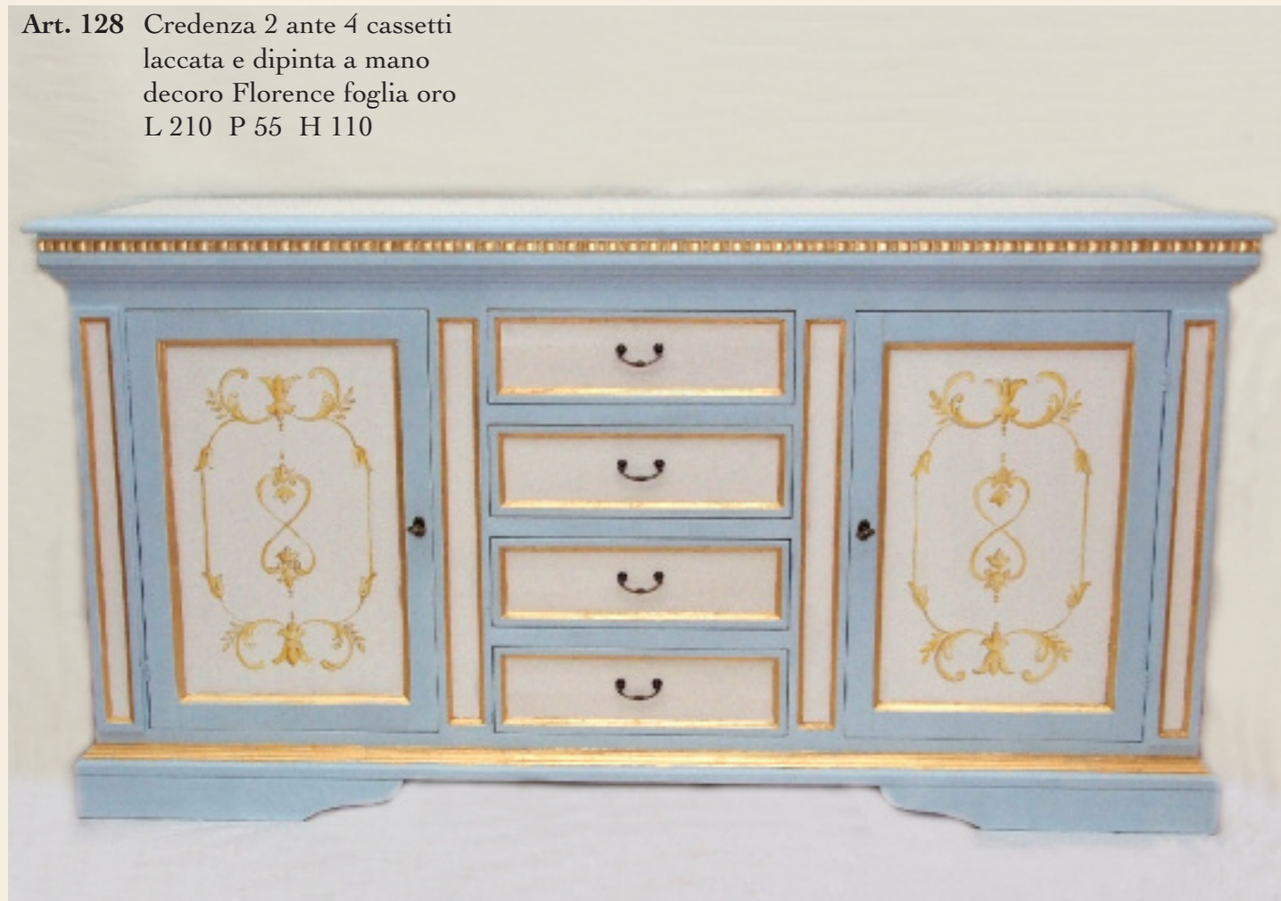
Art. 128 Credenza 2 ante 4 cassetti laccata e dipinta a mano decoro Florence foglia oro L 210 P 55 H 110