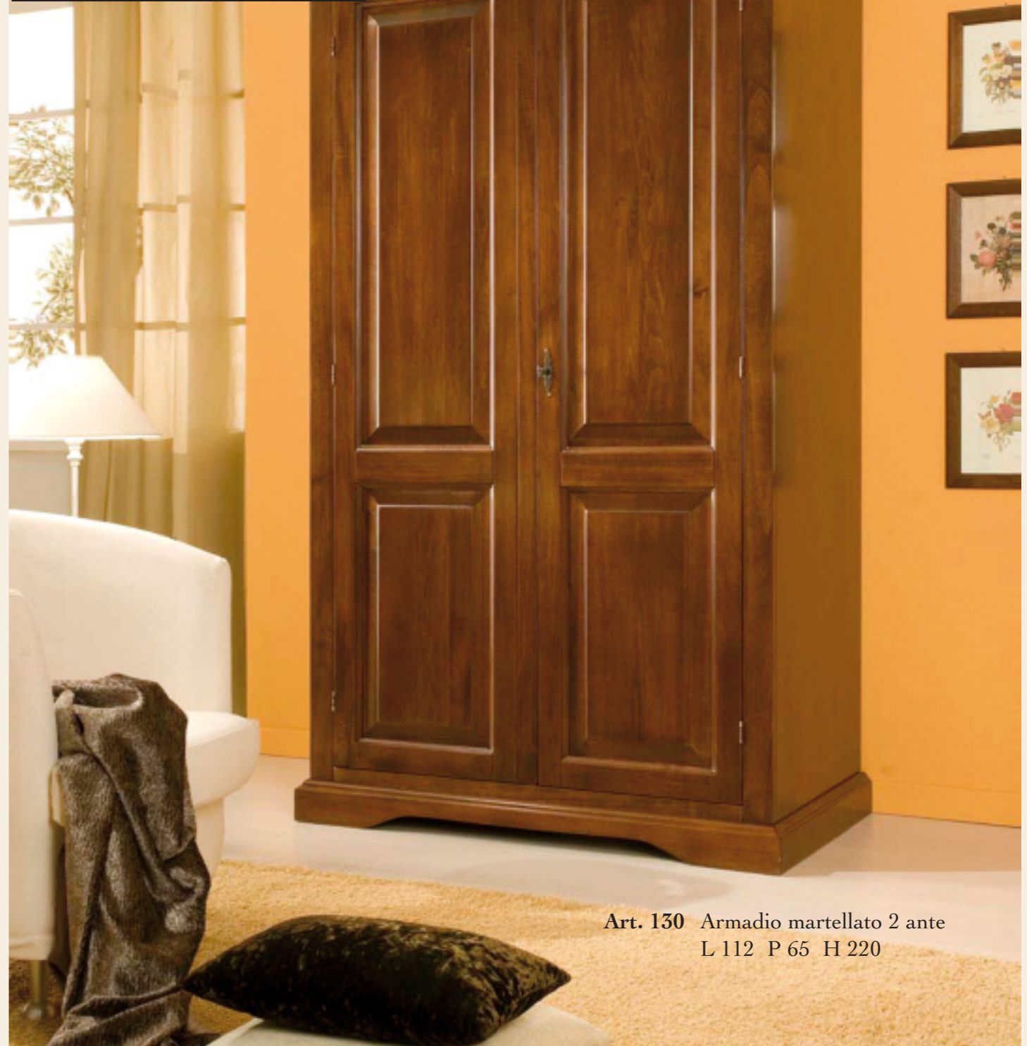
Art. 130 Armadio martellato 2 ante L 112 P 65 H 220