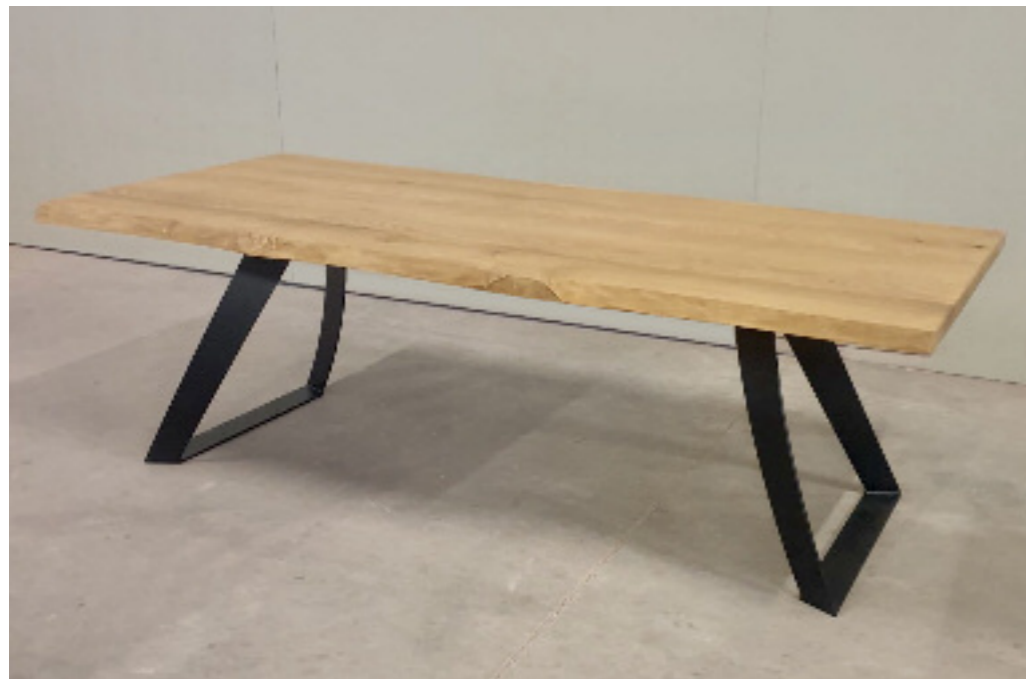
Art. 222 Tavolo in legno massello, gambe in ferro misure disponibili: cm 200 x 100 H 76 cm 180 x 100 H 76 spessori disponibili: cm 3 cm 6