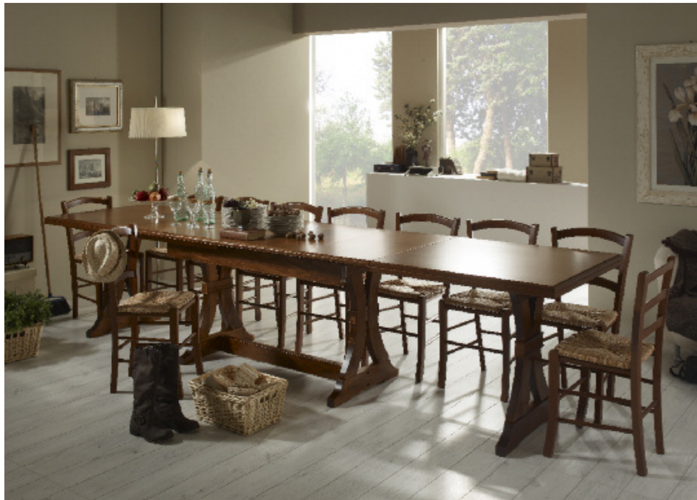
Art. 66 Tavolo fratino allungabile fino a 360 L 180 P 85 H 80 all. 360

disponibili in finitura noce, finitura bianco laccato