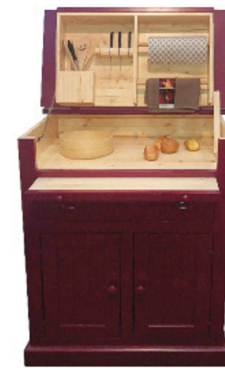
Art. 46 Margot Madia dogata finitura amaranto L 84 P 54 H 102