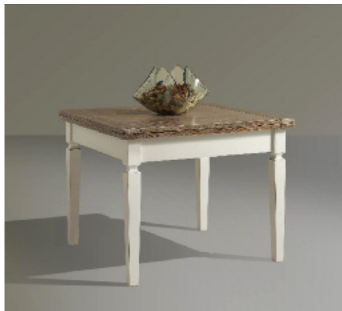
Art. 14/G Shabby Tavolo 100x100 allungabile a libro Piano impiallacciato in frassino noce sbiancato e spazzolato, testate in frassino massiccio, gambe e castello bianco laccato L 100 P 100 H 80 chiuso L 200 P 100 H 80 aperto