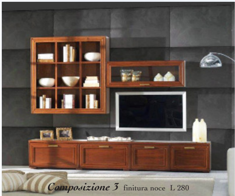
Composizione 3 finitura noce L 280