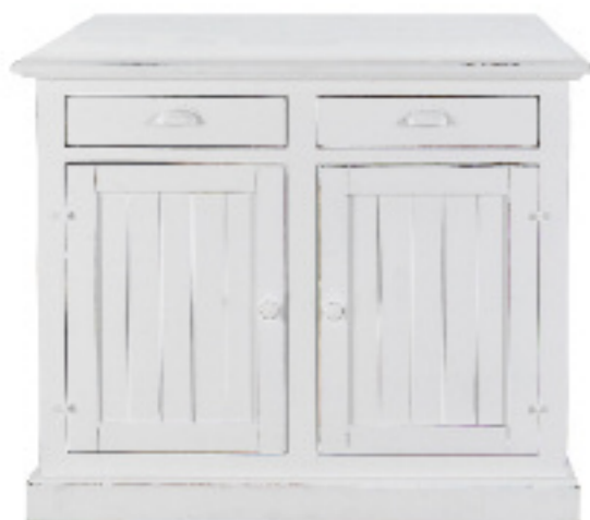
Art. 44 bis Margot Base 2 ante dogata finitura bianco laccato L 115 P 45 H 92