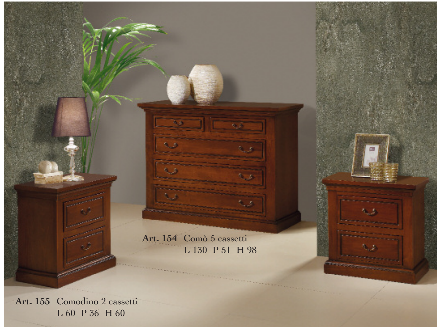
Art. 154 Comò 5 cassetti L 130 P 51 H 98