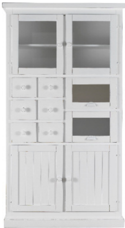
Art. 47 Margot Dispensa dogata finitura bianco laccato L 111 P 46 H 203