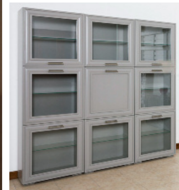
Composizione 5 finitura grigio laccato