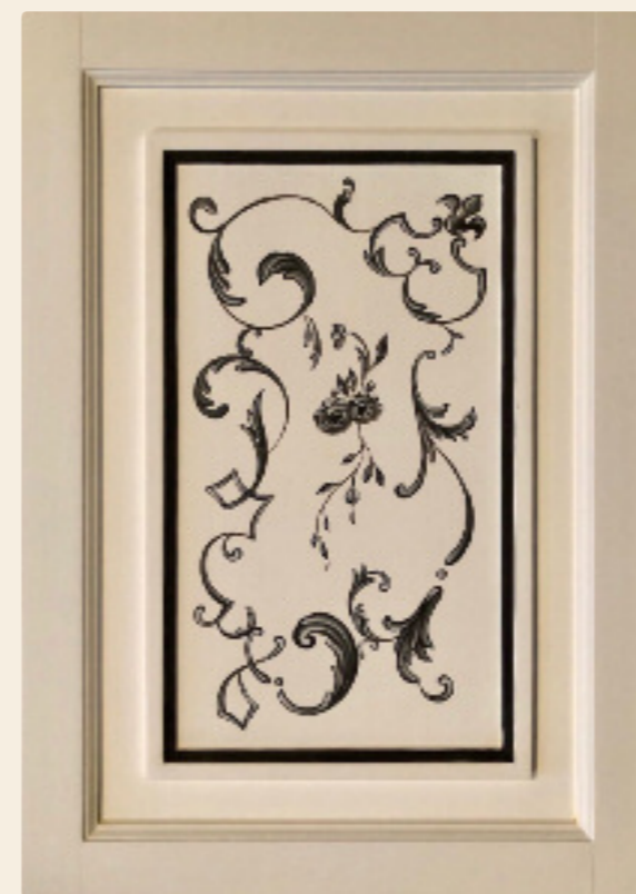
Decoro Toscano nero, foglia argento