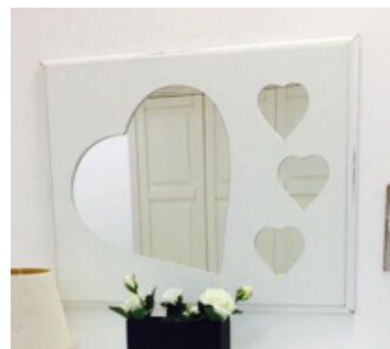
Art. 104 Specchiera L 90 P 2,5 H 60