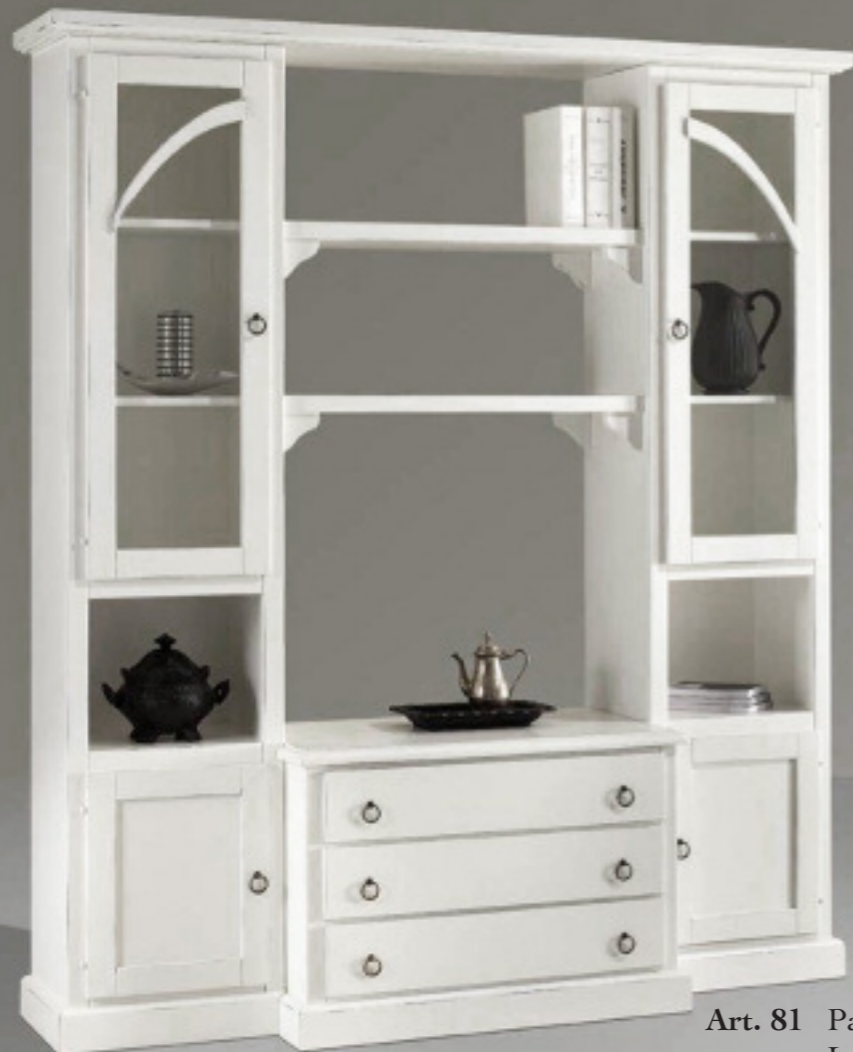
Art. 81 Parete L 190 con mensole L 190 P 51 H 214