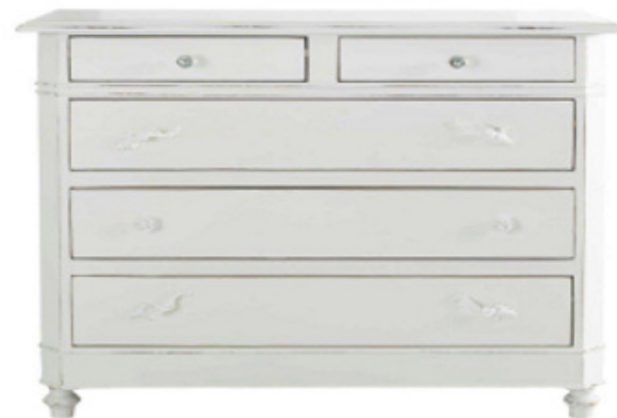
Art. 101 Comò 5 cassetti L 116 P 48 H 99