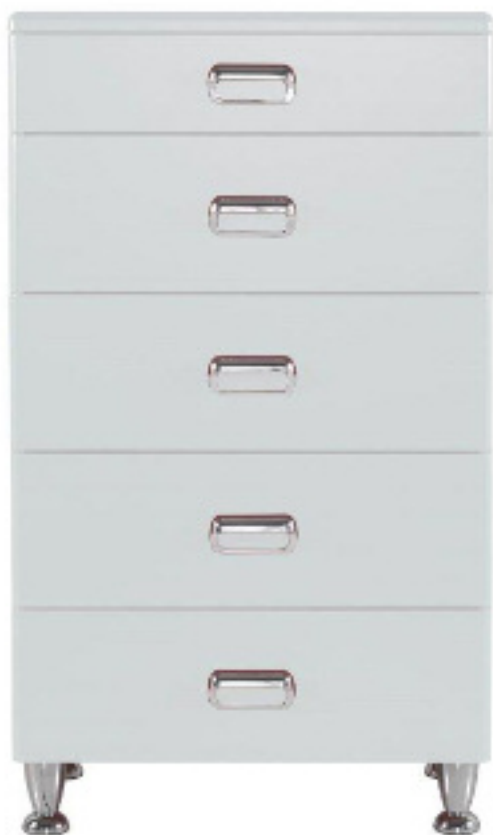
Art. 803 Cassettiera 5 cassetti laccato bianco L 64 P 44 H 104