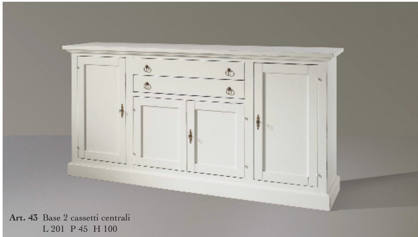
Art. 43 Base 2 cassetti centrali L 201 P 45 H 100