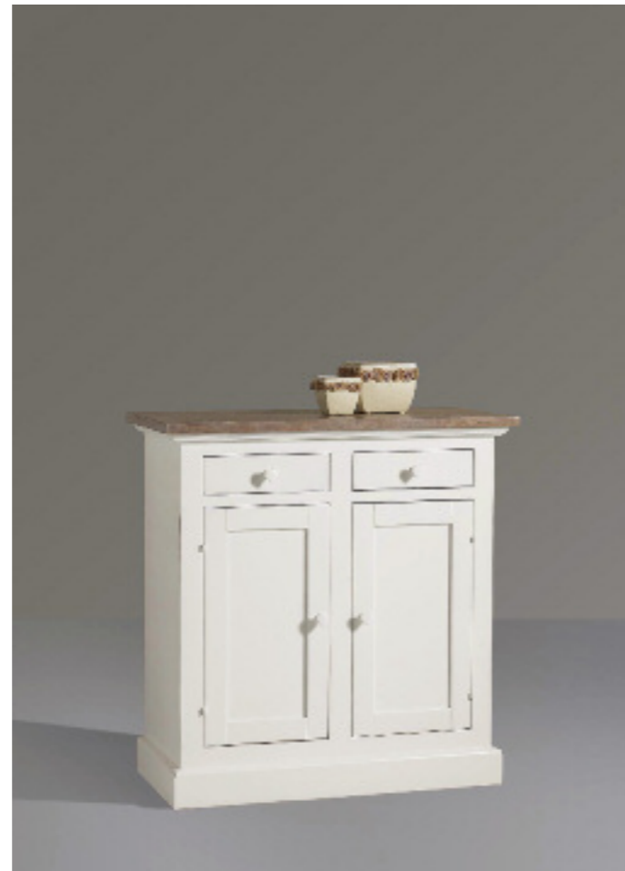
Art. 12 bis Shabby Base 2 ante Piano impiallacciato in frassino noce sbiancato e spazzolato, struttura bianco laccato L 95 P 47 H 97