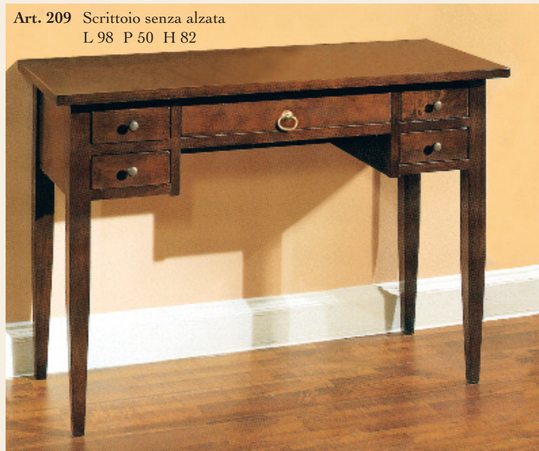
Art. 209 Scrivania senza alzata L 98 P 50 H 82