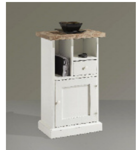
Art. 27 Shabby Portatelefono Piano in frassino massiccio noce sbiancato e spazzolato, struttura bianco laccato L 50 P 38 H 81