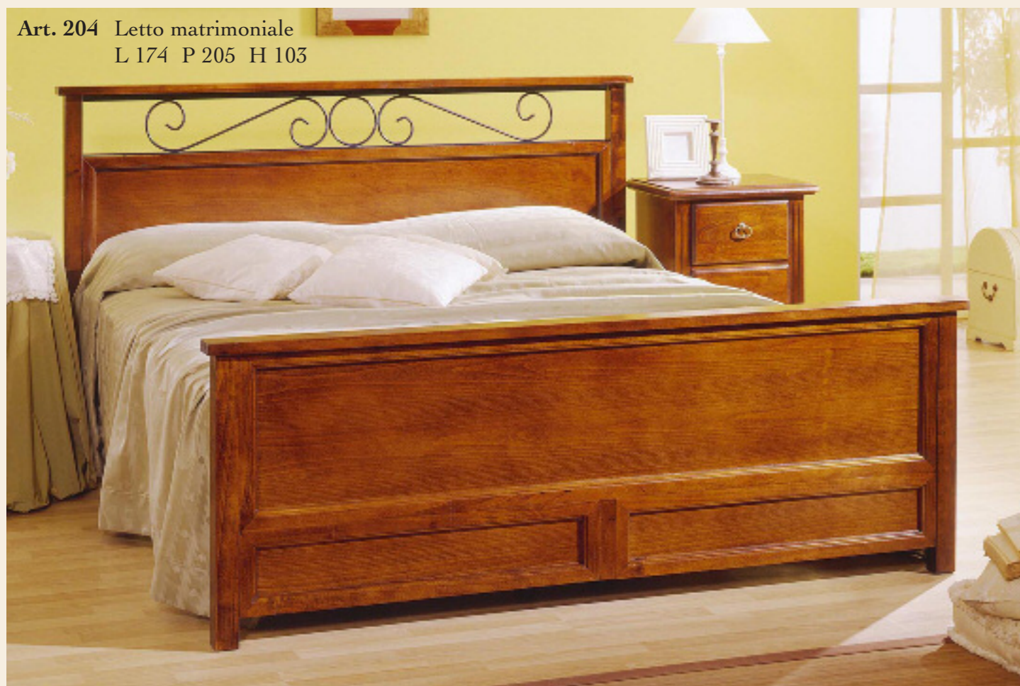
Art. 204 Letto matrimoniale L 174 P 205 H 103