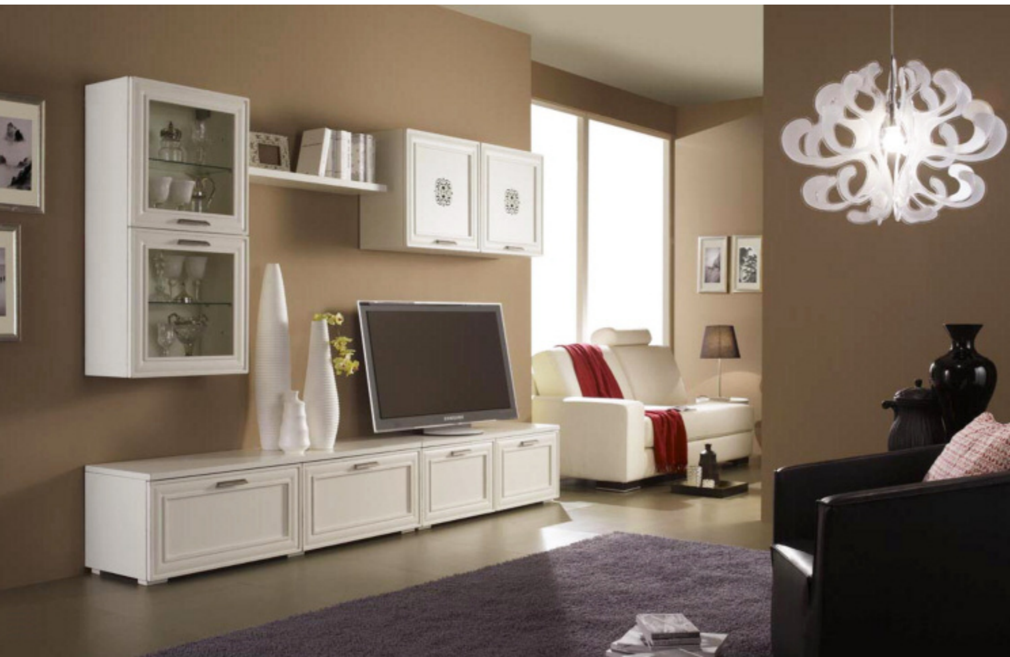
Composizione 2 finitura bianco laccato L 280