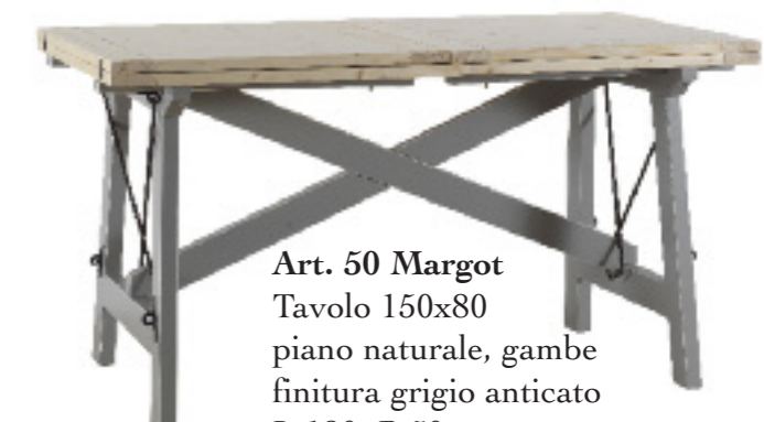
Art. 50 Margot Tavolo 150x80 piano naturale, gambe finitura grigio anticato L 180 P 50