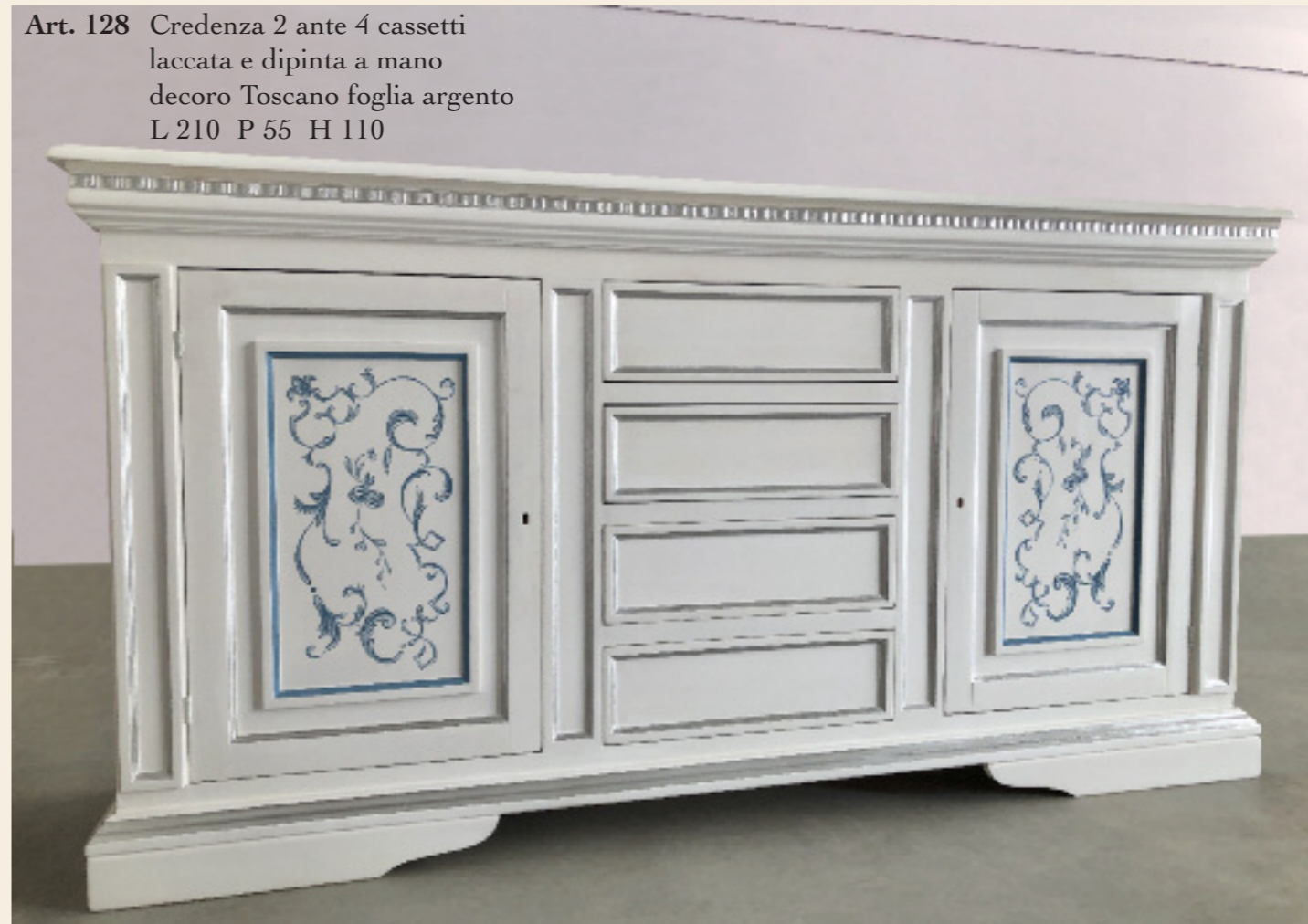
Art. 128 Credenza 2 ante 4 cassetti laccata e dipinta a mano decore Toscano foglia argento L 210 P 55 H 110