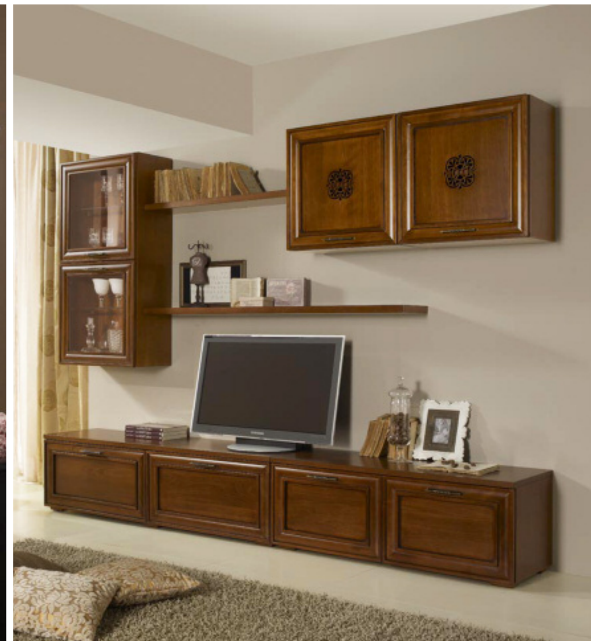
Composizione 2 finitura noce L 280