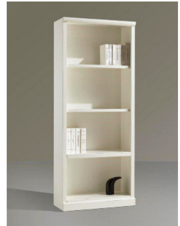
Art. 29 bis Shabby Libreria a giorno Struttura bianco laccato L 86 P 38 H 212