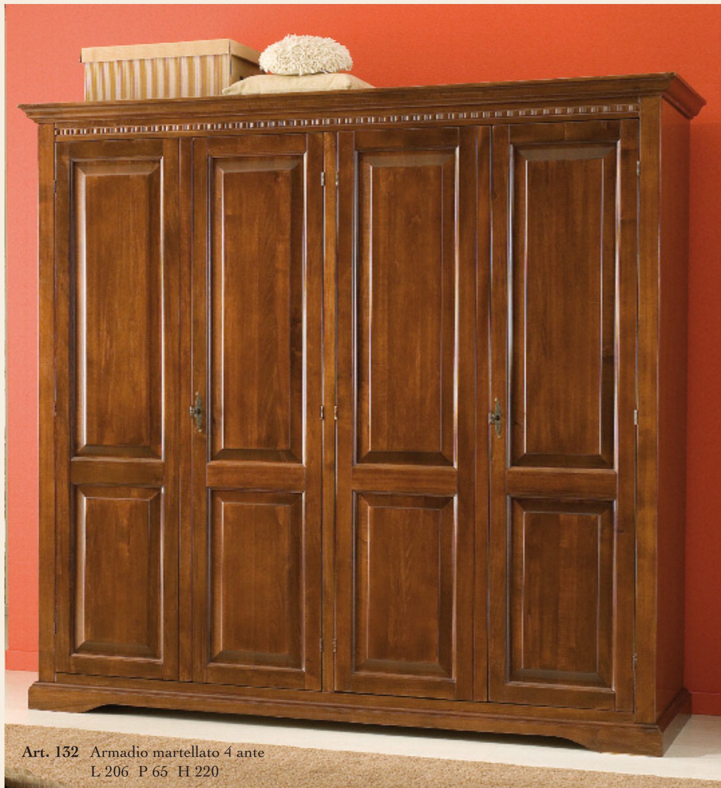
Art. 132 Armadio martellato 4 ante L 206 P 65 H 220