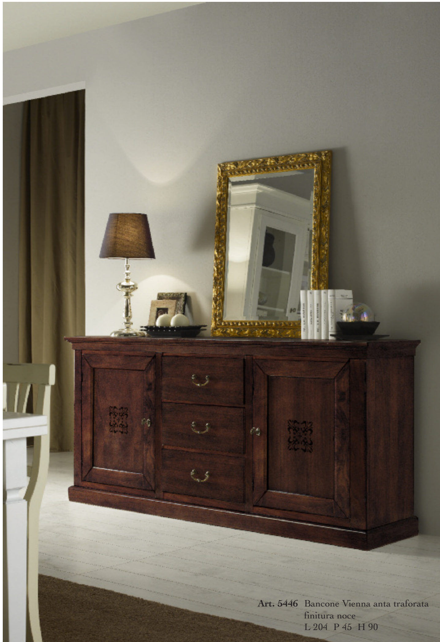
Art. 5446 Bancone Vienna anta traforata finitura noce L 204 P 45 H 90