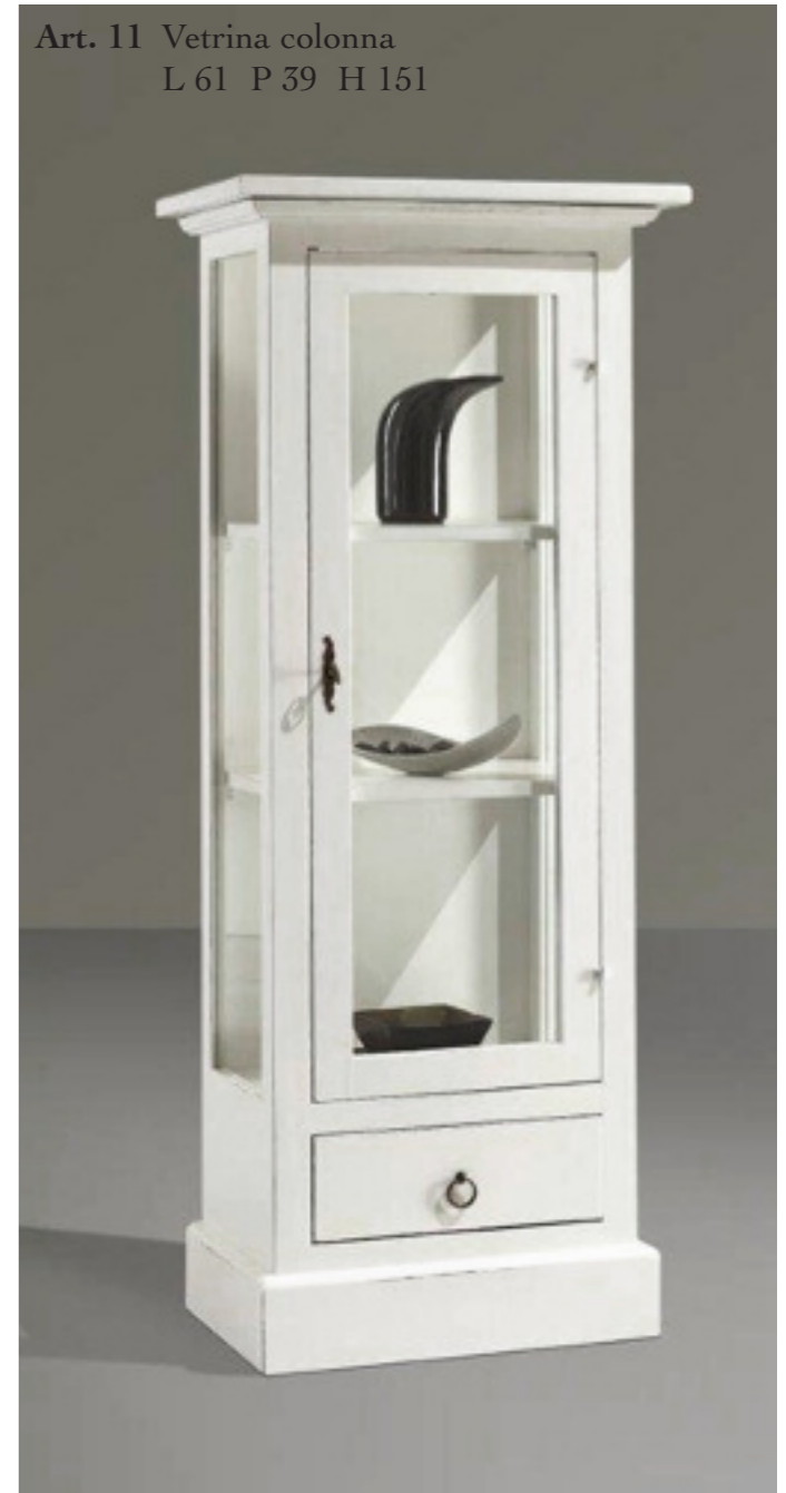
Art. 11 Vetrina colonna L 61 P 39 H 151