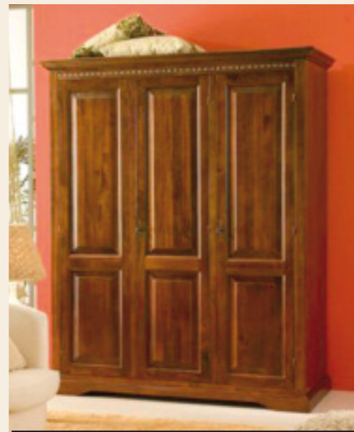
Art. 131 Armadio martellato 3 ante L 159 P 65 H 220