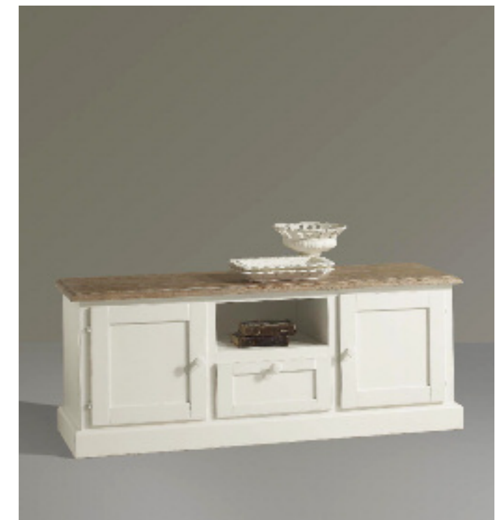
Art. 36 Shabby Cassapanca 2 ante Piano impiallacciato in frassino noce sbiancato e spazzolato, struttura bianco laccato L 142 P 42 H 56