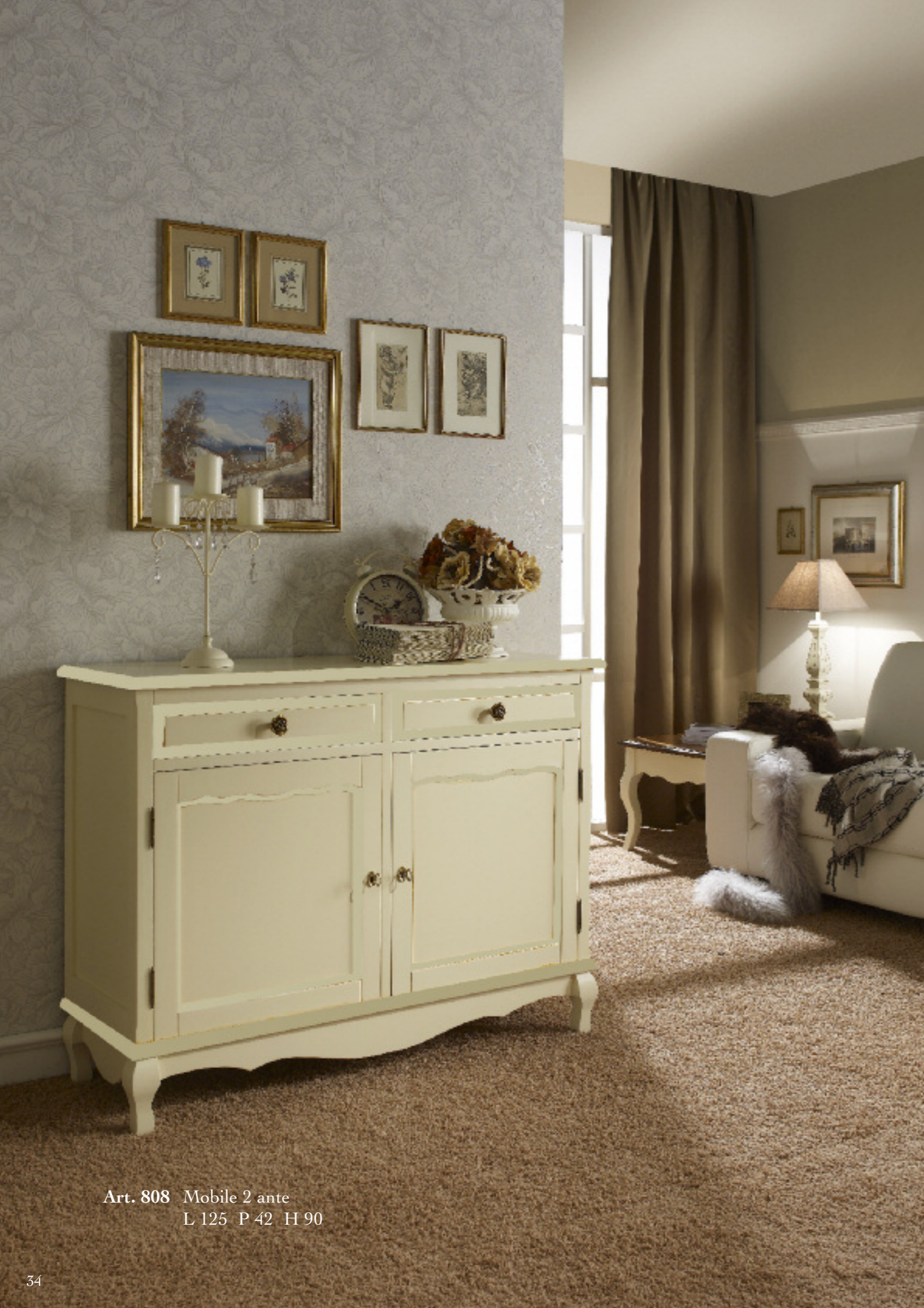
Art. 808 Mobile 2 ante L 125 P 42 H 90