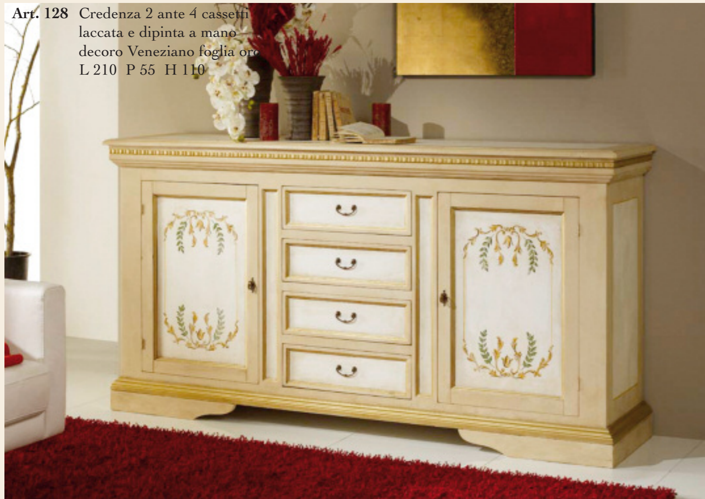
Art. 128 Credenza 2 ante 4 cassetti laccata e dipinta a mano decoro Veneziano foglia oro L 210 P 55 H 110