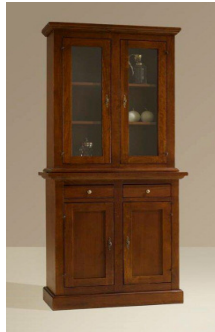
Art. 12 Vetrina 2 ante L 95 P 47 H 200