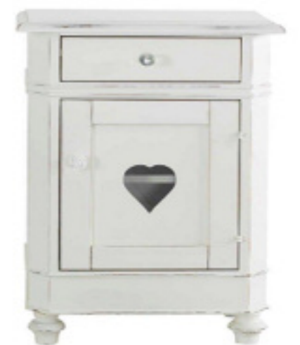
Art. 102 Comodino L 52 P 34 H 79