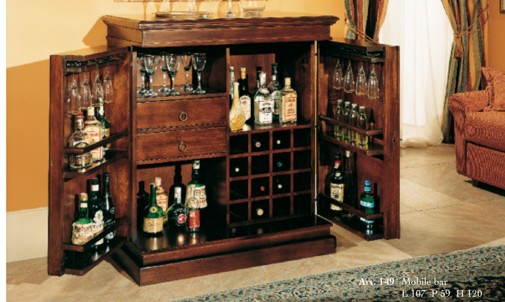
Art. 149 Mobile bar L 107 P 59 H 120