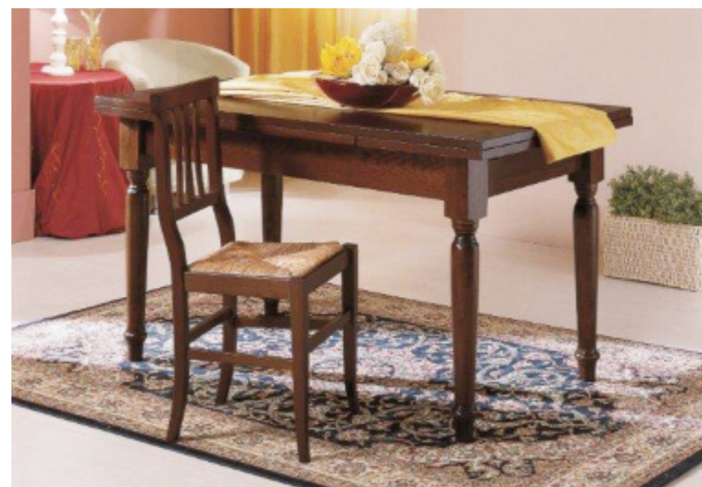
Art. 13/P Tavolo rettangolare allungabile con gamba tornita L 120 P 80 H 80 chiuso L 200 P 80 H 80 aperto