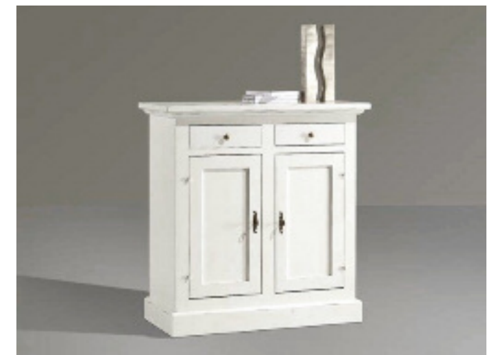
Art. 12 bis Base 2 ante L 95 P 47 H 97