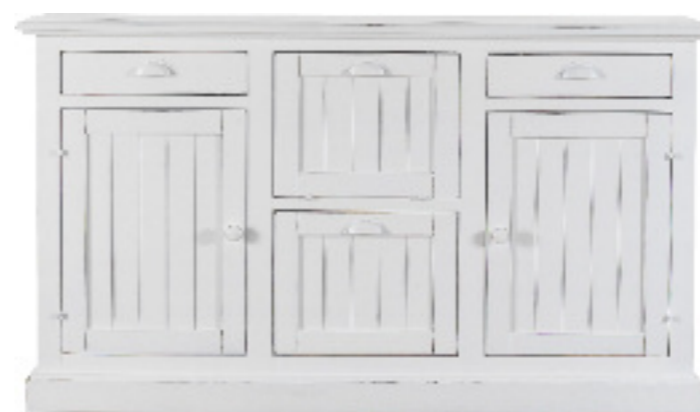
Art. 45 Margot Base 2 ante 2 cassetti 2 cestoni dogata finitura bianco laccato L 165 P 45 H 95