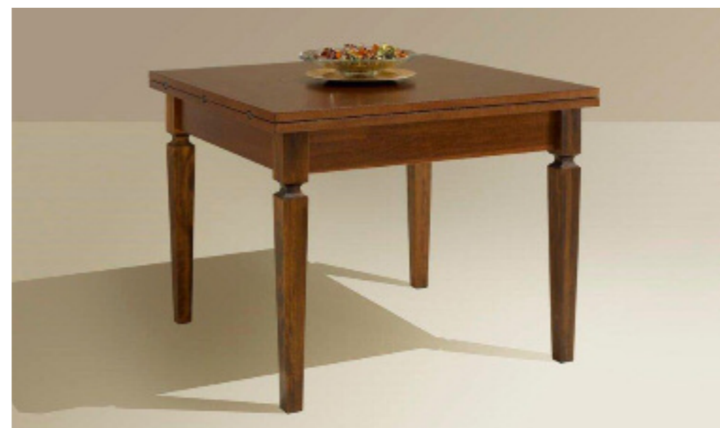
Art. 14/G Tavolo allungabile a libro con gamba a spillo L 100 P 100 H 80 chiuso L 200 P 100 H 80 aperto