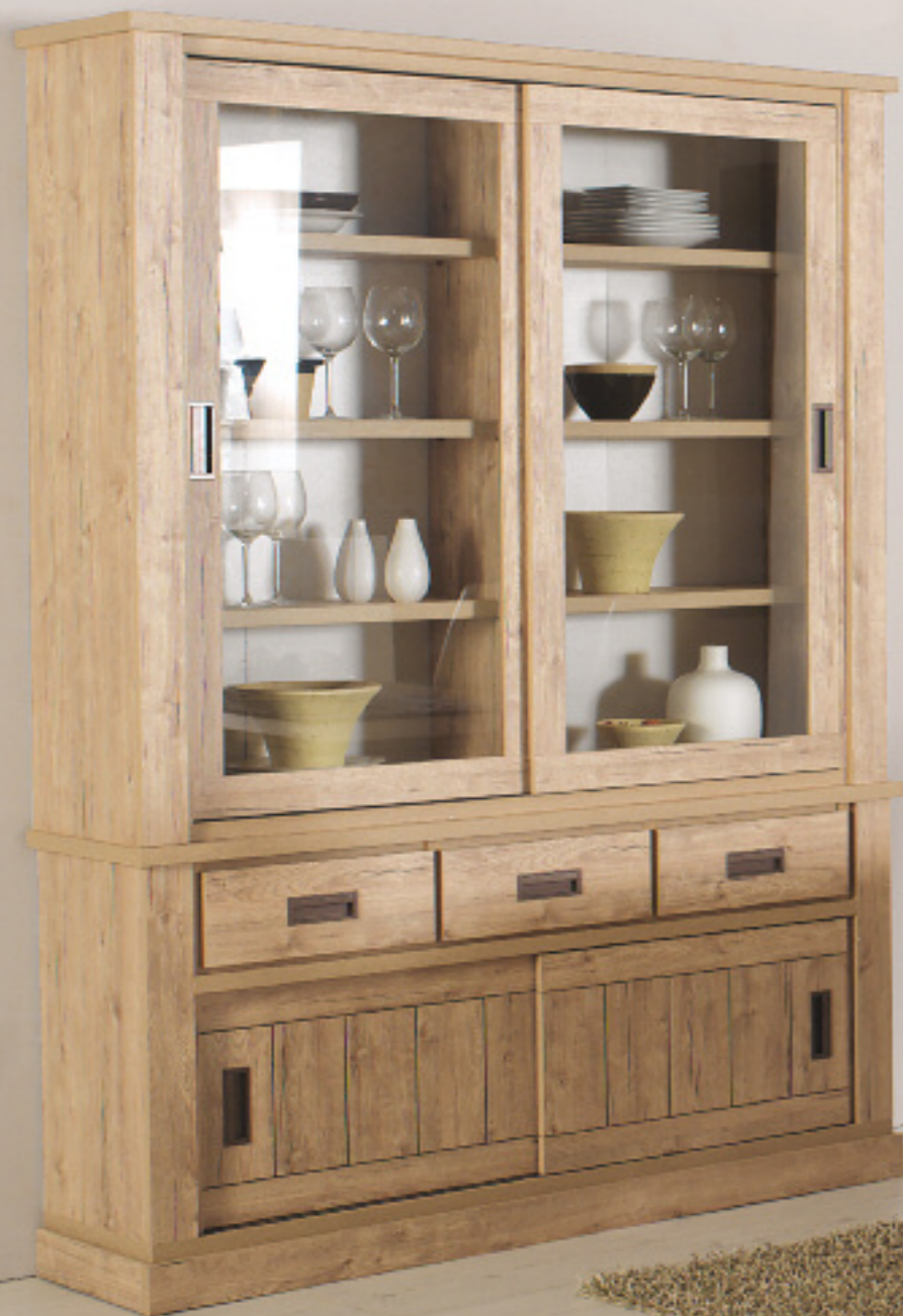
Art. 120 RO Base grande 3 cassetti 2 ante scorrevoli L 220 P 50 H 95

Sala modello Malta finitura rovere stressato