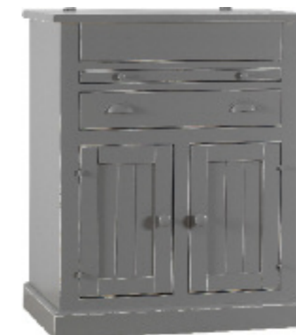
Art. 46 Margot Madia dogata finitura grigio anticato L 84 P 54 H 102