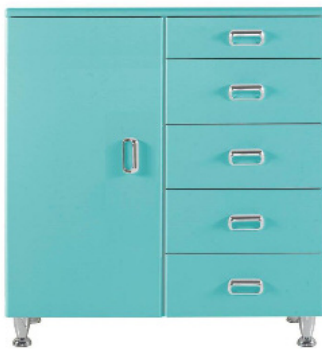
Art. 804 Base 1 anta 5 cassetti laccato verde L 91 P 44 H 104