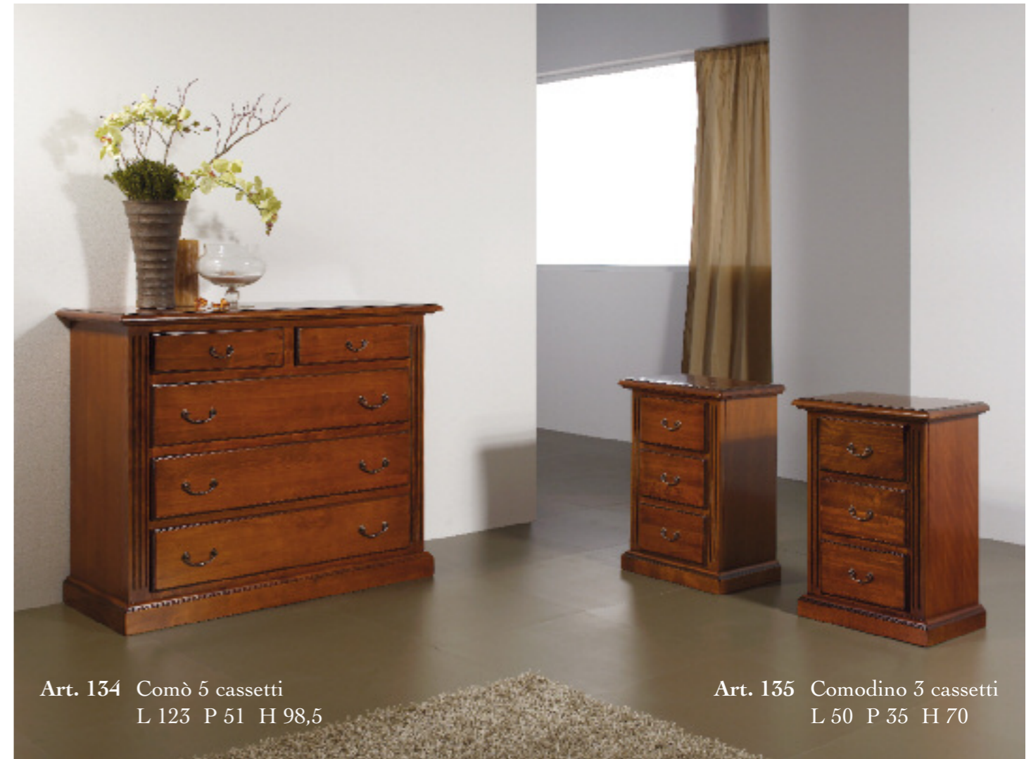
Art. 134 Comò 5 cassetti L 123 P 51 H 98,5