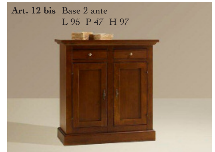
Art. 12 bis Base 2 ante L 95 P 47 H 97