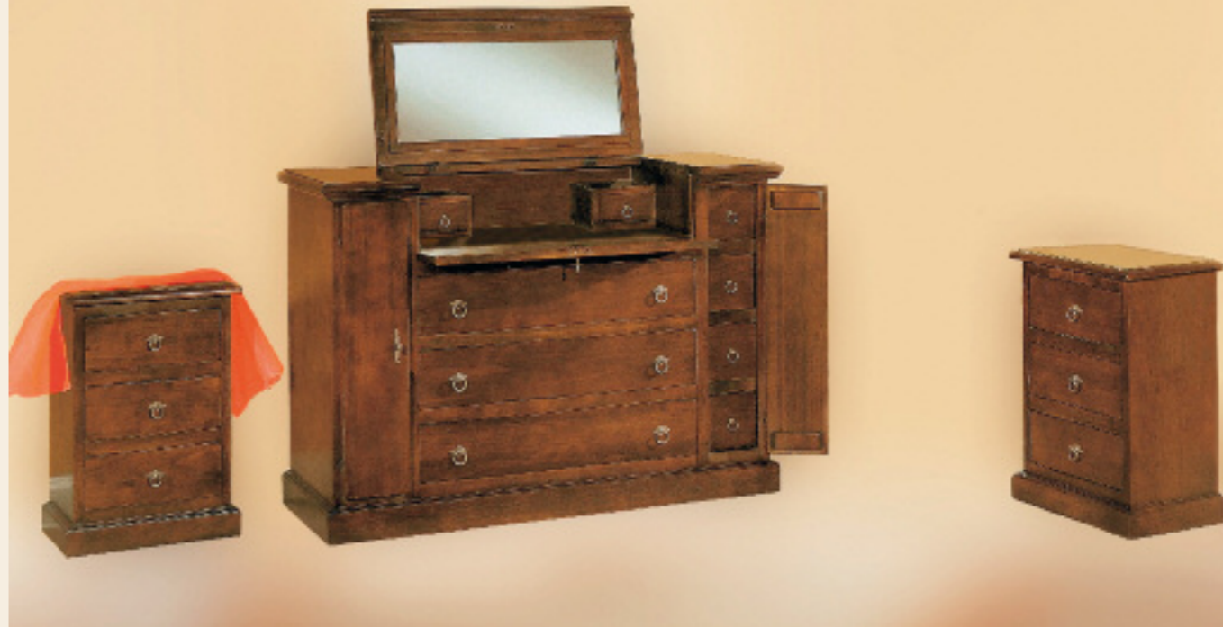
Art. 2071 Gruppo comò con ribalta e ripiani interni con comodini Comò L 135 P 48 H 99 Comodino L 50 P 36 H 70