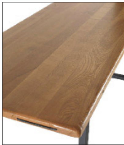
Art. 110 Tavolo modello Idea in rovere massello piano color quercia basamento in ferro L 220 P 100 H 80