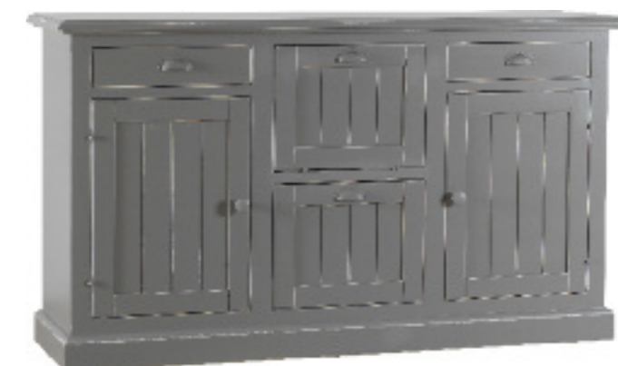
Art. 45 Margot Base 2 ante 2 cassetti 2 cestoni dogata finitura grigio anticato L 165 P 45 H 95