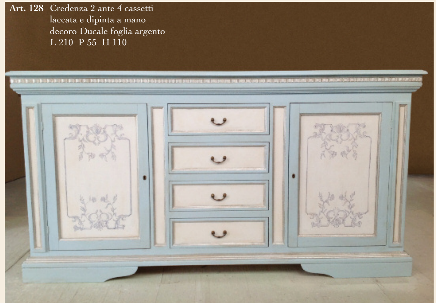
Art. 128 Credenza 2 ante 4 cassetti laccata e dipinta a mano decoro Ducale foglia argento L 210 P 55 H 110