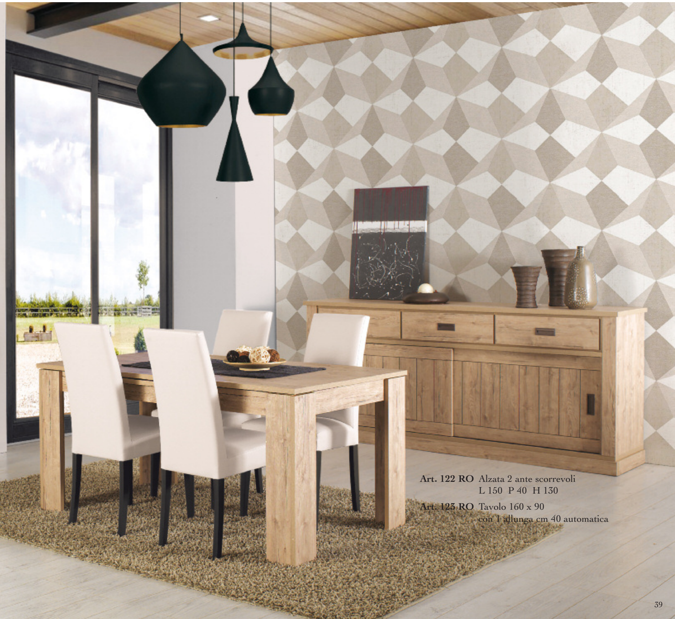
Art. 122 RO Alzata 2 ante scorrevoli L 150 P 40 H 130