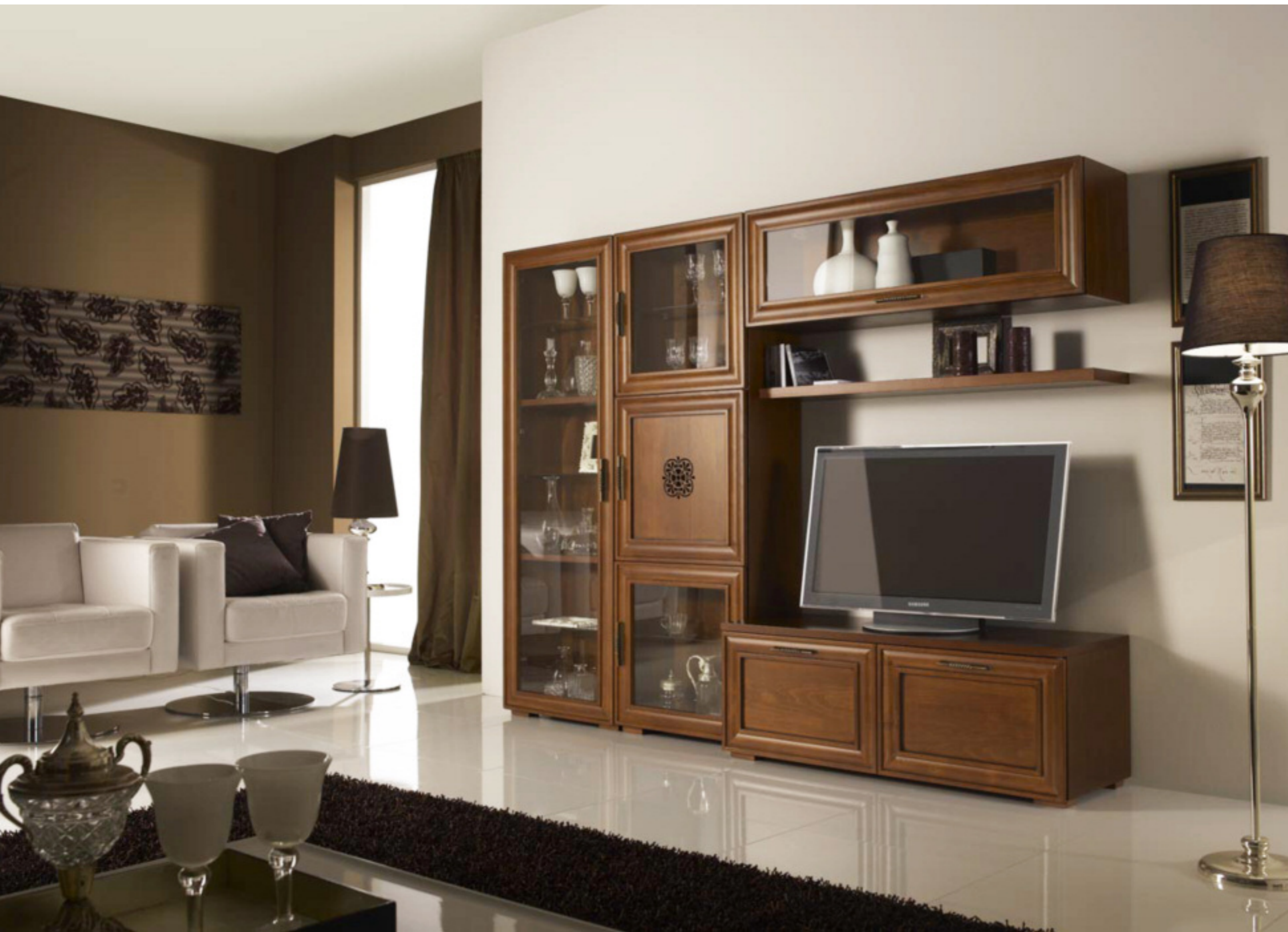
Composizione 4 finitura noce L 240