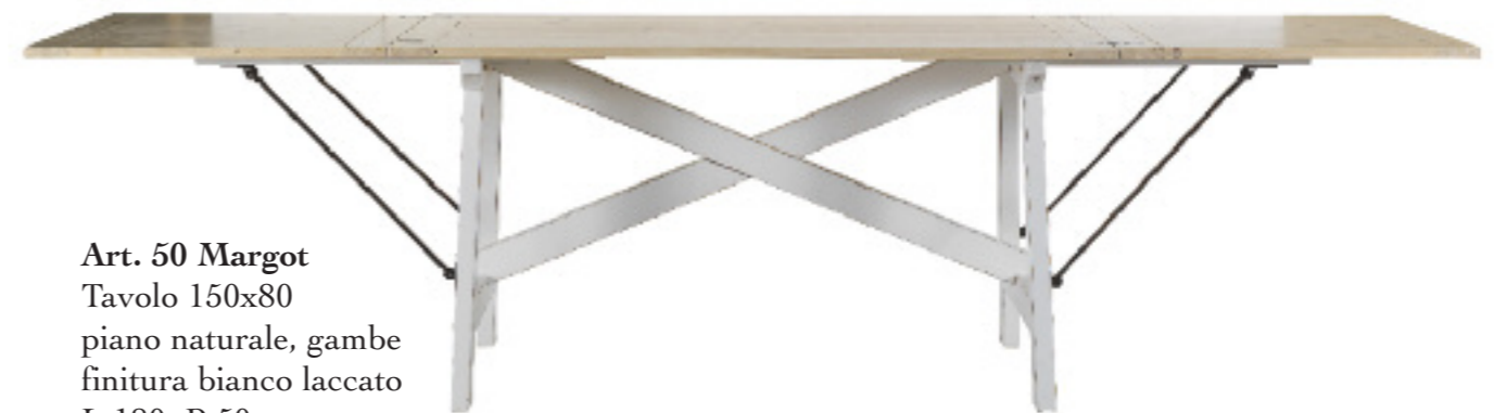
Art. 50 Margot Tavolo 150x80 piano naturale, gambe finitura bianco laccato L 180 P 50