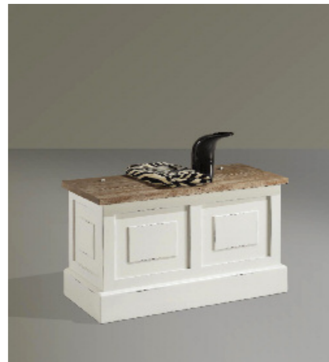
Art. 93 Shabby Cassapanca Piano in frassino massiccio noce sbiancato e spazzolato, struttura bianco laccato L 86,5 P 41 H 51