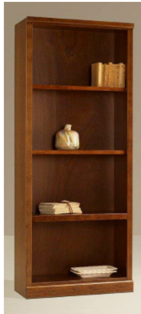
Art. 29 bis Elemento a giorno da cm 90; L 86 P 38 H 212