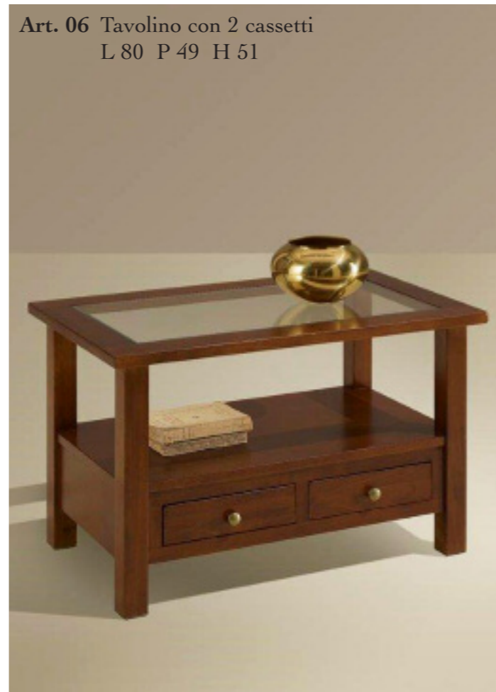
Art. 06 Tavolino con 2 cassetti L 80 P 49 H 51