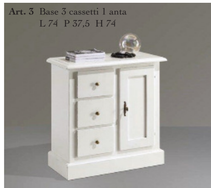
Art. 3 Base 3 cassetti 1 anta L 74 P 37,5 H 74