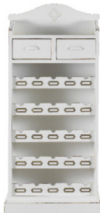
Art. 48 Margot Cantinetta finitura bianco laccato L 66 P 33 H 141