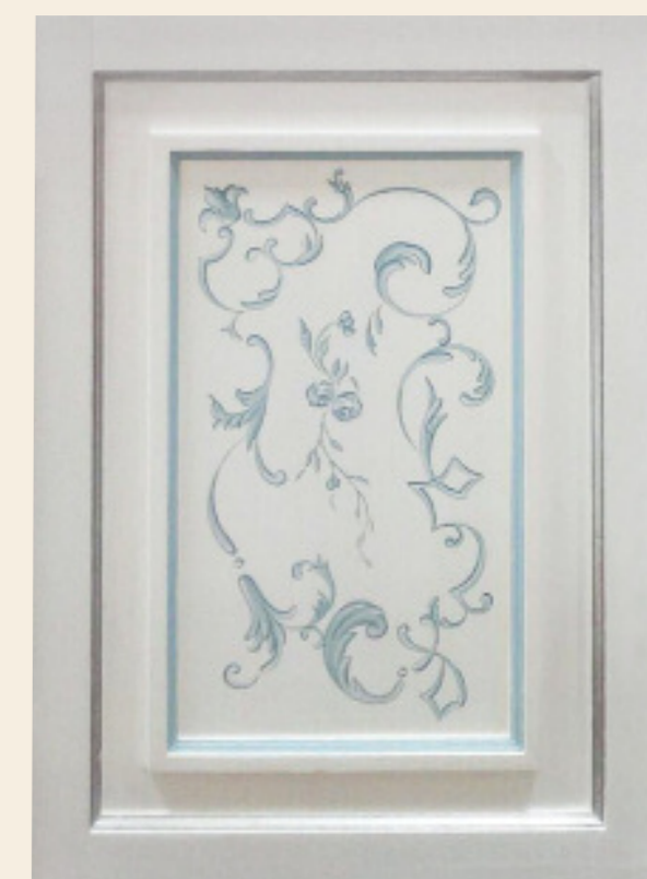
Decoro Toscano celeste, foglia argento