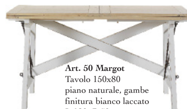
Art. 50 Margot Tavolo 150x80 piano naturale, gambe finitura bianco laccato L 180 P 50