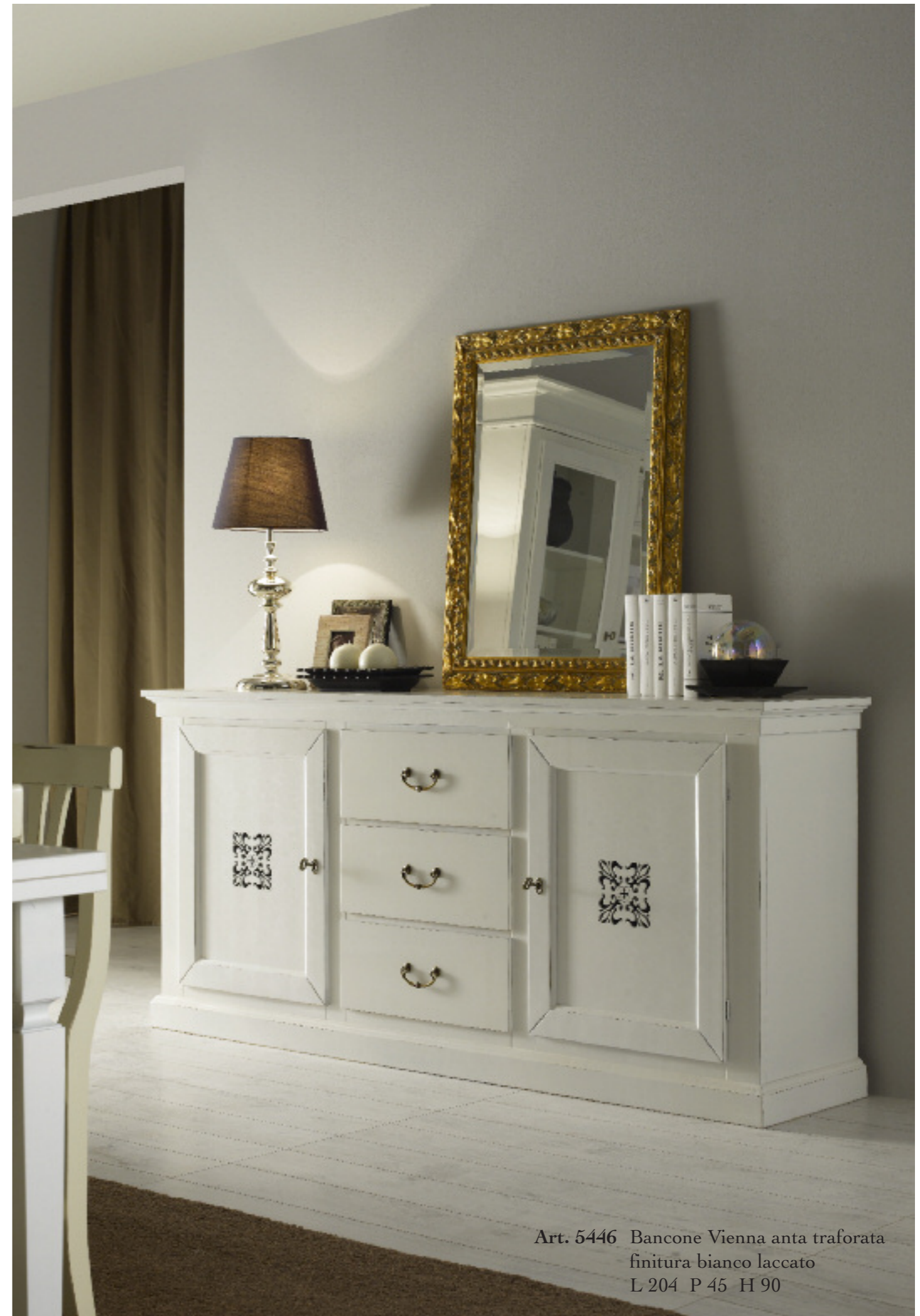
Art. 5446 Bancone Vienna anta traforata finitura bianco laccato L 204 P 45 H 90