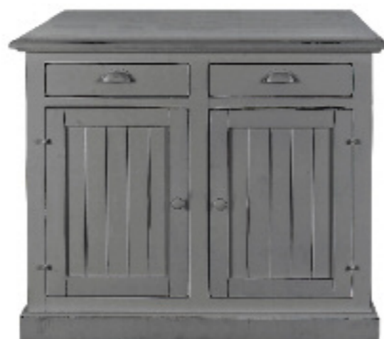
Art. 44 bis Margot Base 2 ante dogata finitura grigio anticato L 115 P 45 H 92