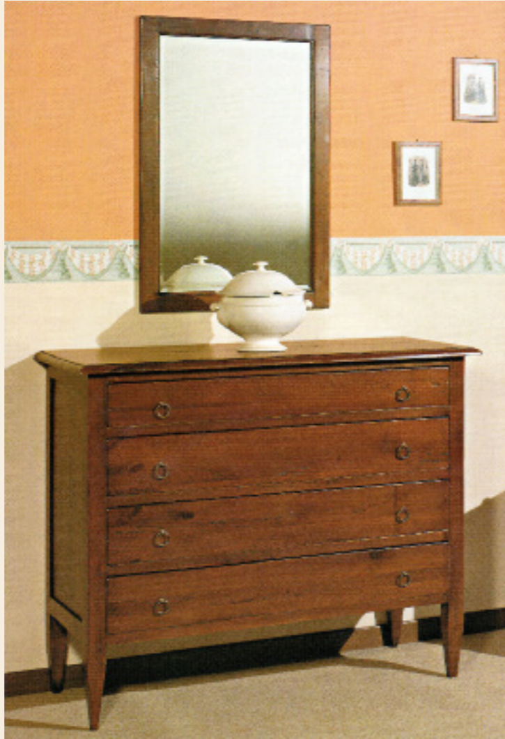
Art. 1750 Comò spillo L 117 P 50 H 100