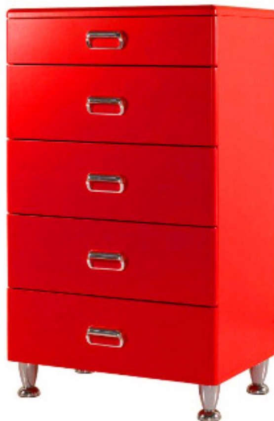
Art. 803 Cassettiera 5 cassetti laccato rosso L 64 P 44 H 104