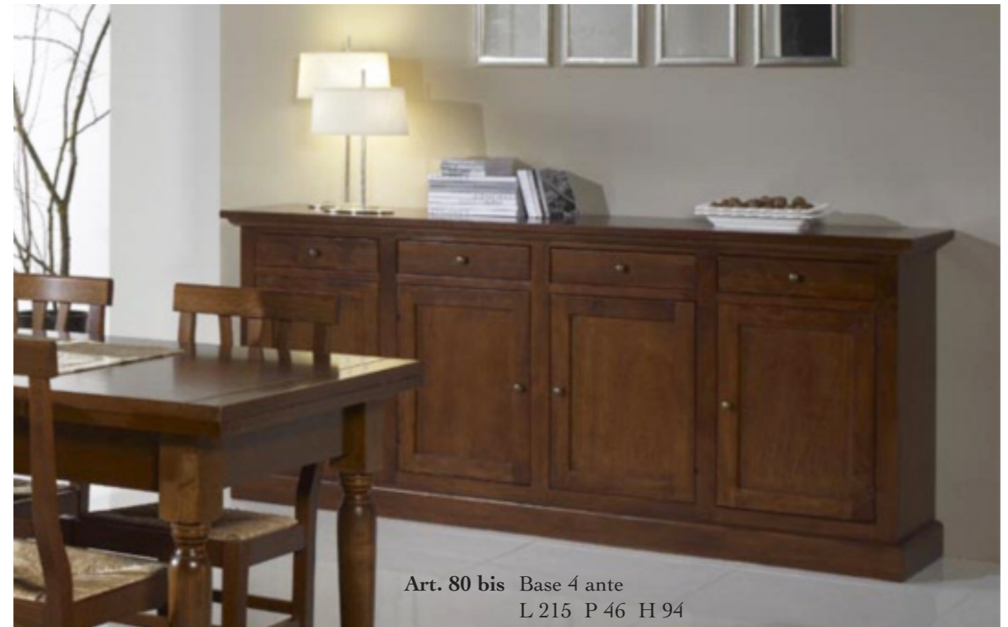
Art. 80 bis Base 4 ante L 215 P 46 H 94