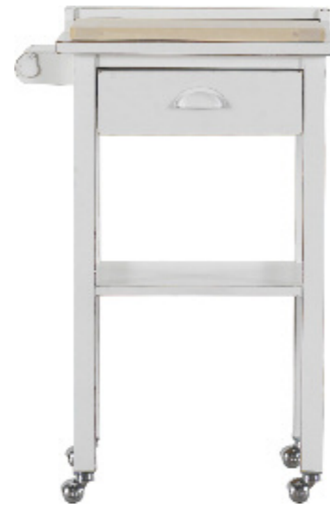
Art. 49 Margot Tavolo cucina finitura bianco laccato L 60 P 42 H 90