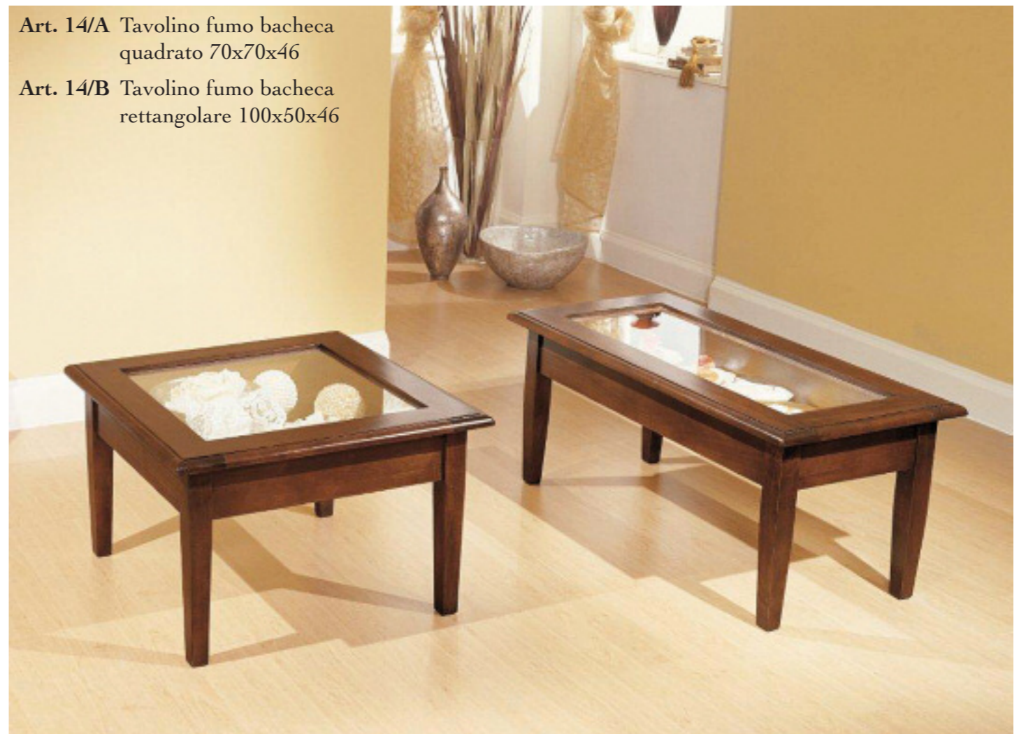
Art. 14/A Tavolino fumo bacheca quadrato 70x70x46