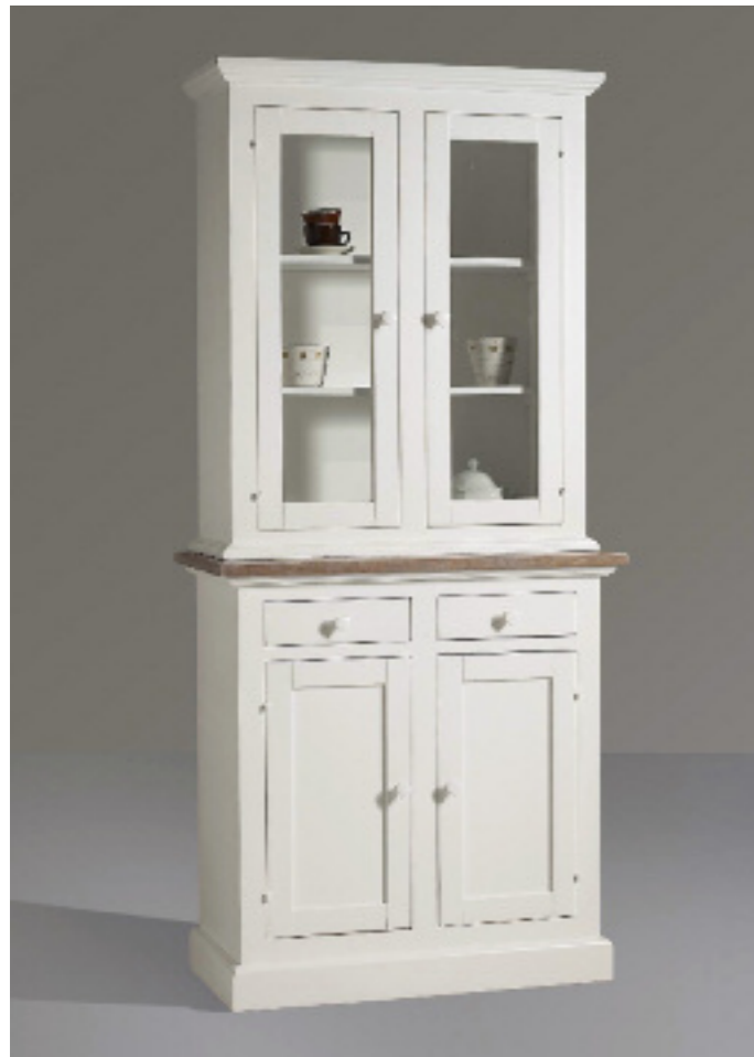
Art. 12 Shabby Vetrina 2 ante Piano impiallacciato in frassino noce sbiancato e spazzolato, struttura bianco laccato L 95 P 47 H 200