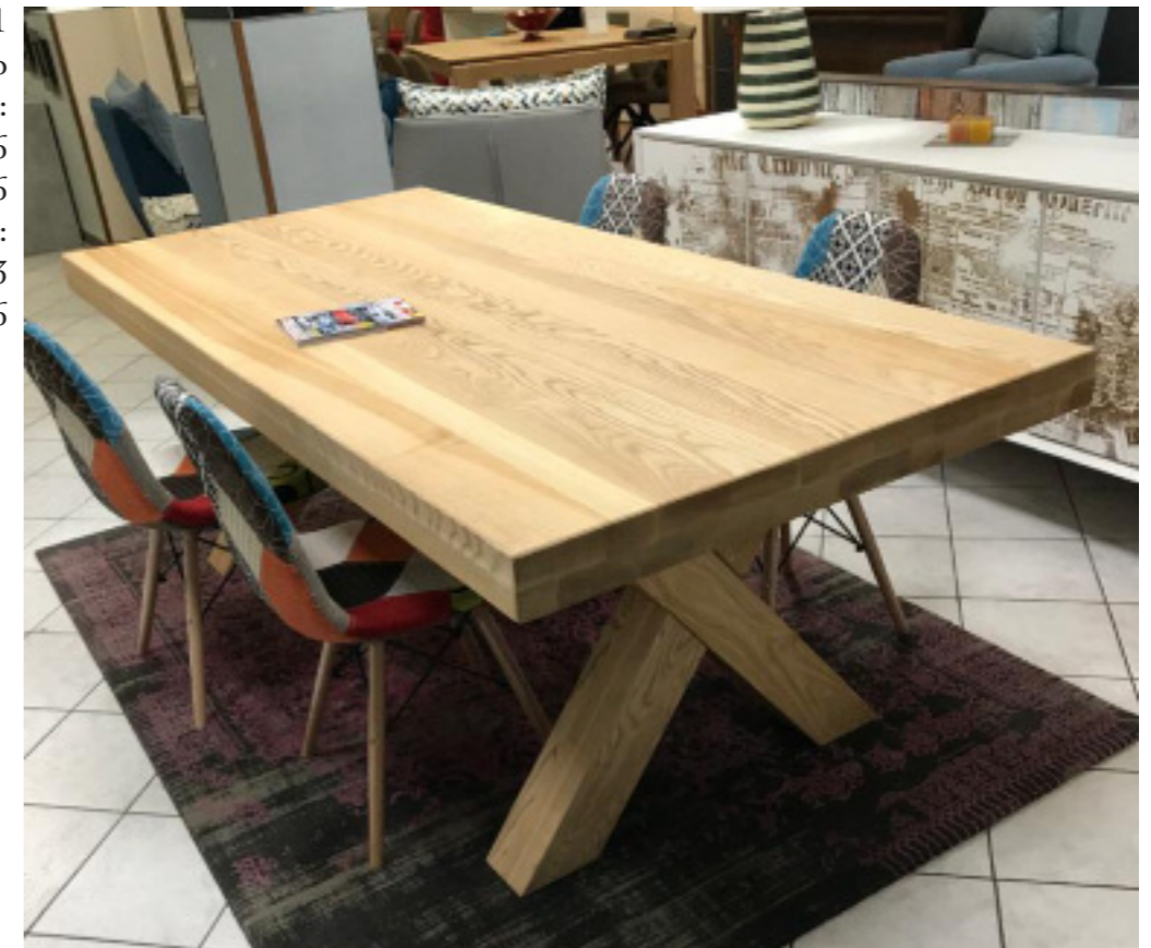
Art. 221 Tavolo fisso in legno massello misure disponibili: cm 200 x 100 H 76 cm 180 x 100 H 76 spessori disponibili: cm 3 cm 6