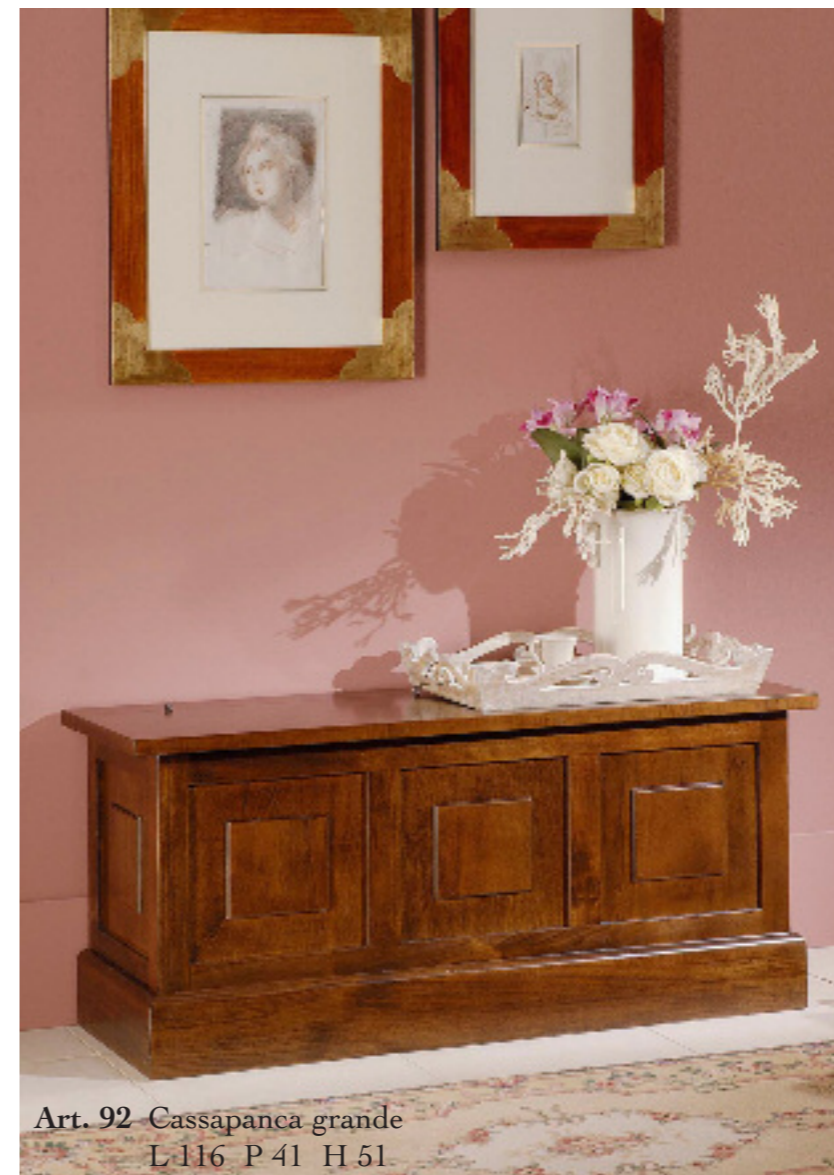
Art. 92 Cassapanca grande L 116 P 41 H 51