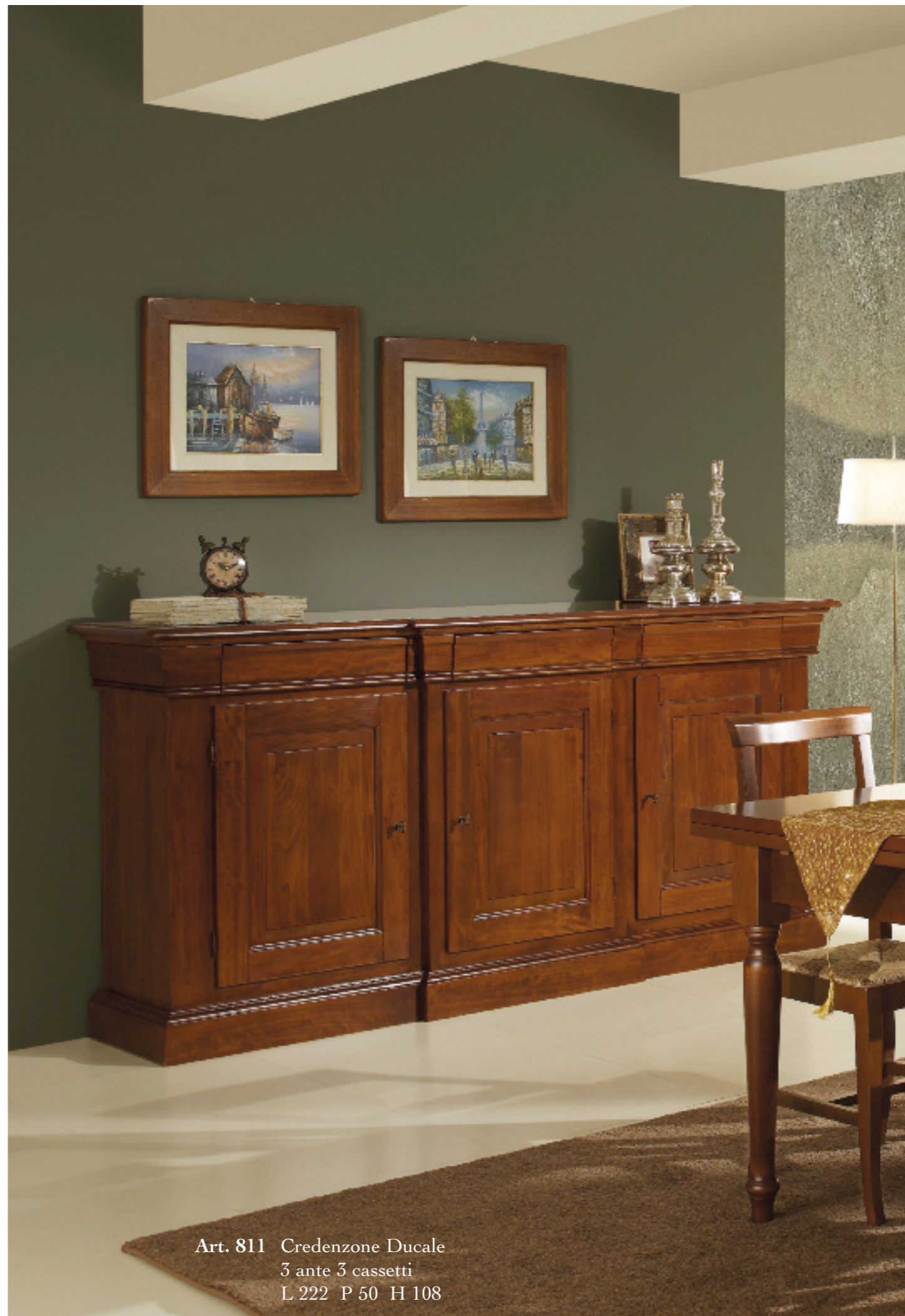
Art. 811 Credenzone Ducale 3 ante 3 cassetti L 222 P 50 H 108