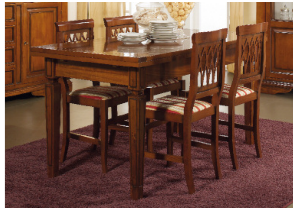
Art. 89 Tavolo allungabile al centro con una allunga, gamba rigata L 160 P 90 H 80 chiuso L 200 P 90 H 80 aperto