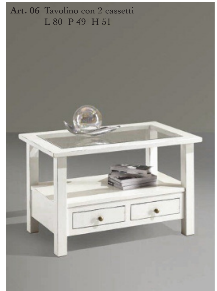
Art. 06 Tavolino con 2 cassetti L 80 P 49 H 51