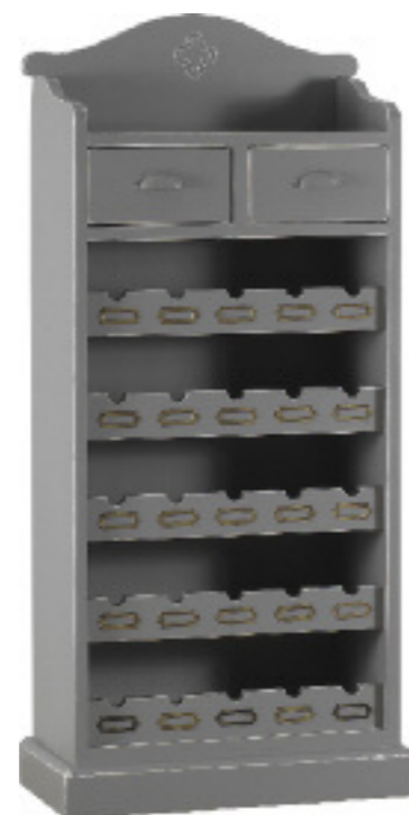
Art. 48 Margot Cantinetta finitura grigio anticato L 66 P 33 H 141