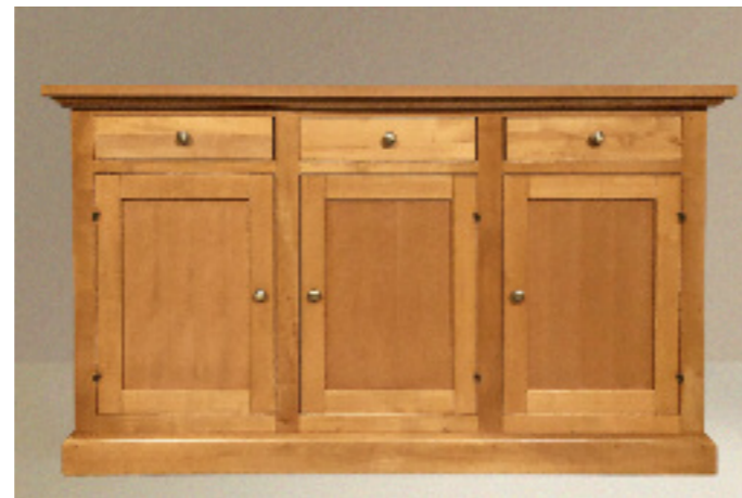
Art. 13 bis MIELE Base 3 ante 3 cassetti finitura miele L 165 P 47 H 94