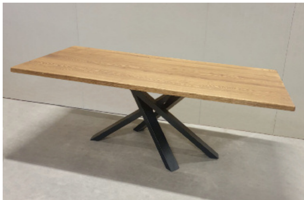
Art. 224 Tavolo in legno massello, gambe in ferro misure disponibili: cm 200 x 100 H 76 cm 180 x 100 H 76 spessori disponibili: cm 3 cm 6