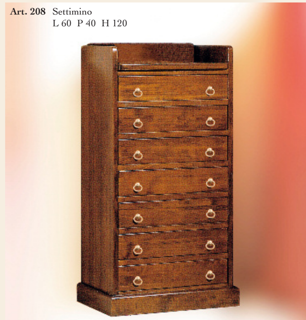
Art. 208 Settimino L 60 P 40 H 120