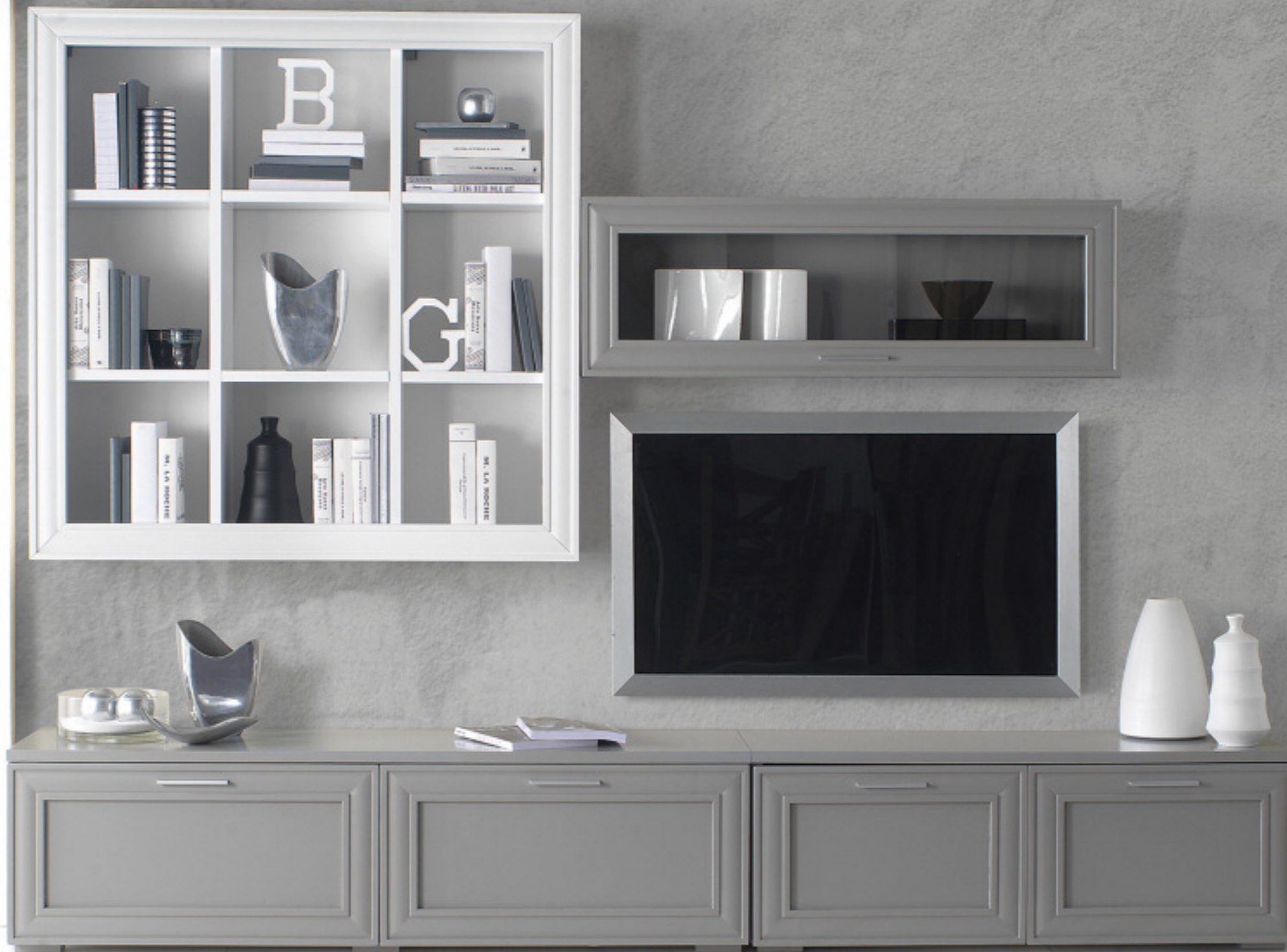
Composizione 3 finitura bianco/grigio laccato L 280