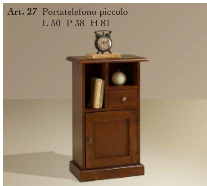
Art. 27 Portatelefono piccolo L 50 P 38 H 81