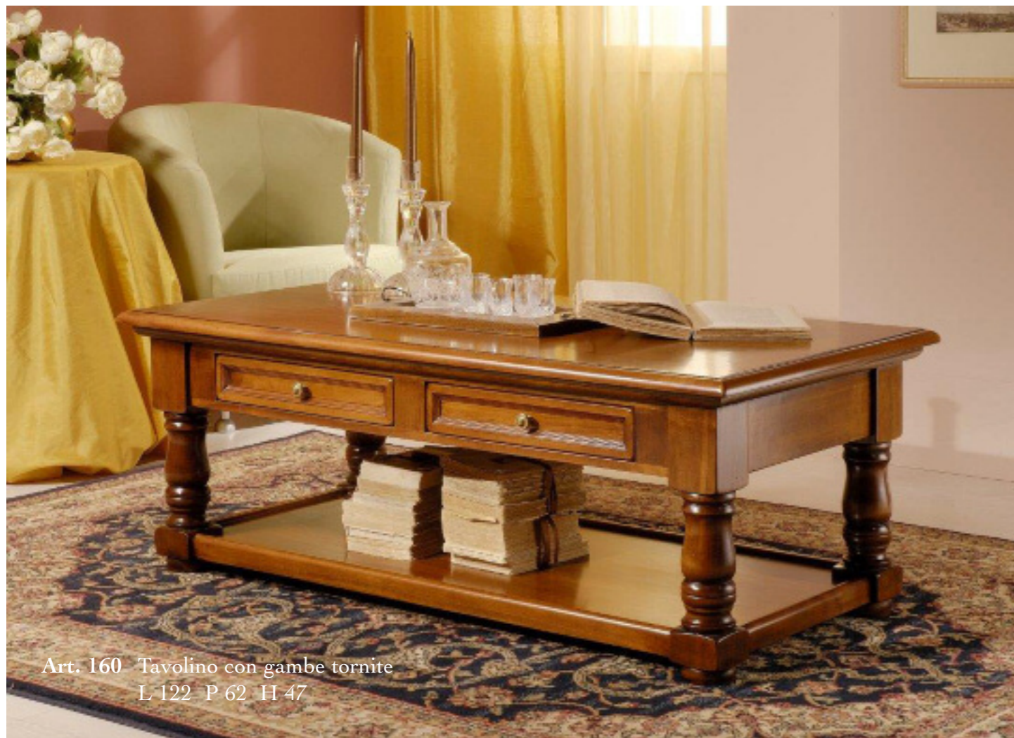
Art. 160 Tavolino con gambe tornite L 122 P 62 H 47