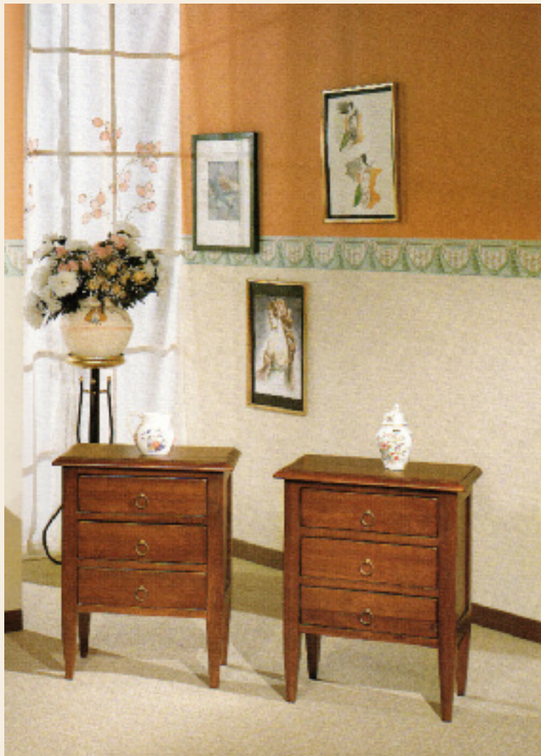
Art. 1751 Comodino spillo L 60 P 35 H 67