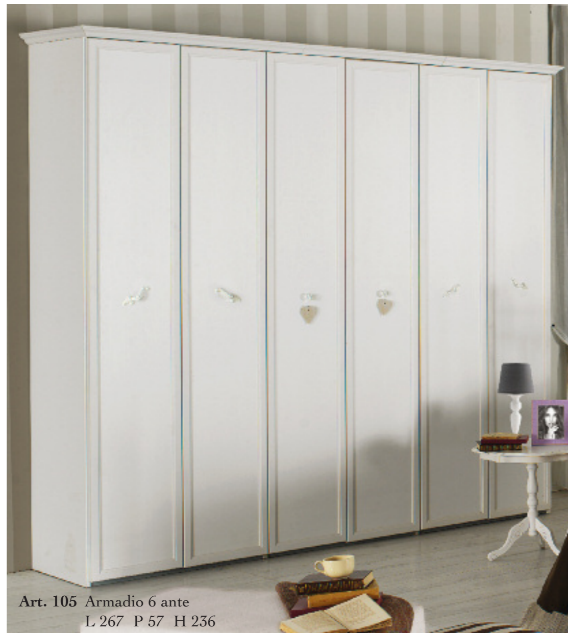
Art. 105 Armadio 6 ante L 267 P 57 H 236