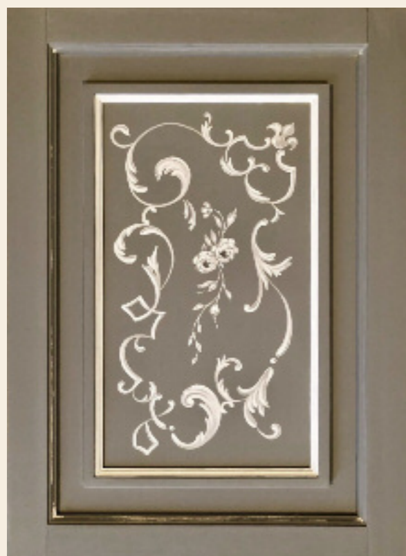
Decoro Toscano bianco, foglia argento