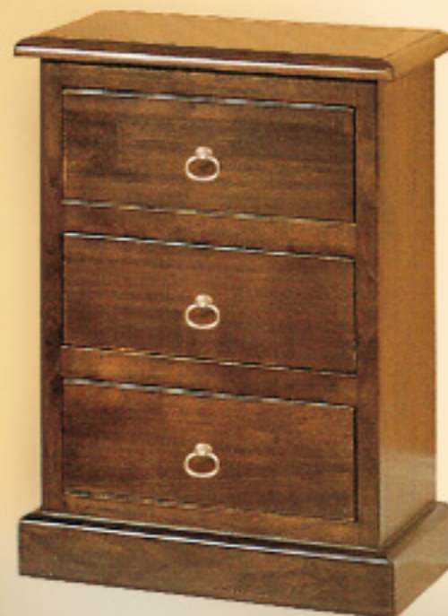
Art. 203 Comodino 3 cassetti L 50 P 36 H 70