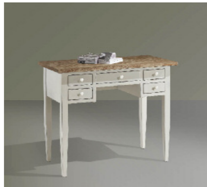
Art. 209 Shabby Scrivania senza alzata Piano impiallacciato in frassino noce sbiancato e spazzolato, struttura bianco laccato L 98 P 50 H 82