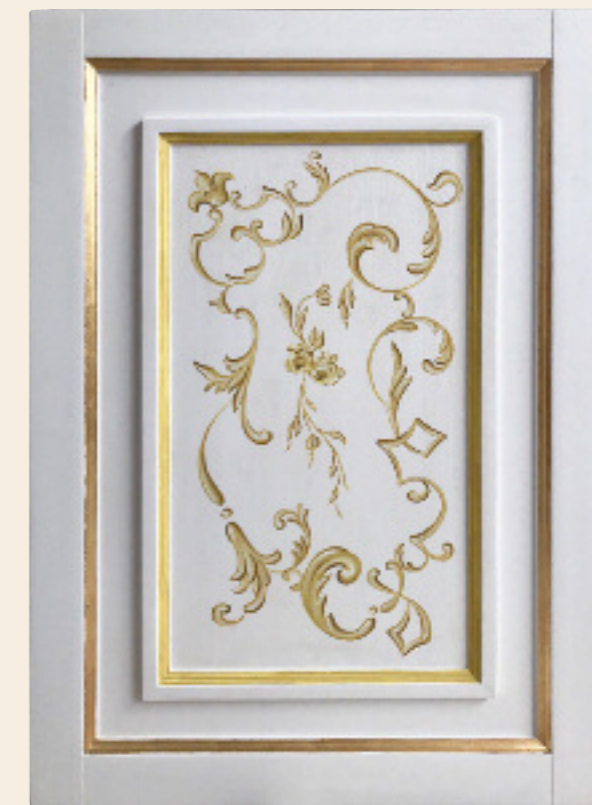
Decoro Toscano giallo ocra, foglia oro