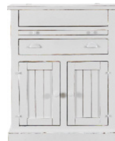
Art. 46 Margot Madia dogata finitura bianco laccato L 84 P 54 H 102