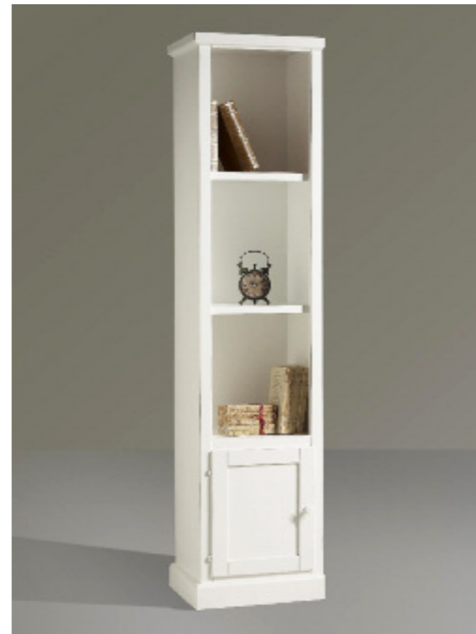
Art. 28 Shabby Libreria 1 anta Struttura bianco laccato L 47 P 38 H 212