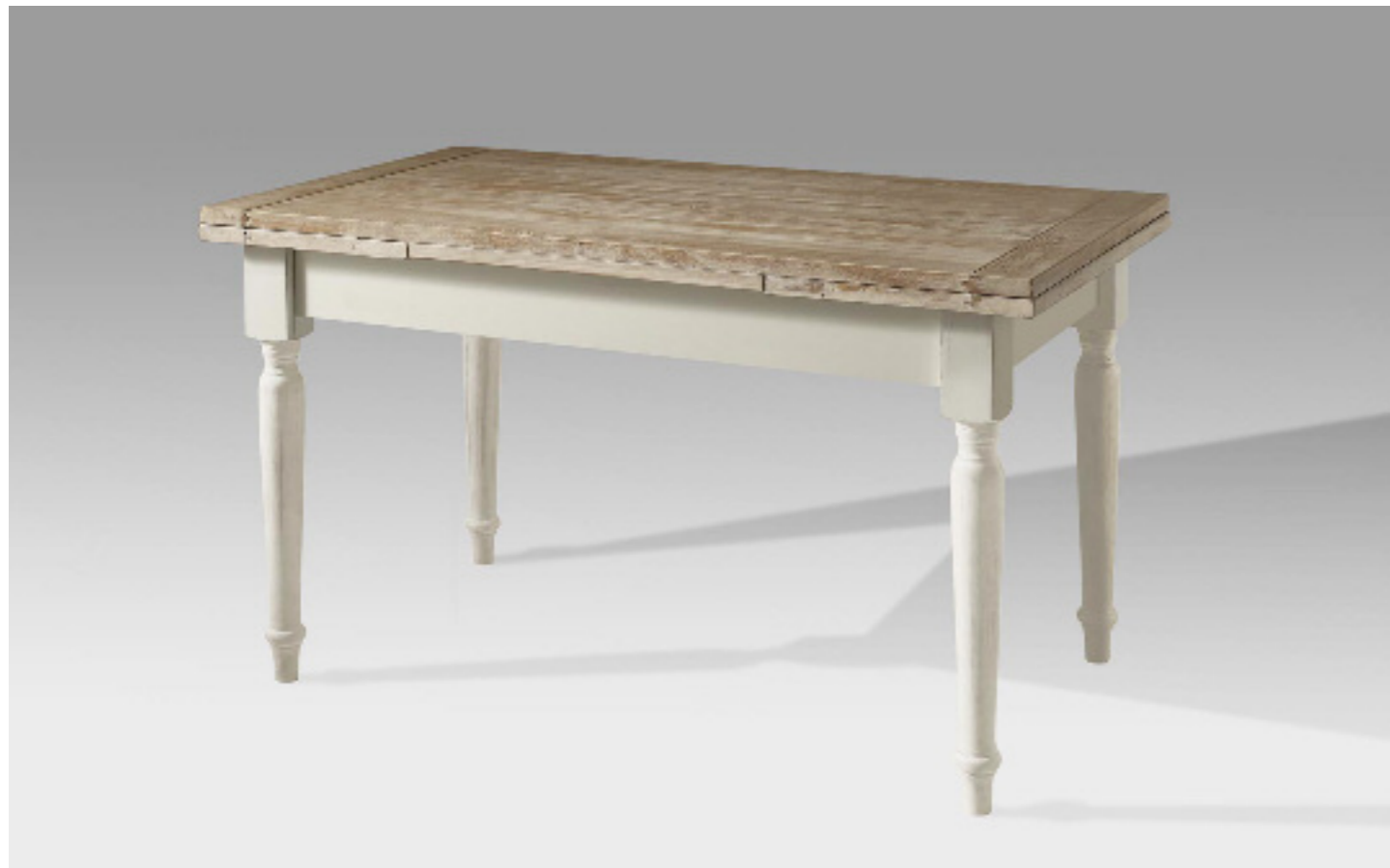
Art. 13/M Shabby Tavolo 140x80 allungabile 220 Piano impiallacciato in frassino noce sbiancato e spazzolato, testate in frassino massiccio, gambe e castello bianco laccato L 140 P 80 H 80 chiuso L 220 P 80 H 80 aperto