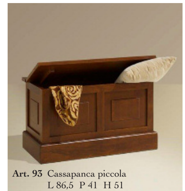
Art. 93 Cassapanca piccola L 86,5 P 41 H 51