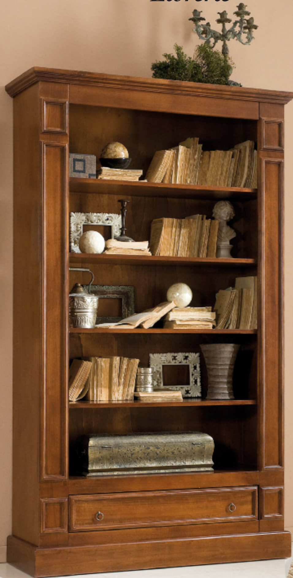
Art. 303 Libreria con cassetto L 126 P 42 H 212