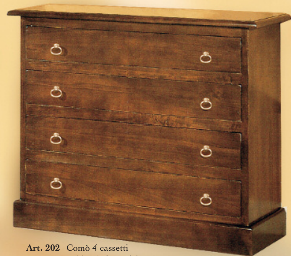
Art. 202 Comò 4 cassetti L 115 P 45 H 96