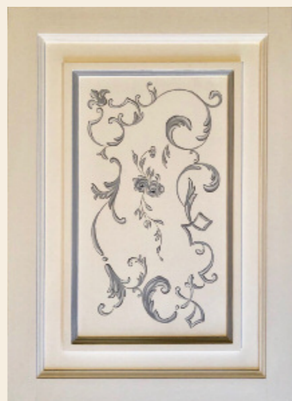
Decoro Toscano grigio, foglia argento