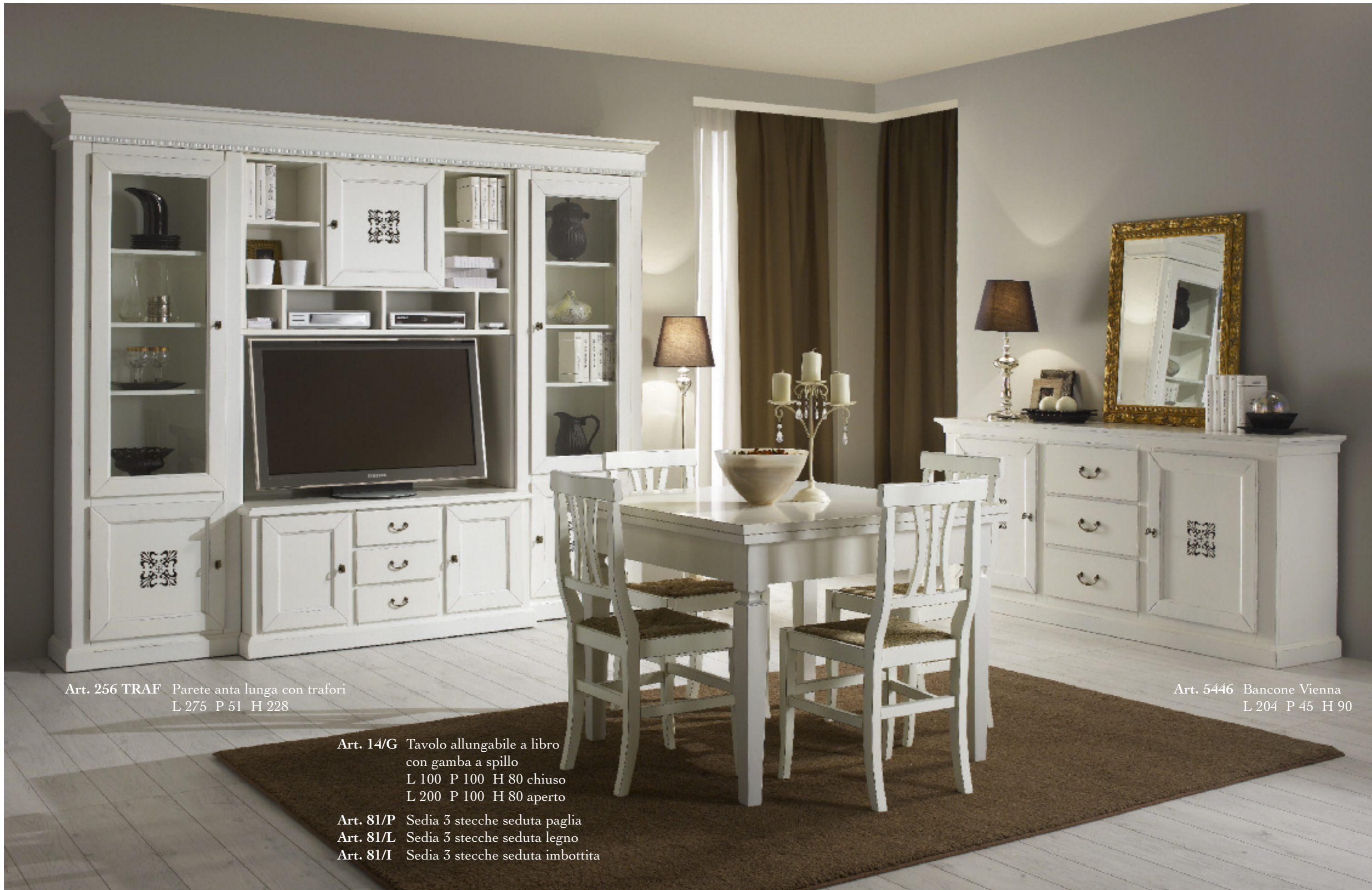
Art. 256 TRAF Parete anta lunga con trafori L 275 P 51 H 228