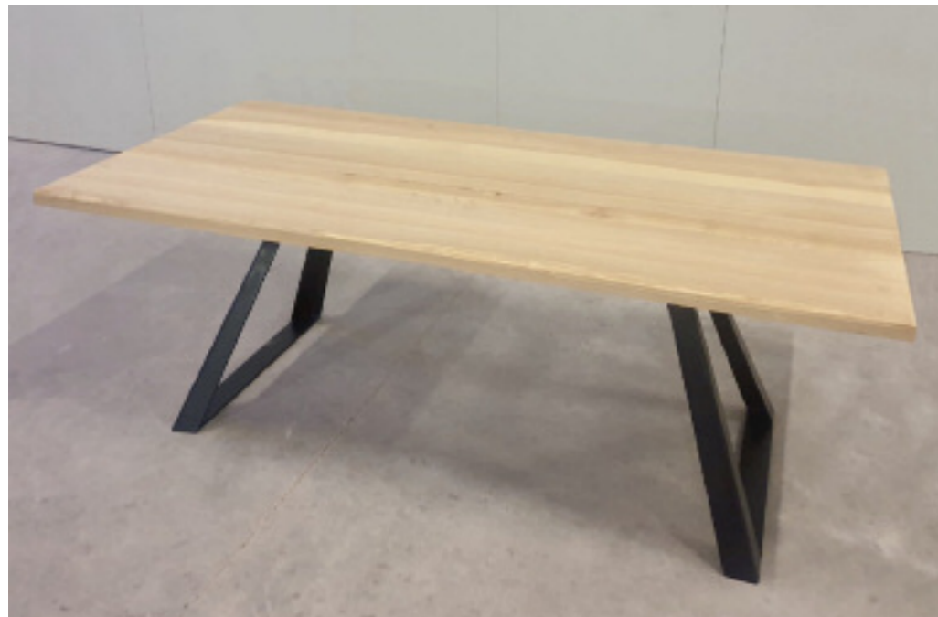
Art. 223 Tavolo in legno massello, gambe in ferro misure disponibili: cm 200 x 100 H 76 cm 180 x 100 H 76 spessori disponibili: cm 3 cm 6