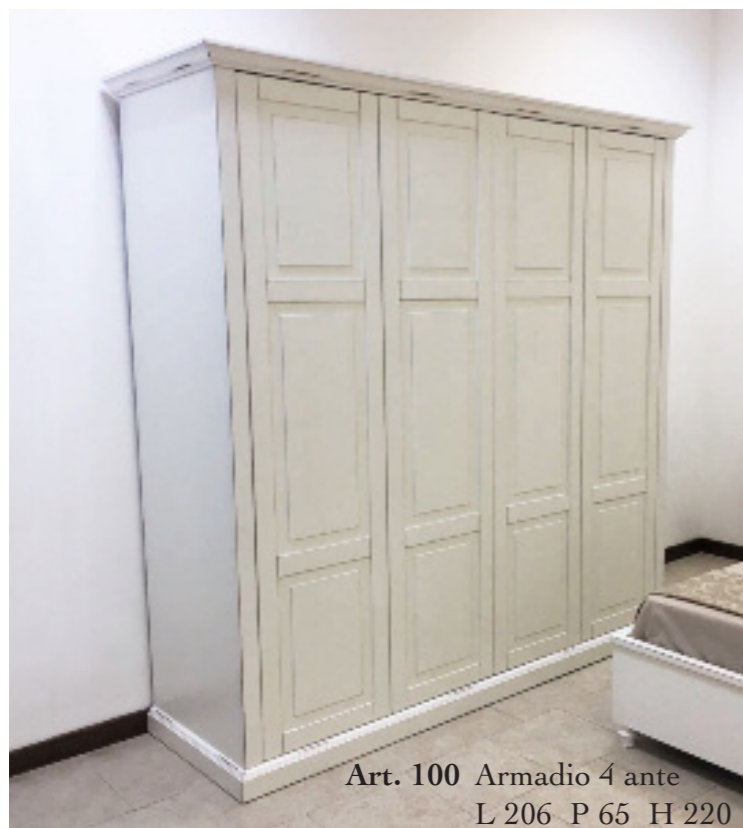
Art. 100 Armadio 4 ante L 206 P 65 H 220