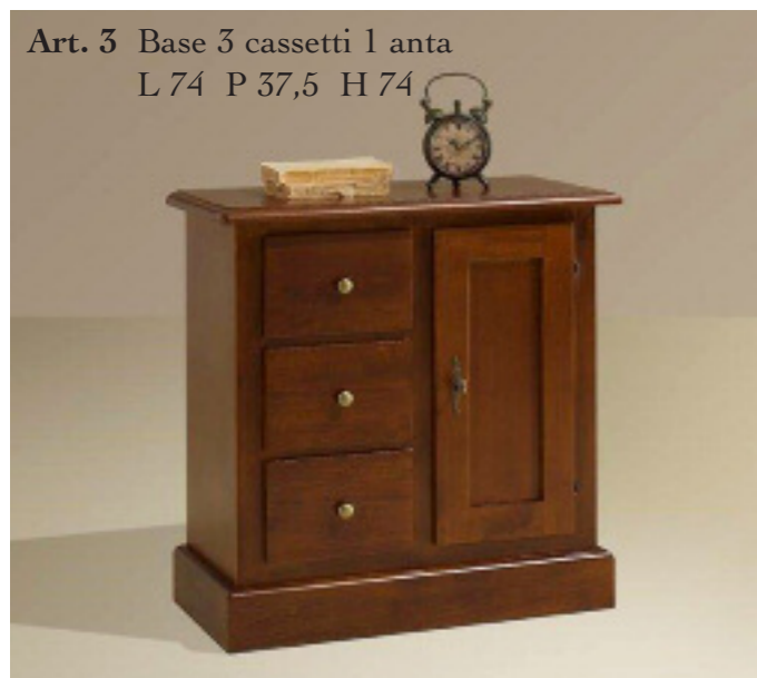
Art. 3 Base 3 cassetti 1 anta L 74 P 37,5 H 74