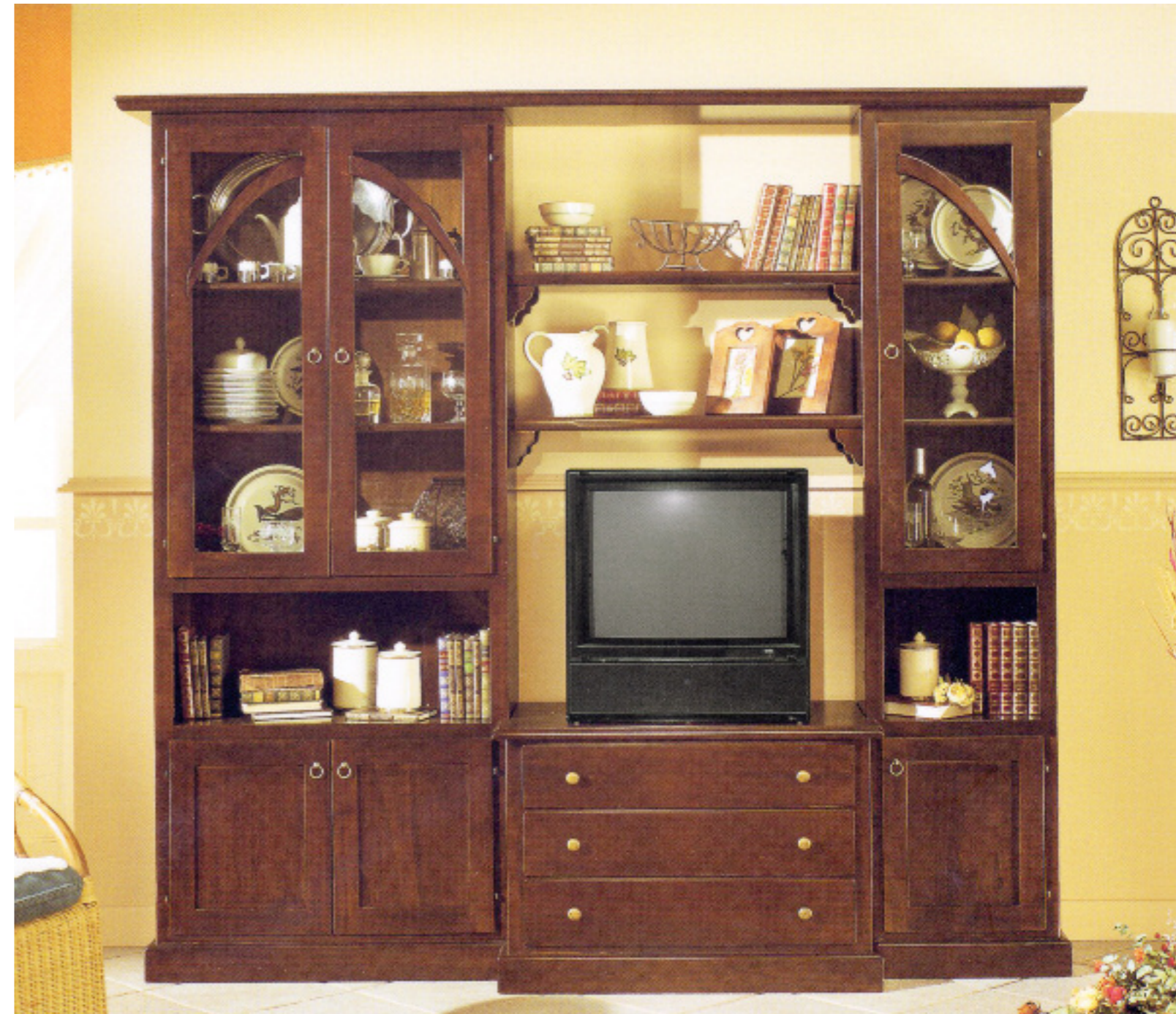
Art. 82 Parete L 230 con mensole L 230 P 51 H 214