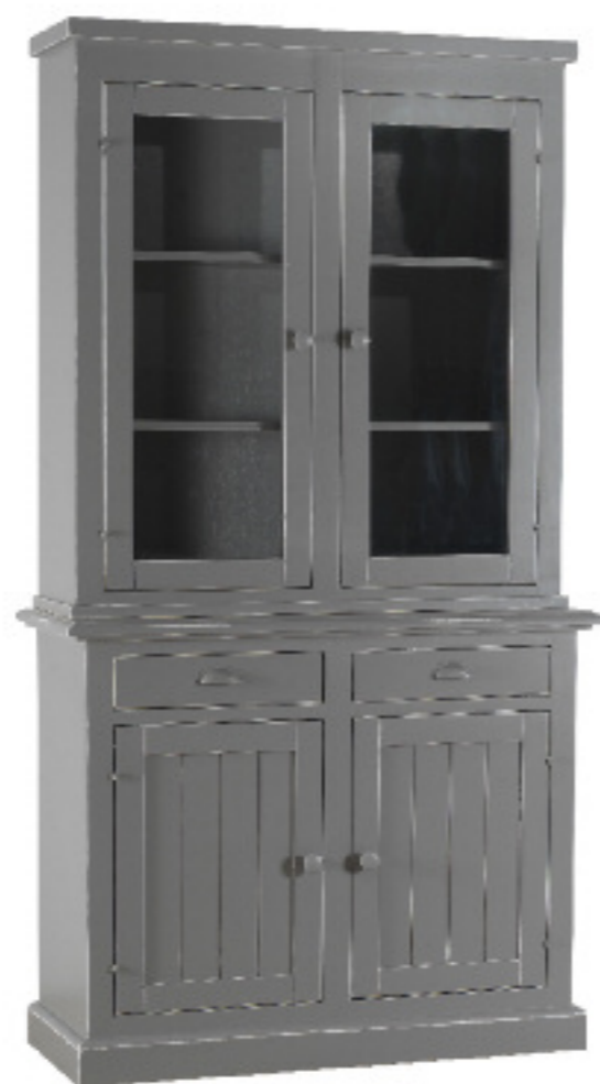
Art. 44 Margot Vetrina 2 ante dogata finitura grigio anticato L 115 P 45 H 213