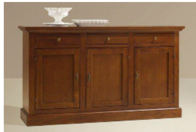
Art. 13 bis Base 3 ante 3 cassetti L 165 P 46 H 94