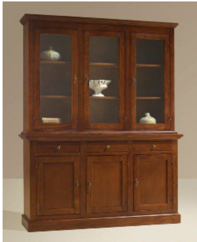
Art. 13 Vetrina 3 ante L 165 P 46 H 214