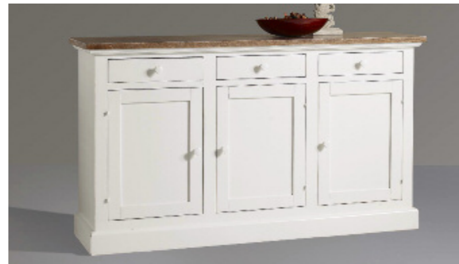
Art. 13 bis Shabby Base 3 ante Piano impiallacciato in frassino noce sbiancato e spazzolato, struttura bianco laccato L 165 P 47 H 94