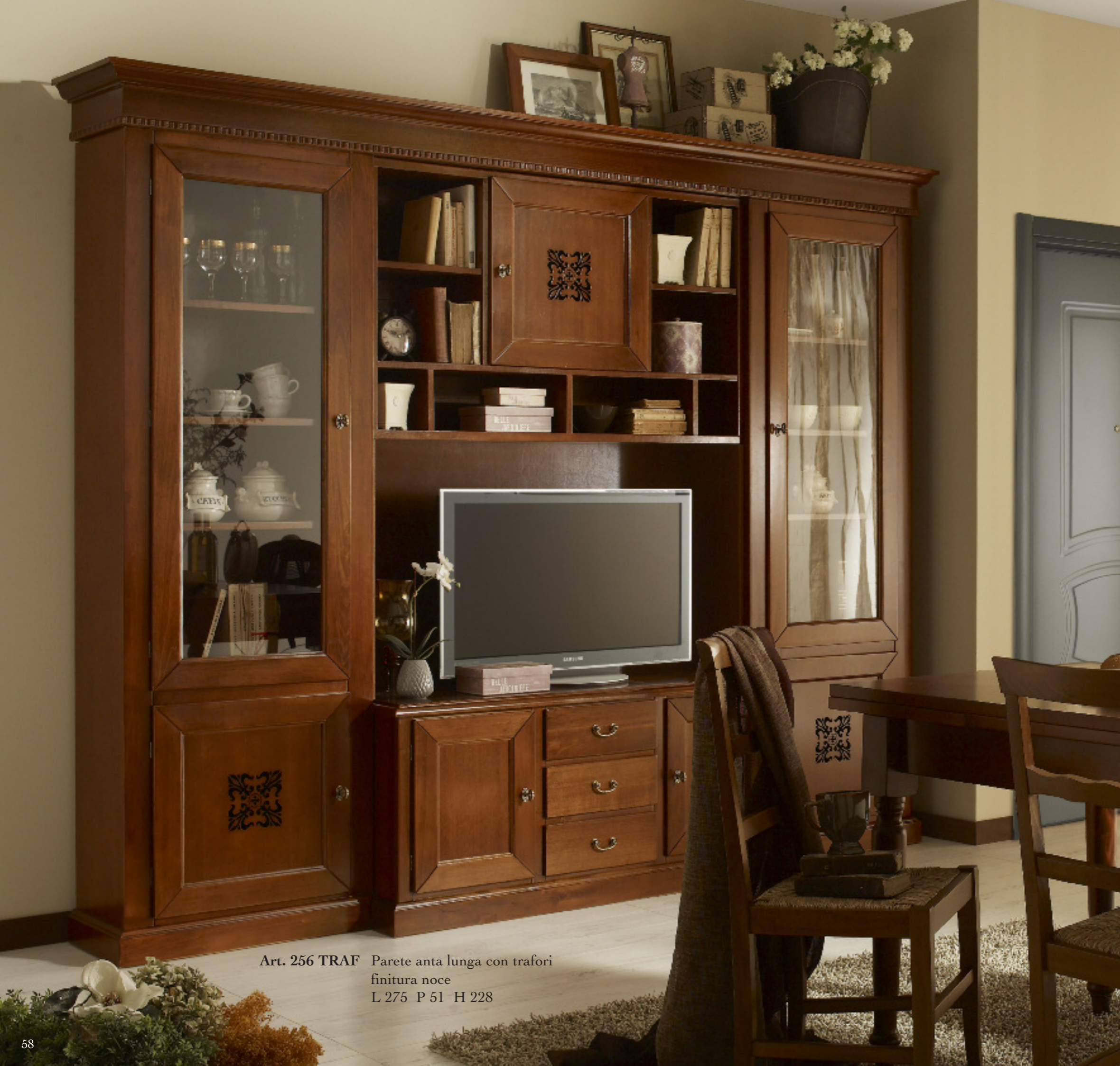
Art. 256 TRAF Parete anta lunga con trafori finitura noce L 275 P 51 H 228