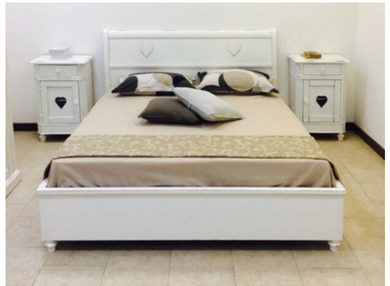
Art. 103 Letto matrimoniale L 174 P 205 H 103