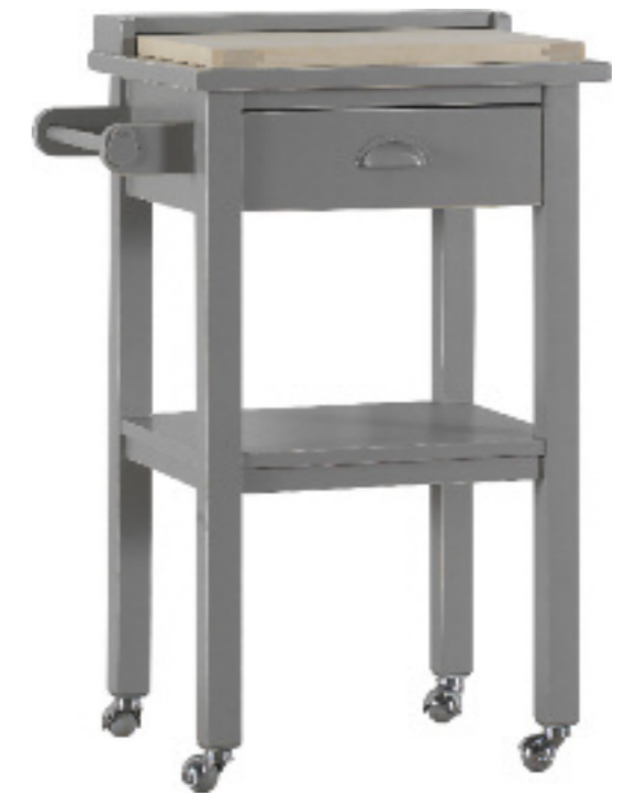
Art. 49 Margot Tavolo cucina finitura grigio anticato L 60 P 42 H 90