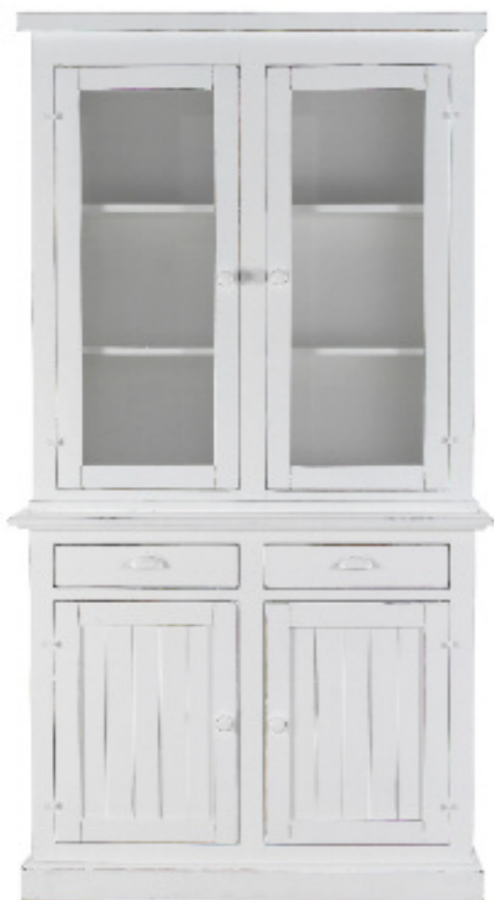
Art. 44 Margot Vetrina 2 ante dogata finitura bianco laccato L 115 P 45 H 213

disponibile in finitura bianco laccato, amaranto, grigio anticato su base bianca