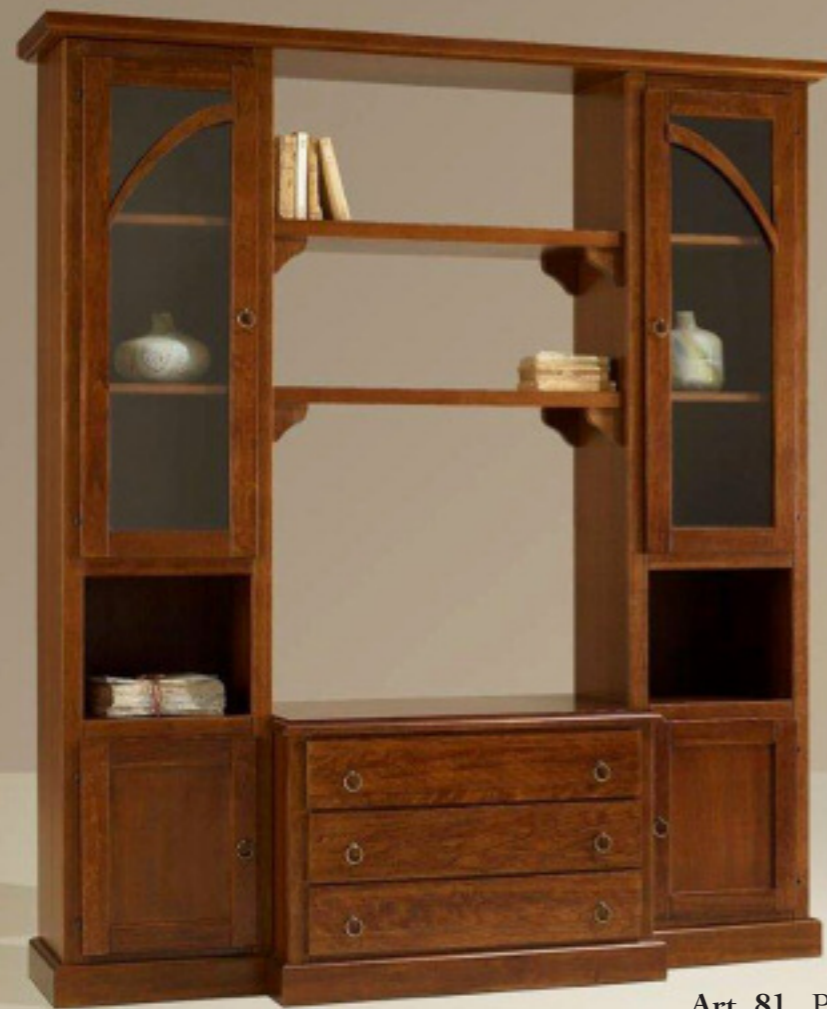
Art. 81 Parete L 190 con mensole L 190 P 51 H 214