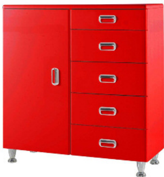
Art. 804 Base 1 anta 5 cassetti laccato rosso L 91 P 44 H 104