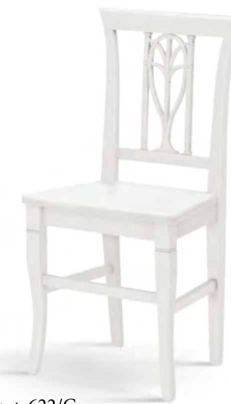
Articolo 622/G Sedia con fondino legno. Chair with wooden seat. cm. L. 46 P. 41,5 H. 95,5 H.s. 45,5