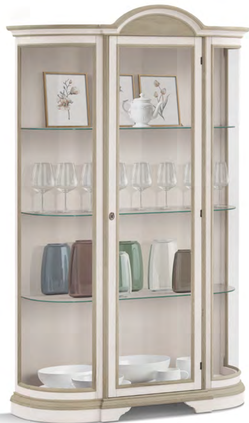
Articolo 478/G Vetrina 1 ante vetro. Showcase 1 glass door. cm. L. 122 P. 41 H. 185