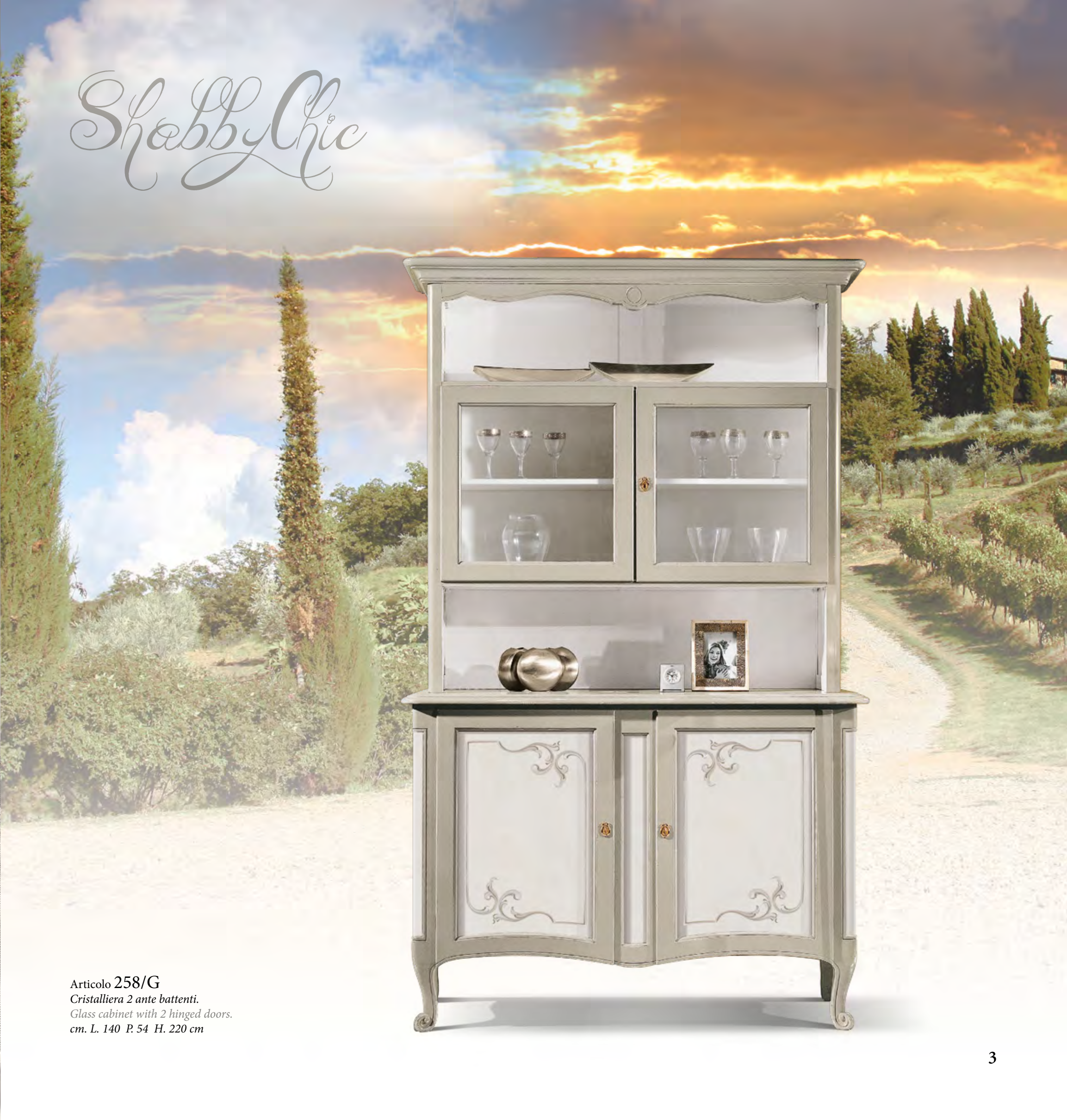
Articolo 258/G Cristalliera 2 ante battenti. Glass cabinet with 2 hinged doors. cm. L. 140 P. 54 H. 220 cm