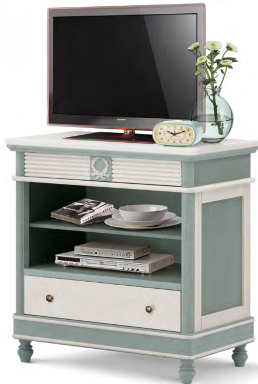
Articolo 804/G Porta TV 2 cassetti e vani a giorno. 2 drawers TV stand and compartments. cm. L. 90 P. 50 H. 90