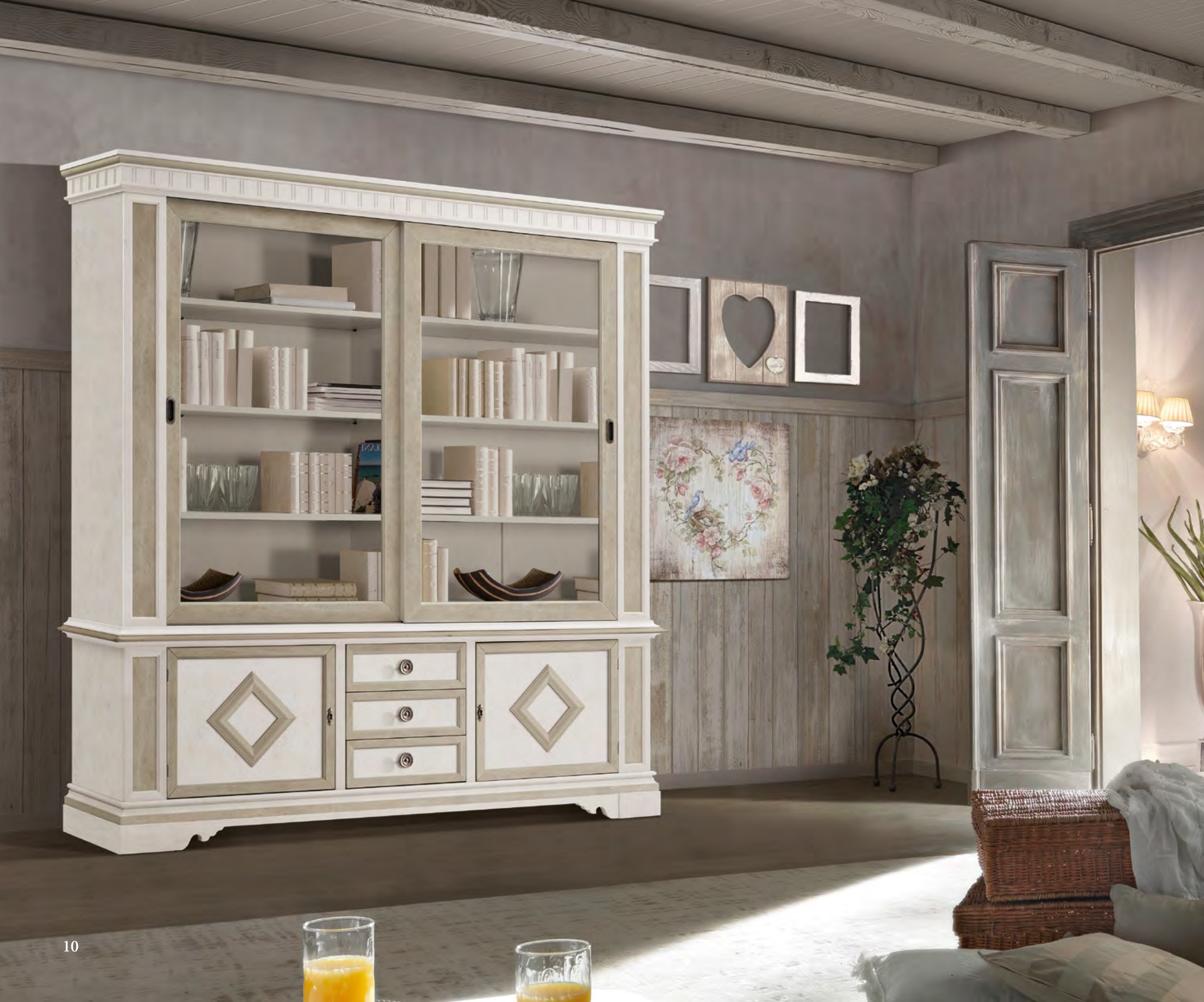
Articolo 5018/G Libreria 2 ante scorrevoli, 2 ante 3 cassetti. 2 sliding doors bookcase 2 doors 3 drawers. cm. L. 210 P. 44 H. 221