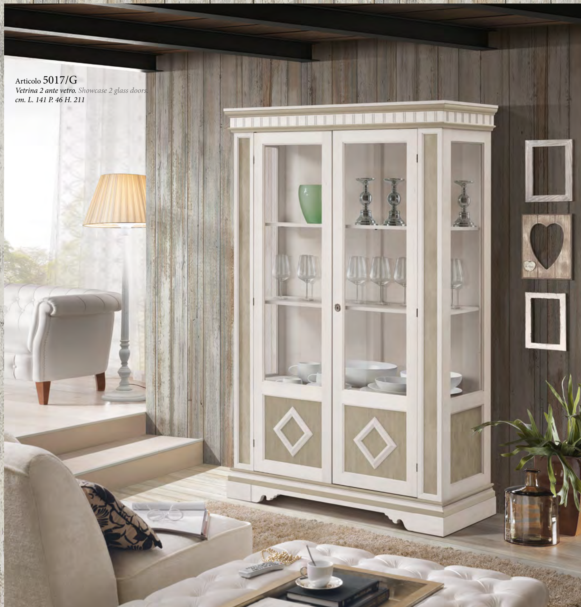
Articolo 5017/G Vetrina 2 ante vetro. Showcase 2 glass doors. cm. L. 141 P. 46 H. 211