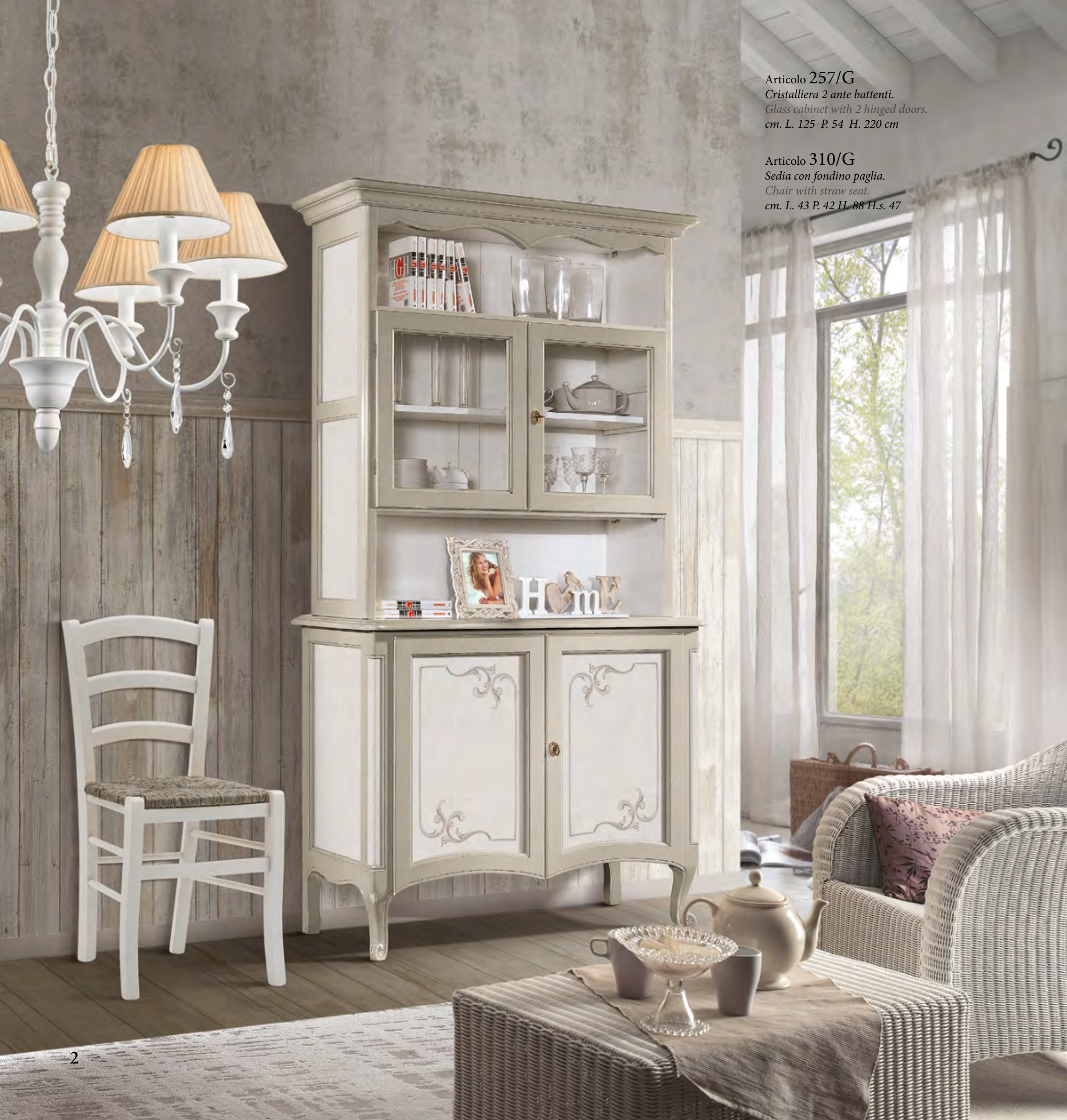
Articolo 257/G Cristalliera 2 ante battenti. Glass cabinet with 2 hinged doors. cm. L. 125 P. 54 H. 220 cm