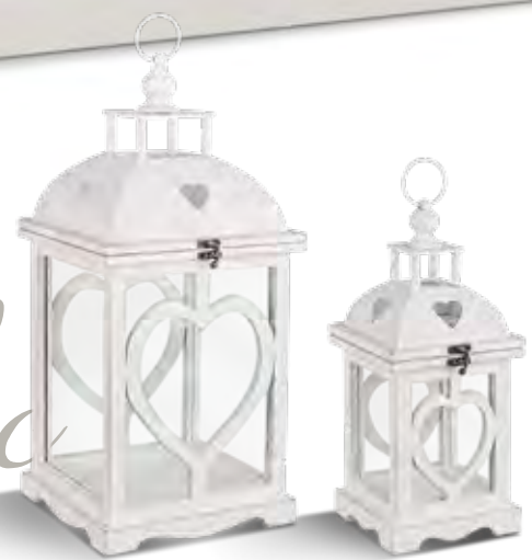
Articolo 5010/G Vetrina 6 ante vetro 3 ante legno. Showcase 6 glass doors 3 wooden doors. cm. L. 206 P. 56 H. 201