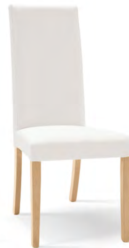
Articolo LF257 Sedia imbottita similpelle bianca con fusto rovere. White leatherette upholstered chair with oak wood frame. cm. L. 46 P. 45 H. 100 H.s. 48