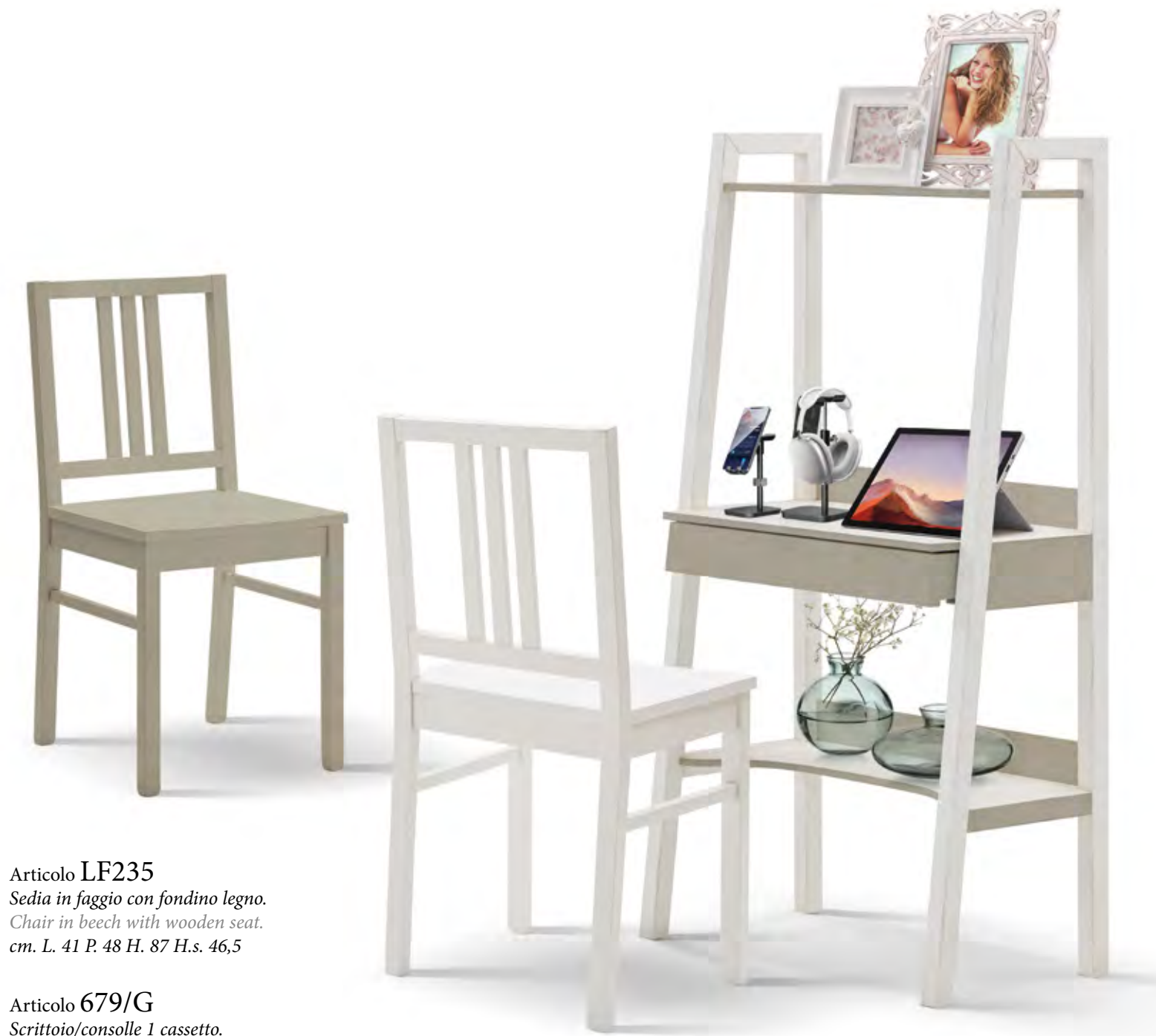
Articolo LF235 Sedia in faggio con fondino legno. Chair in beech with wooden seat. cm. L. 41 P. 48 H. 87 H.s. 46,5