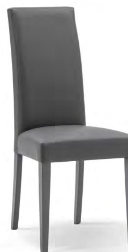
Articolo LF269 Sedia imbottita similpelle antracite con fusto antracite. Antracite leatherette upholstered chair with antracite frame. cm. L. 46 P. 45 H. 100 H.s. 48