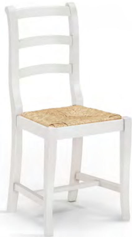
Articolo 405/G Sedia con fondino paglia. Chair with straw seat. cm. L. 43 P. 44 H. 93 H.s. 45,5