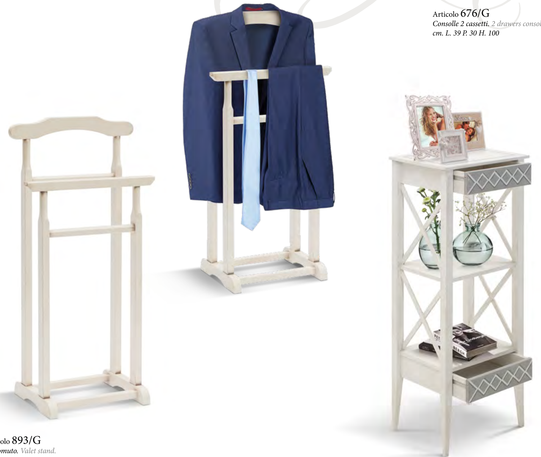
Articolo 893/G Servomuto. Valet stand. cm. L. 45 P. 30 H. 97