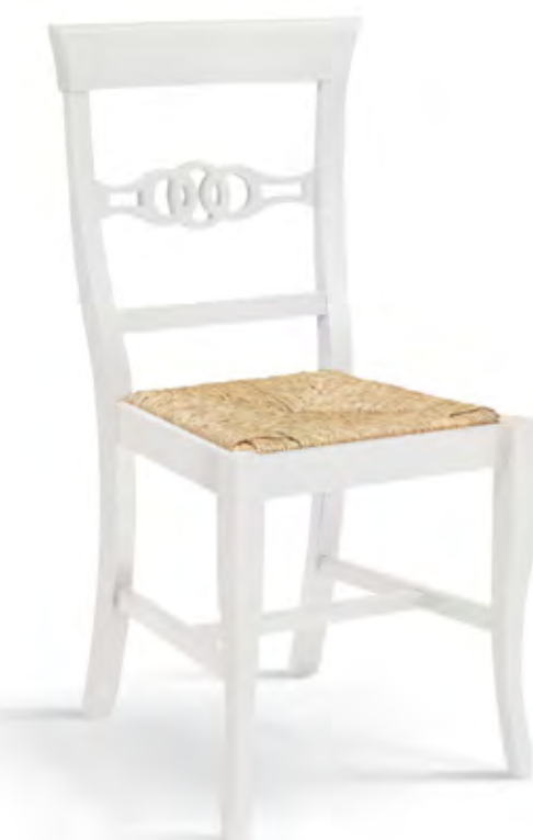
Articolo 379/G Sedia con fondino paglia. Chair with straw seat. cm. L. 46 P. 45 H. 91,5 H.s. 45,5