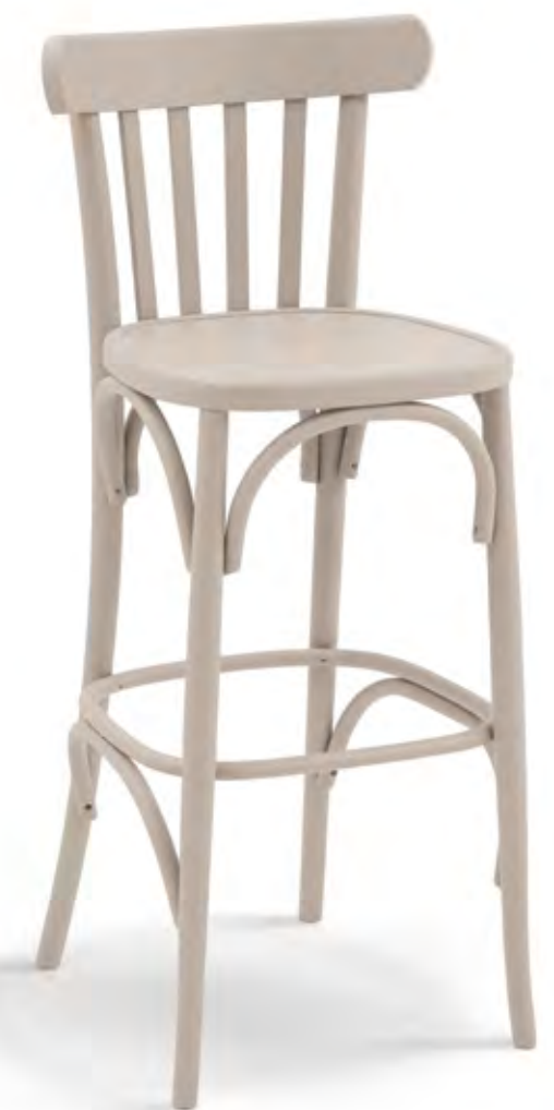
Articolo 327/GS Sgabello in faggio con fondino legno. Stool in beech with wooden seat. cm. L. 39 P. 45 H. 110 H.s. 79

The Shabby chic style is probably the most successful furnishing style in recent years. It is highly appreciated for furnishing country houses with an ancient, lived-in flavor, but it is also used a lot to bring a touch of natural and timeless class even to city apartments, as well as to work activities, in fact it is not unusual to find bars, restaurants and shops furnished in Shabby chic style. Colors are very important in the Shabby chic style: everything is bright and delicate. It undoubtedly starts from white and then plays with all the pastel shades, which most identify this style.