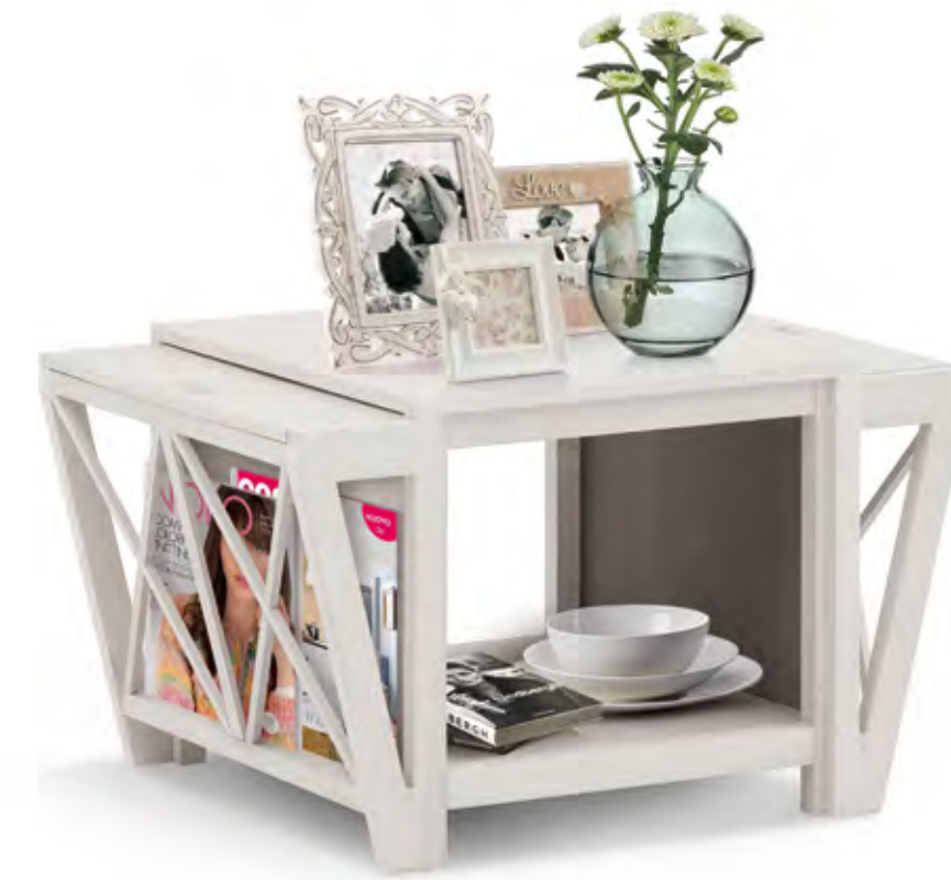
Articolo 678/G Tavolino portariviste. Magazine rack table. cm. L. 80 P. 63 H. 49