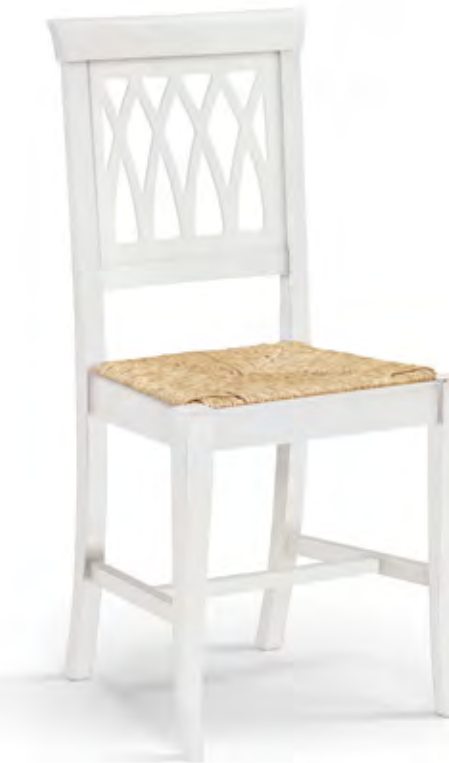
Articolo 425/G Sedia con fondino paglia. Chair with straw seat. cm. L. 44 P. 42,5 H. 93,5 H.s. 45,5