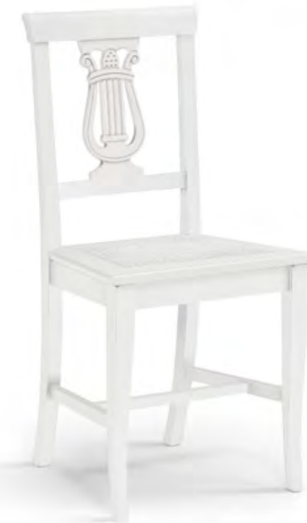
Articolo 408/G Sedia con fondino legno. Chair with wooden seat. cm. L. 44 P. 43 H. 93,5 H.s. 45,5