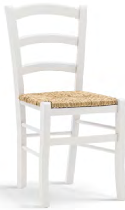
Articolo 310/G Sedia con fondino paglia. Chair with straw seat. cm. L. 43 P. 42 H. 88 H.s. 47