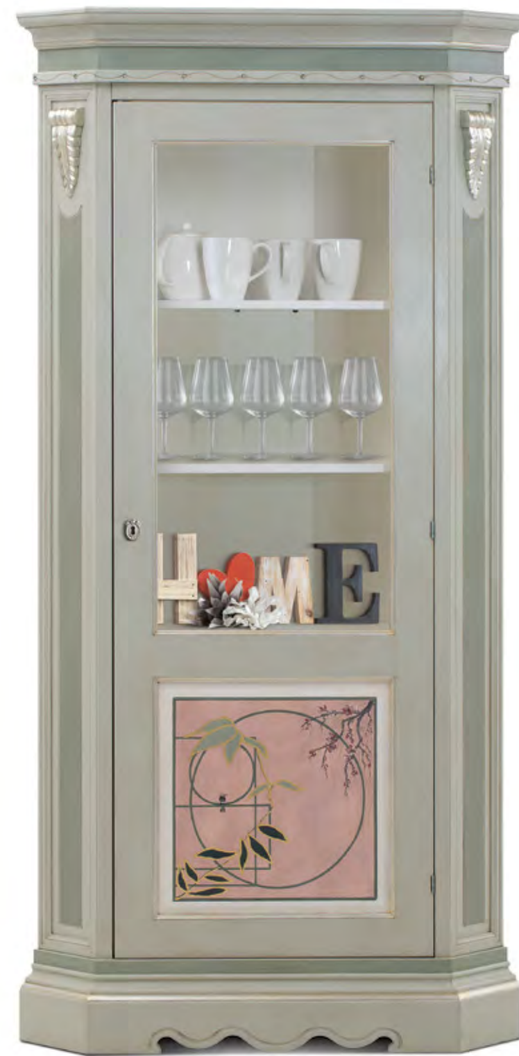
Articolo 890/G Vetrina angolo 1 anta. Particolari in foglia argento. Corner showcase with 1 door. Details in silver leaf. cm. L. 106,5 P. 67,5 H. 210