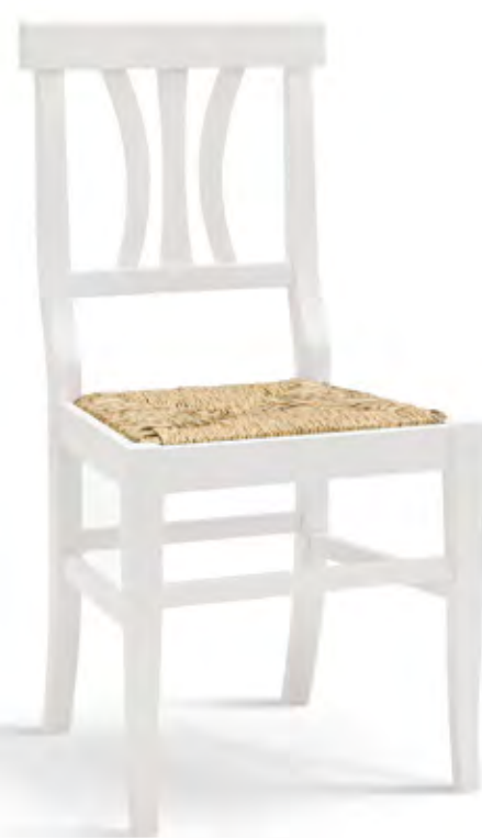
Articolo 325/G Sedia con fondino paglia. Chair with straw seat. cm. L. 43,5 P. 43 H. 90,5 H.s. 45,5