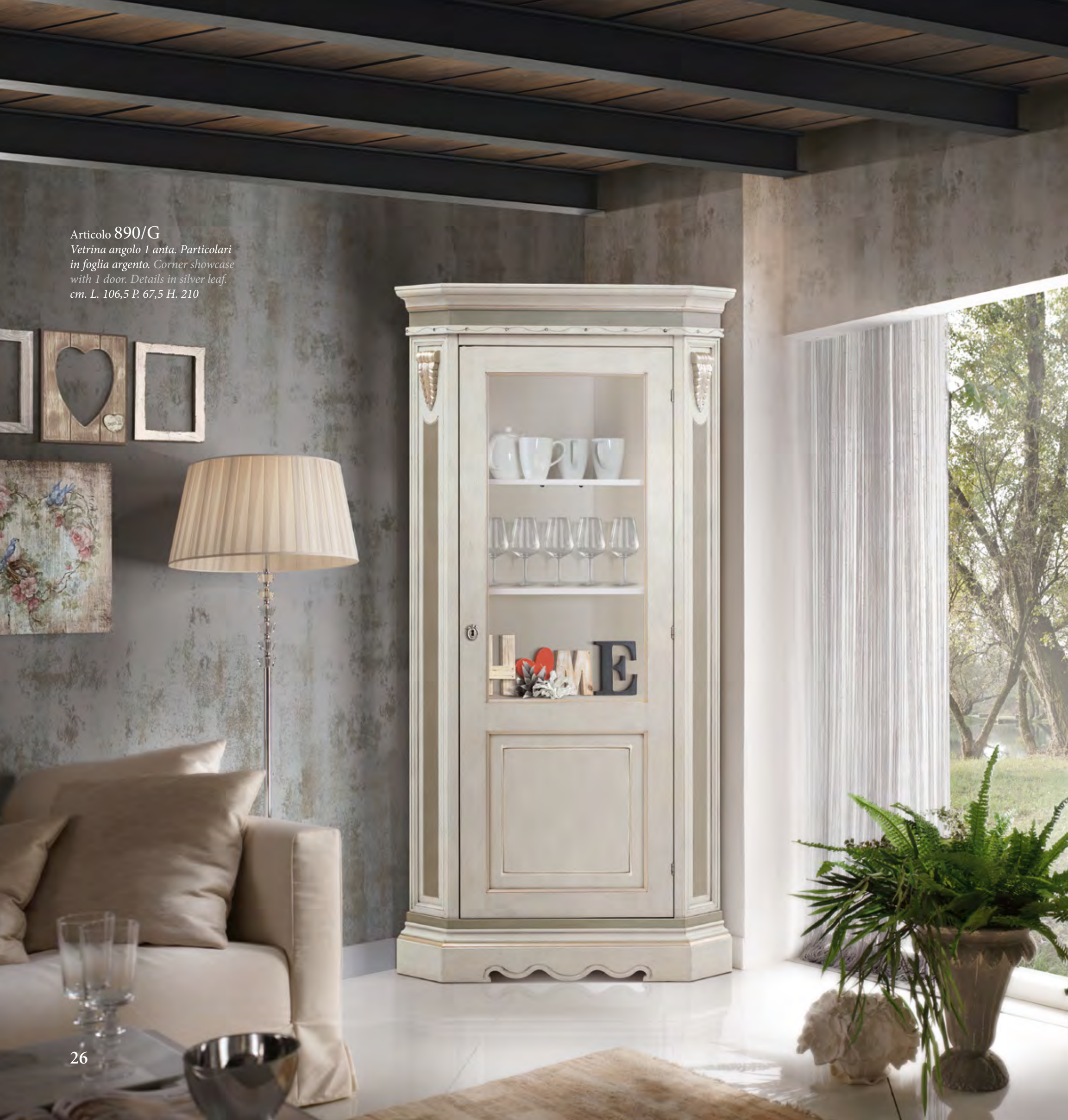
Articolo 890/G Vetrina angolo 1 anta. Particolari in foglia argento. Corner showcase with 1 door. Details in silver leaf. cm. L. 106,5 P. 67,5 H. 210