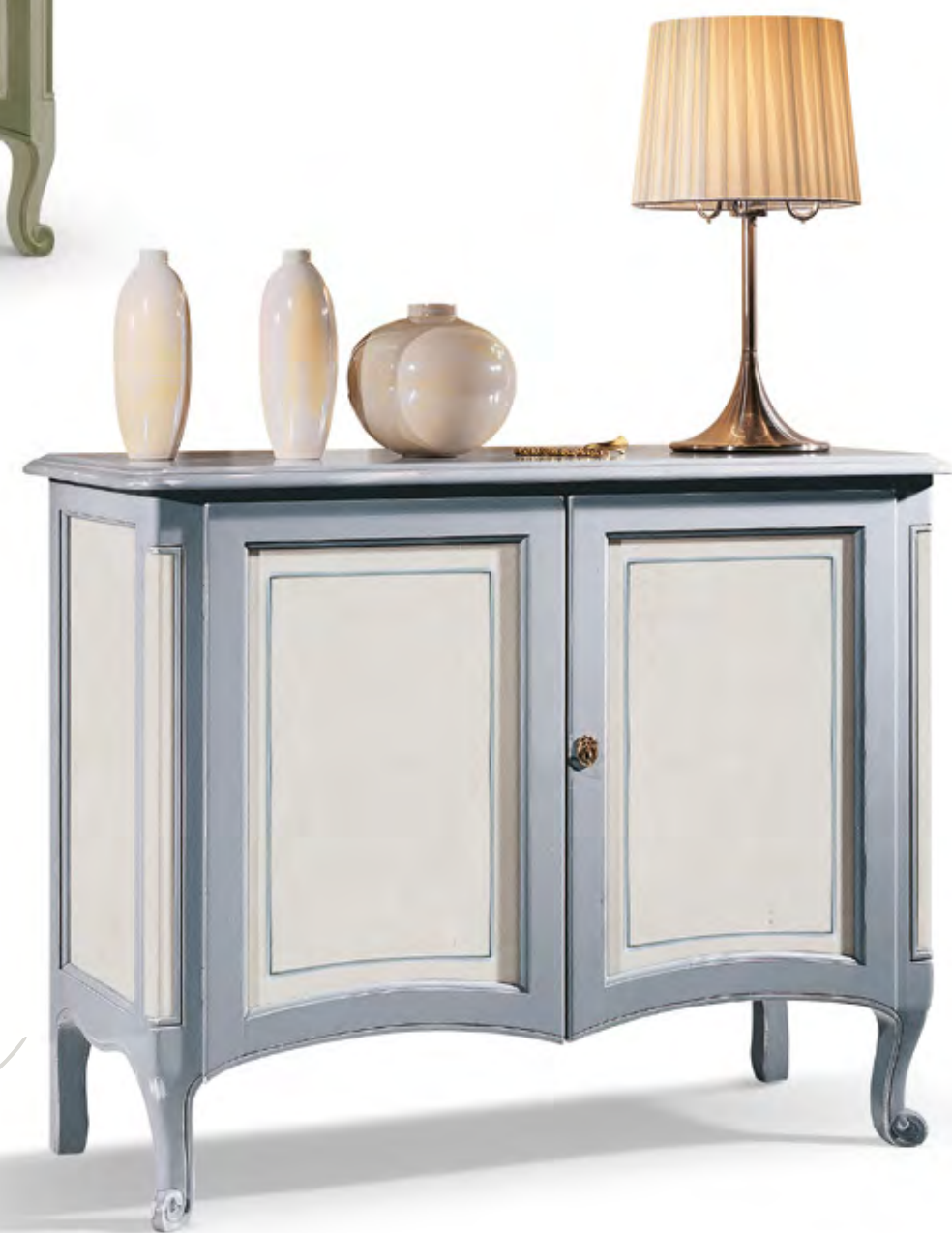
Articolo 260/G Credenza 2 ante battenti. Sideboard with 2 hinged doors. cm. L. 125 P. 54 H. 100