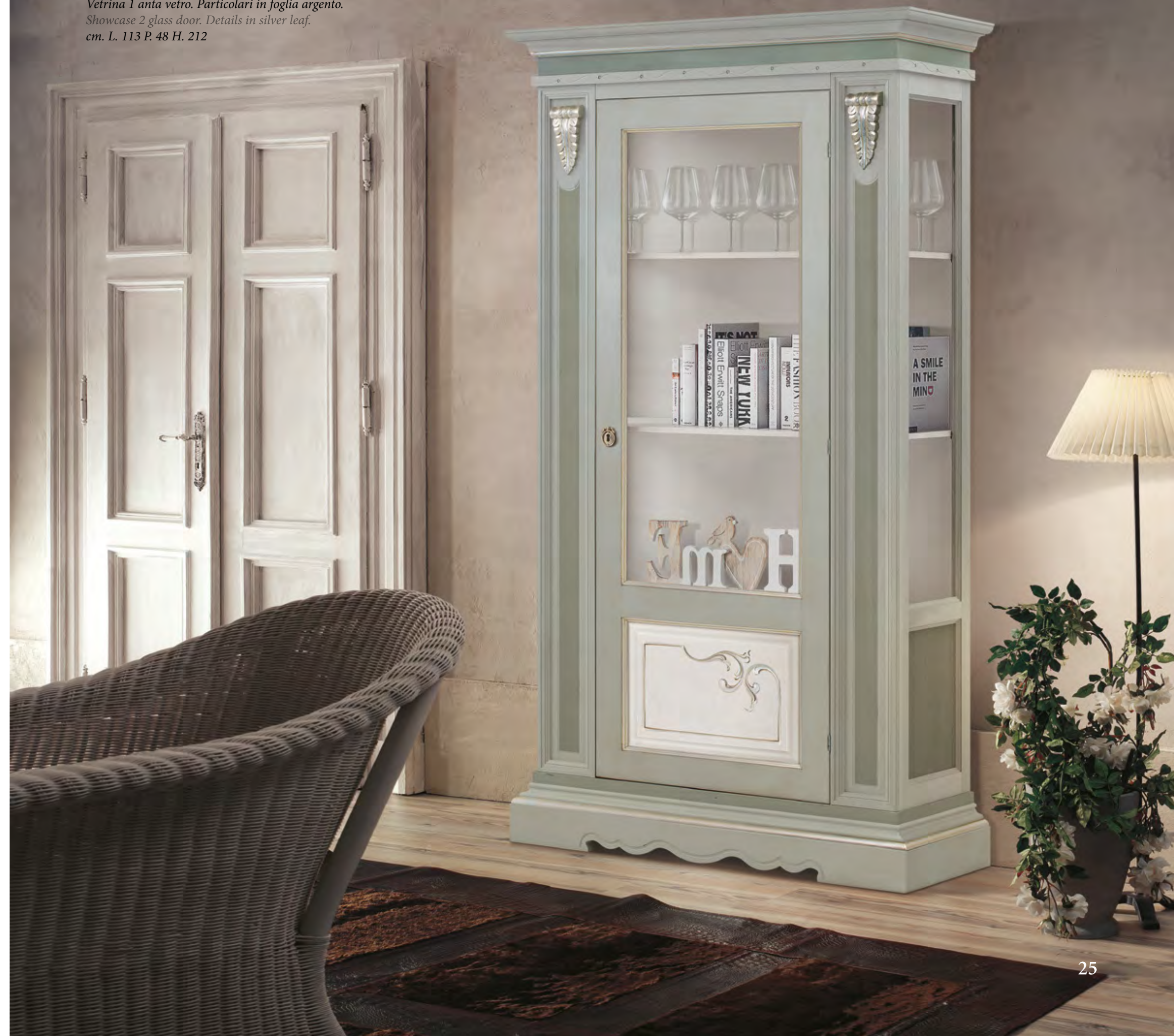
Articolo 904/G Vetrina 1 anta vetro. Particolari in foglia argento. Showcase 2 glass door. Details in silver leaf. cm. L. 113 P. 48 H. 212