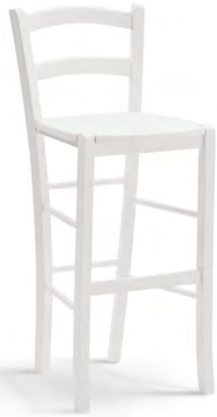
Articolo 310/GS Sgabello con fondino legno. Stoll with straw seat. cm. L. 41 P. 44 H. 101 H.s. 73