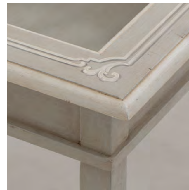
Articolo 1004/G Tavolino quadrato piano vetro. Square glass top coffee table. cm. L. 70 P. 70 H. 47