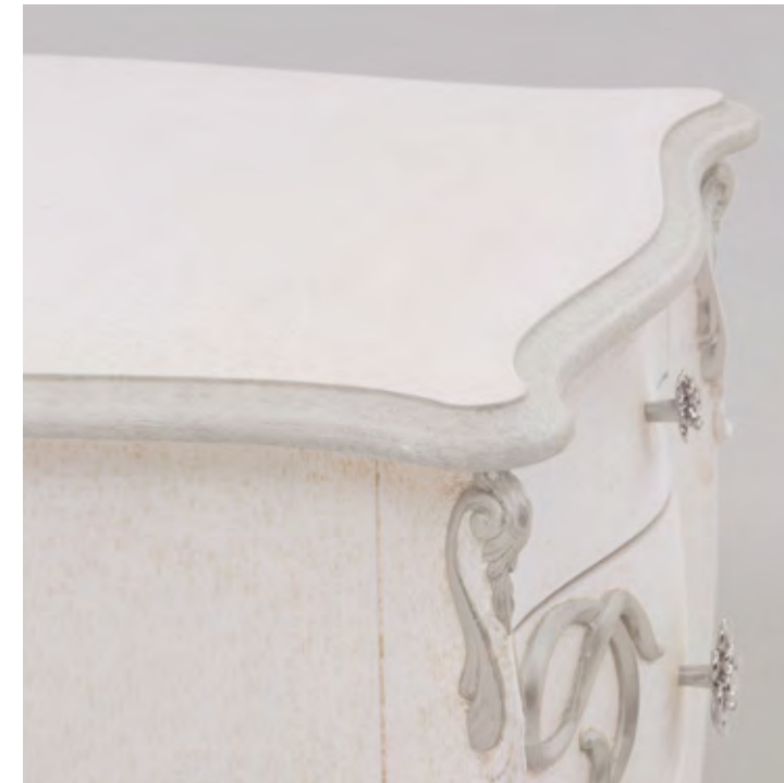
Articolo 1727/G Comodino 3 cassetti con rilievo. Bedside table 3 drawers with relief. cm. l. 62 p. 40 h. 70