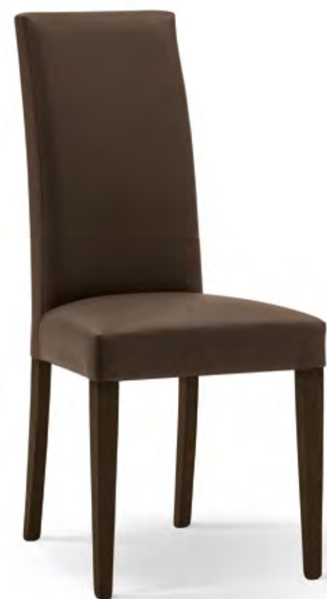
Articolo LF254 Sedia imbottita similpelle marrone con fusto wengè. Brown leatherette upholstered chair with wenge frame. cm. L. 46 P. 45 H. 100 H.s. 48