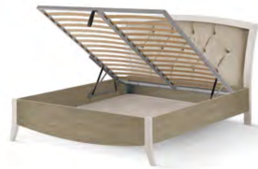
Articolo 5103/GR Kit rete per letto contenitore. Base kit for storage bed.