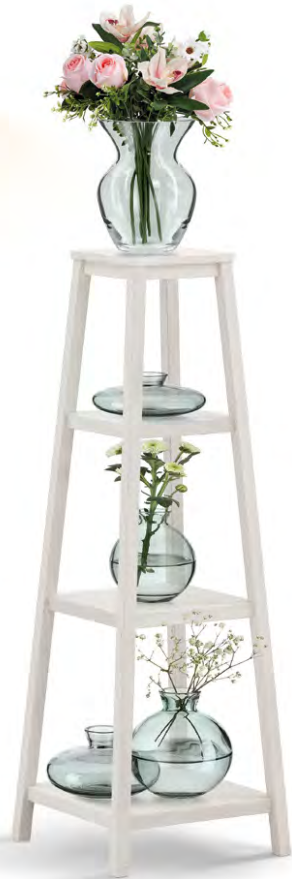
Articolo 683/G Portavasi quadrato. Square pot holder. cm. L. 36 P. 36 H. 107