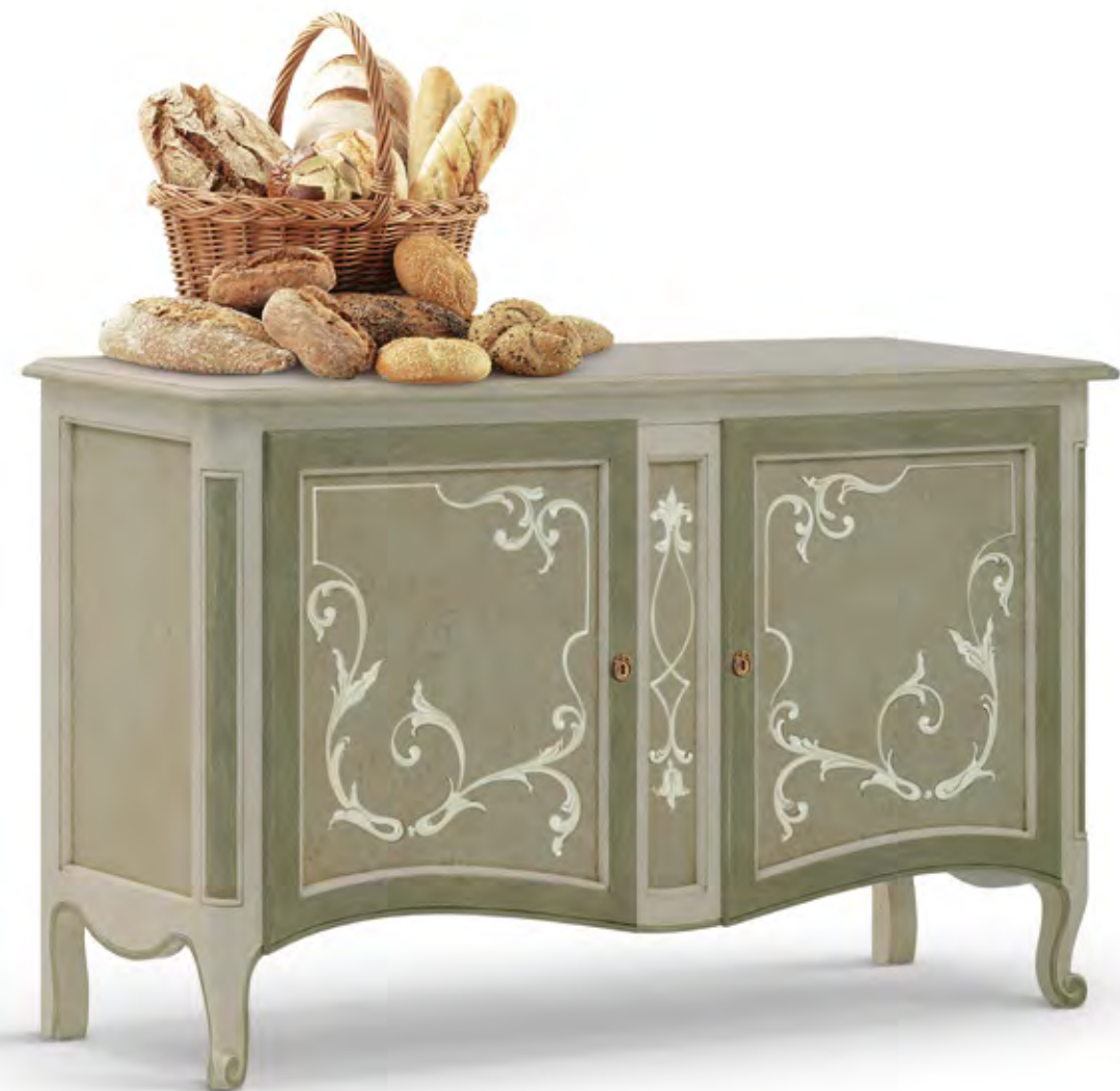
Articolo 261/G Credenza 2 ante battenti. Sideboard with 2 hinged doors. cm. L. 140 P. 54 H. 100