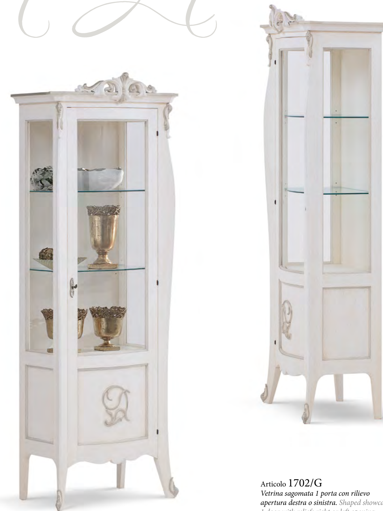
Articolo 1702/G Vetrina sagomata 1 porta con rilievo apertura destra o sinistra. Shaped showcase 1 door with reliefs right or left opening. cm. L. 78 P. 49 H. 200