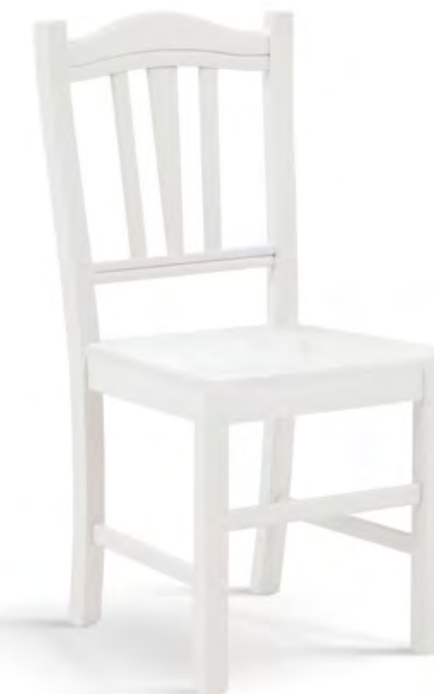
Articolo 381/G Sedia con fondino legno. Chair with wooden seat. cm. L. 43 P. 48 H. 95 H.s. 46,5