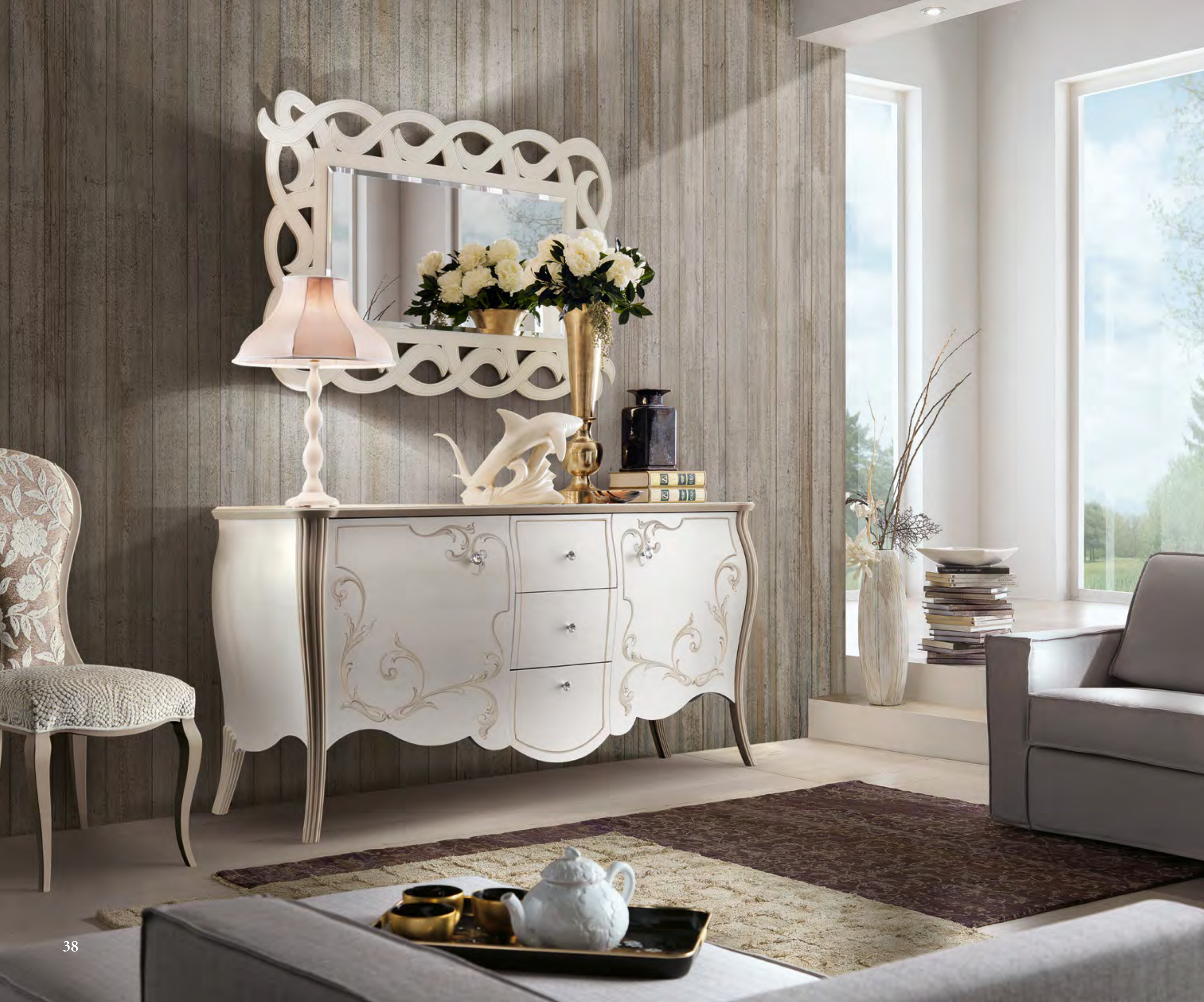
Articolo FR010 Credenza 2 porte 3 cassetti. 2 doors sideboard 3 drawers. cm. l. 200 p. 60 h. 98