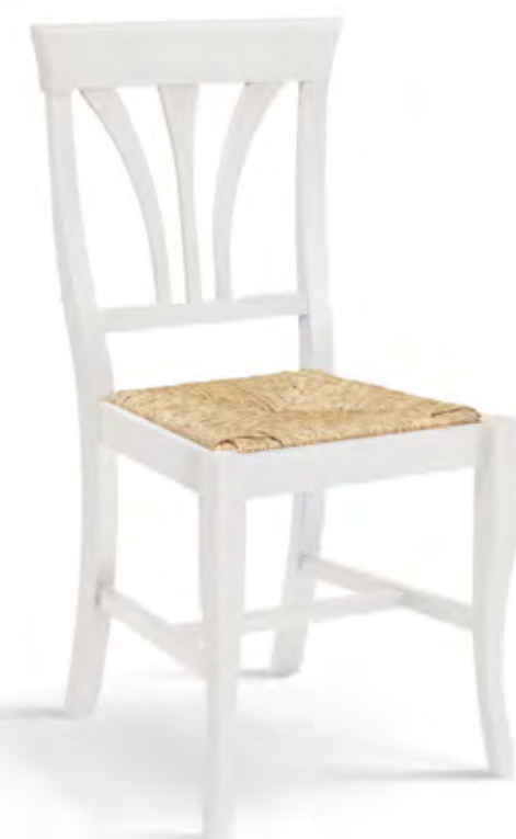
Articolo 375/G Sedia con fondino paglia. Chair with straw seat. cm. L. 46 P. 45 H. 91,5 H.s. 45,5