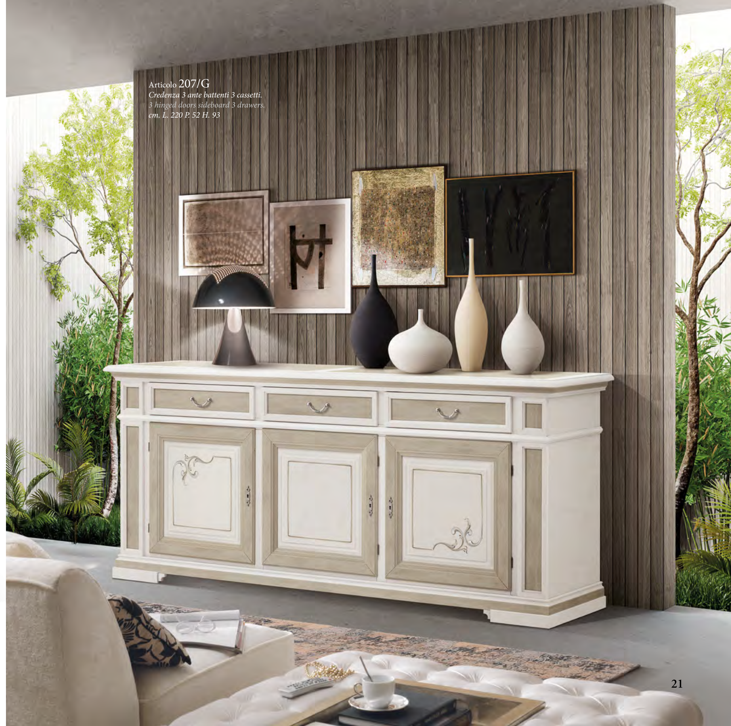
Articolo 207/G Credenza 3 ante battenti 3 cassetti. 3 hinged doors sideboard 3 drawers. cm. L. 220 P. 52 H. 93