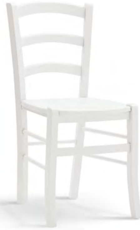
Articolo 310/G Sedia con fondino legno. Chair with wooden seat. cm. L. 43 P. 42 H. 88 H.s. 47