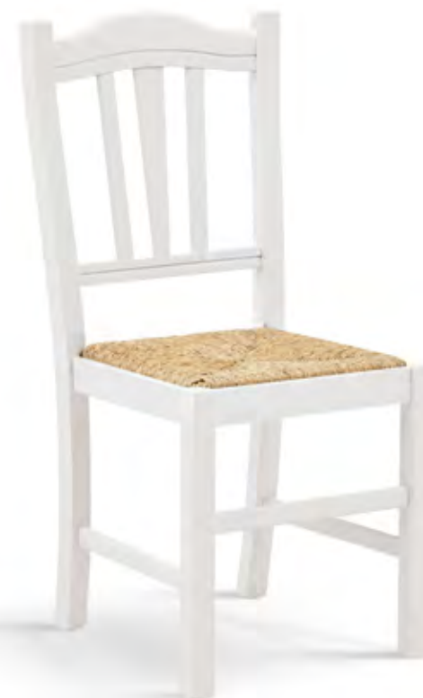
Articolo 381/G Sedia con fondino paglia. Chair with straw seat. cm. L. 43 P. 48 H. 95 H.s. 46,5