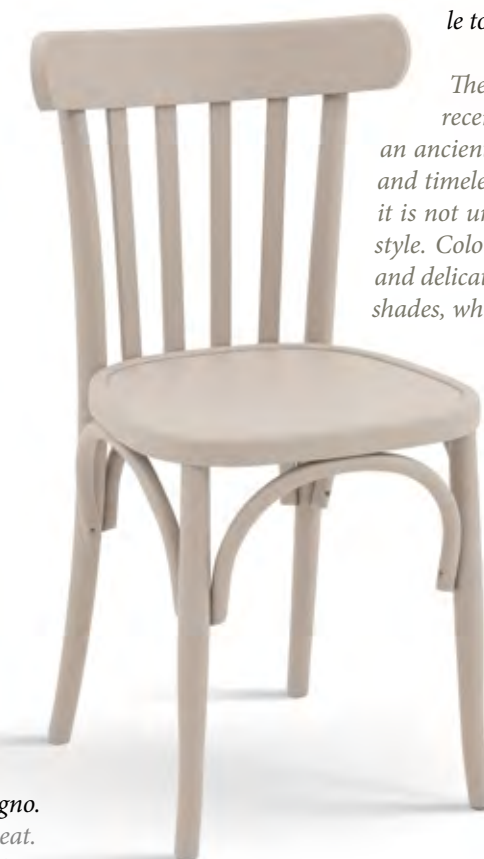
Articolo 327/G Sedia in faggio con fondino legno. Chair in beech with wooden seat. cm. L. 43 P. 46 H. 81,5 H.s. 46,5