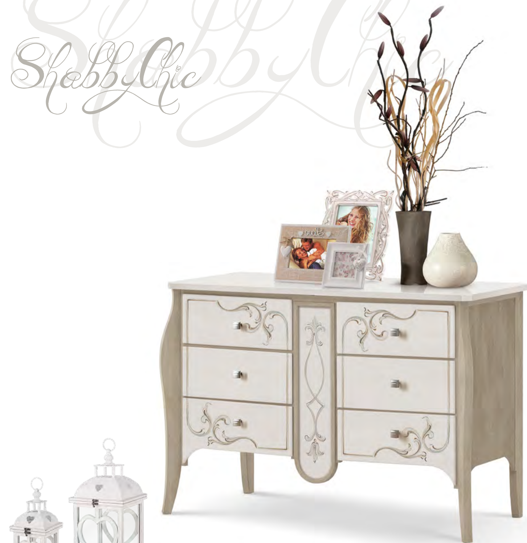
Articolo MB 146 Credenzina 6 cassetti. 6 drawers sideboard. cm. L. 126 P. 58 H. 87