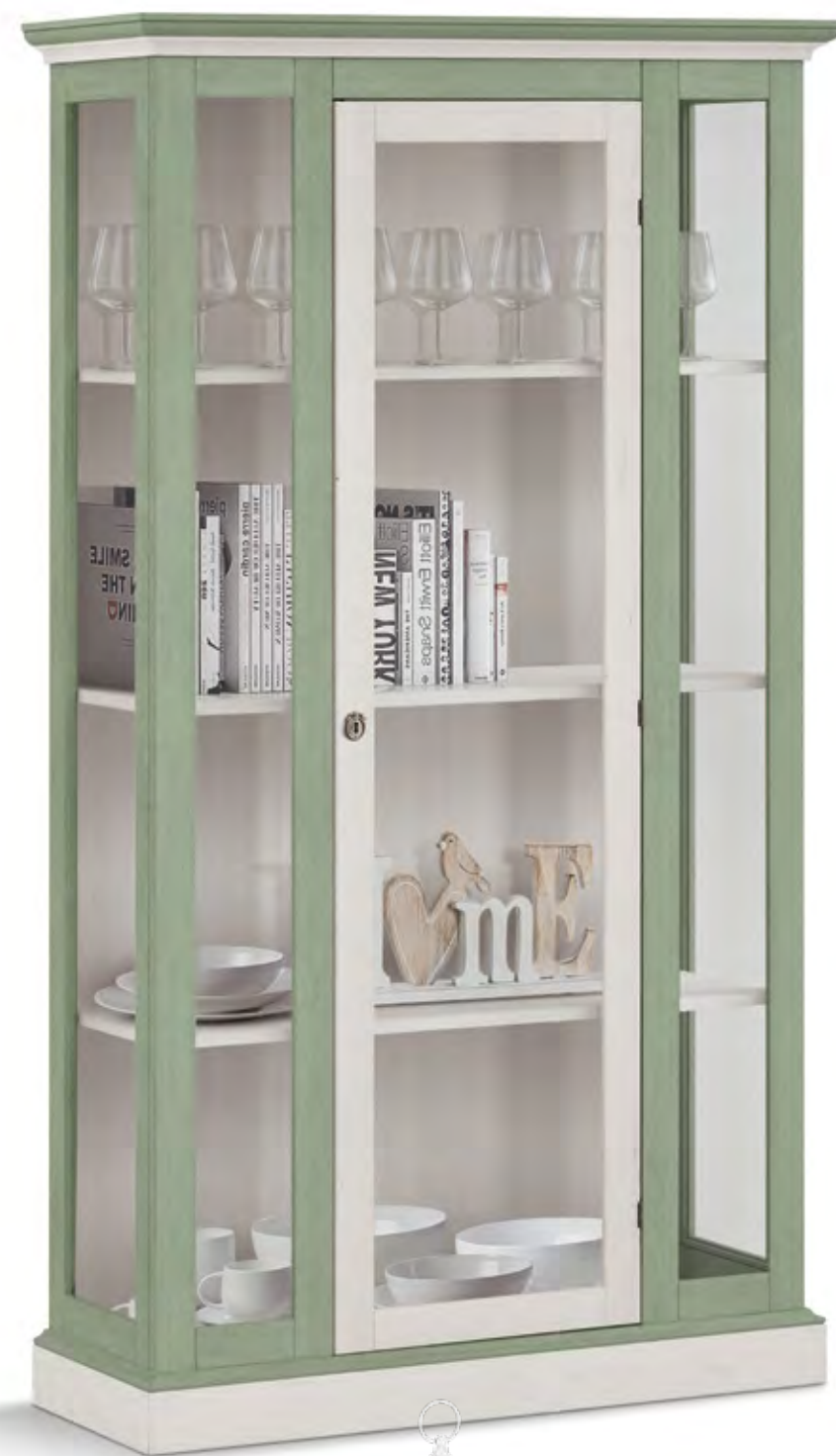
Articolo 40/G Vetrina 1 anta vetro. Showcase 1 glass door. cm. L. 104 P. 40 H. 185