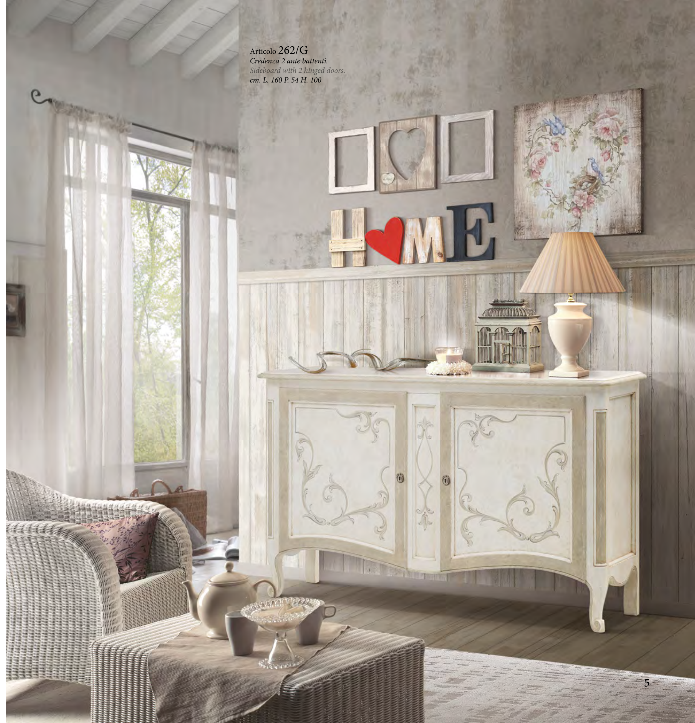
Articolo 262/G Credenza 2 ante battenti. Sideboard with 2 hinged doors. cm. L. 160 P. 54 H. 100