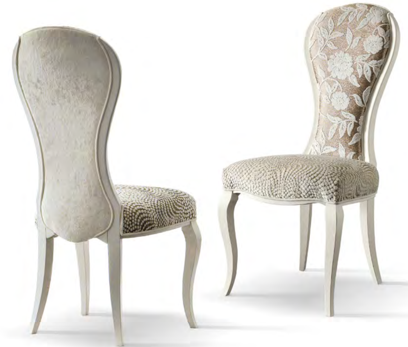
Articolo FR032 Sedia con fondino e schienale imbottiti. Chair with upholstered seat and back. cm. l. 52 p. 46 h. 110 hs. 51