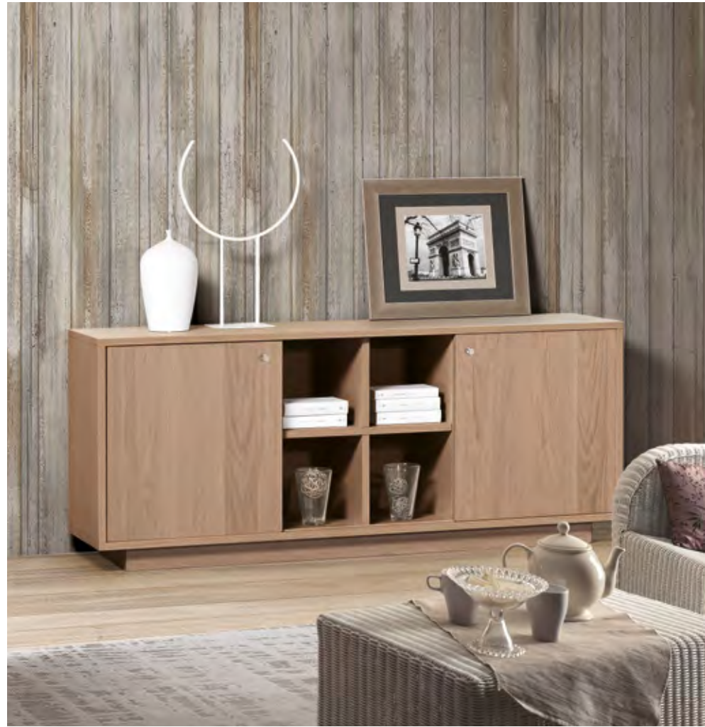
Articolo LF315 Credenza struttura in rovere ante scorrevoli in rovere. Oak structure sideboard doors sliding doors in oak. cm. L. 185,5 P. 50 H. 75