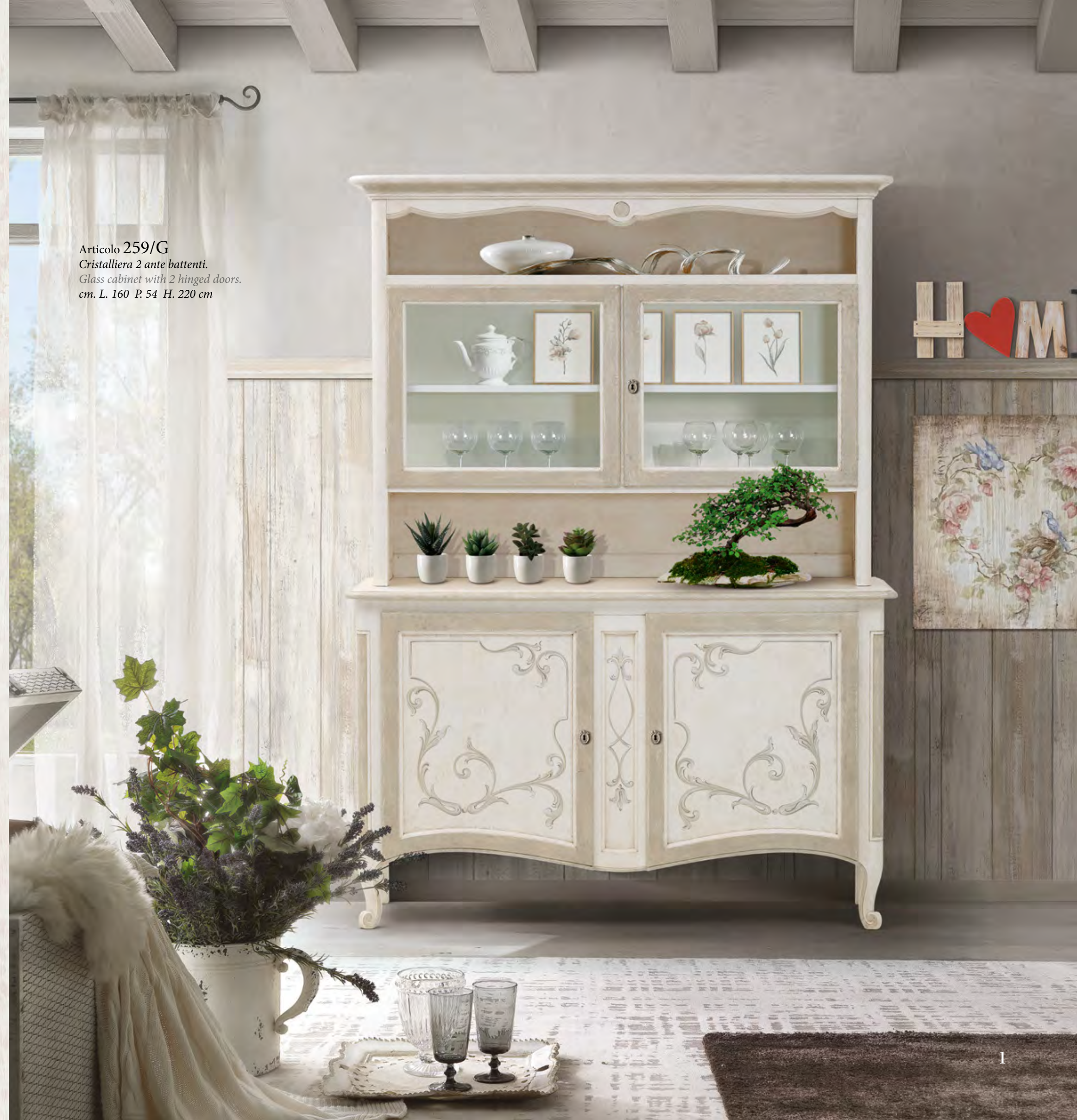
Articolo 259/G Cristalliera 2 ante battenti. Glass cabinet with 2 hinged doors. cm. L. 160 P. 54 H. 220 cm

A welcoming environment is the creed, nostalgic feelings are allowed. The Shabby Chic style is the celebration of the taste for artistic details that come back to light after years under layers of paint. Here furniture and accessories are allowed that have not lost any of their charisma despite the obvious signs of use. It does not matter if it is a beloved family heirloom, an interesting source of inspiration found at the flea market or a curious object we came across by chance. These unique pieces are individual accents in the living space and create an atmosphere full of intimacy, nostalgia and classic elegance.