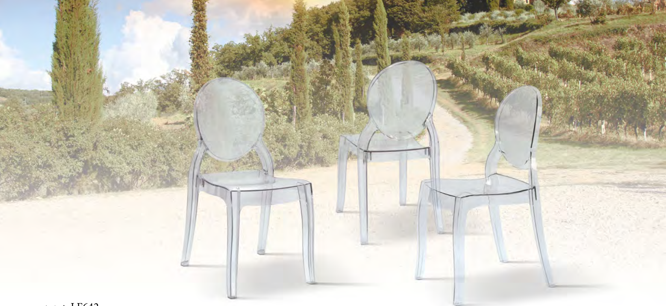
Articolo LF642 Sedia in polipropilene trasparente impilabile. Stackable transparent polypropylene chair. cm. L. 45 P. 53 H. 90 H.s. 46