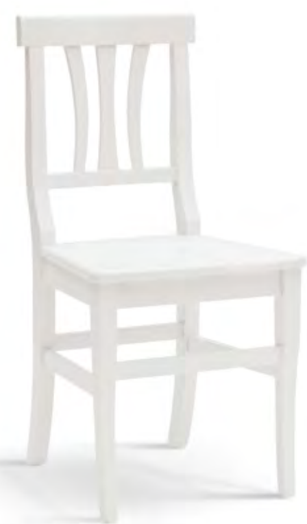
Articolo 325/G Sedia con fondino legno. Chair with wooden seat. cm. L. 43,5 P. 43 H. 90,5 H.s. 45,5