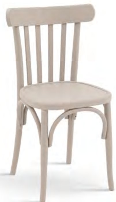
Articolo 327/G Sedia in faggio con fondino legno. Chair in beech with wooden seat. cm. L. 43 P. 46 H. 81,5 H.s. 46,5