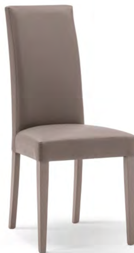
Articolo LF256 Sedia imbottita similpelle tortora con fusto tortora. Taupe leatherette upholstered chair with taupe frame. cm. L. 46 P. 45 H. 100 H.s. 48