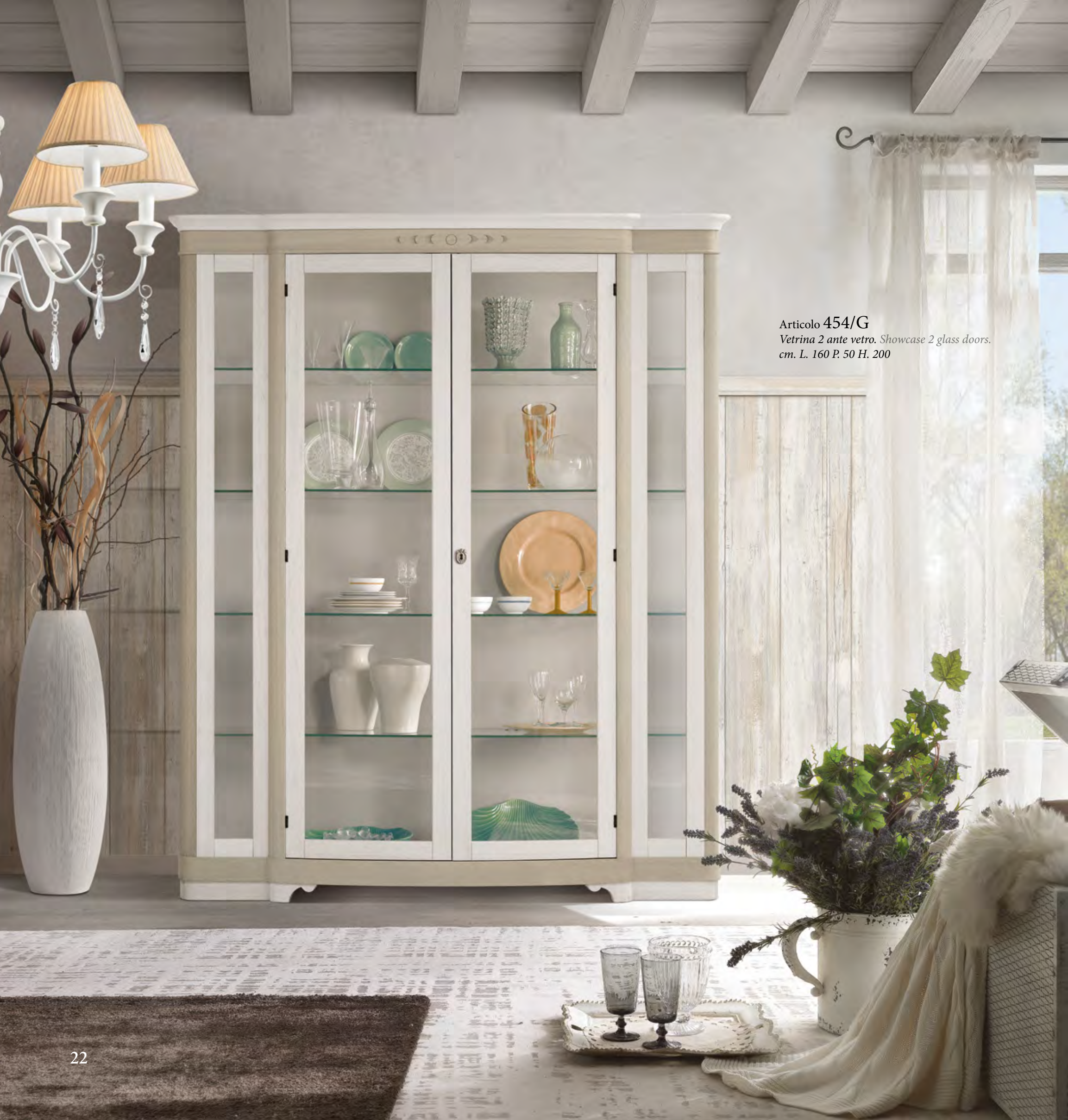
Articolo 454/G Vetrina 2 ante vetro. Showcase 2 glass doors. cm. L. 160 P. 50 H. 200