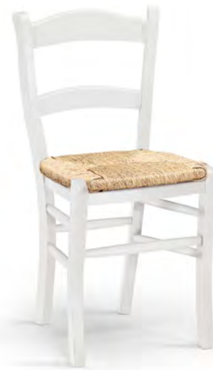
Articolo 380/G Sedia con fondino paglia. Chair with straw seat. cm. L. 47 P. 42 H. 87 H.s. 48,5