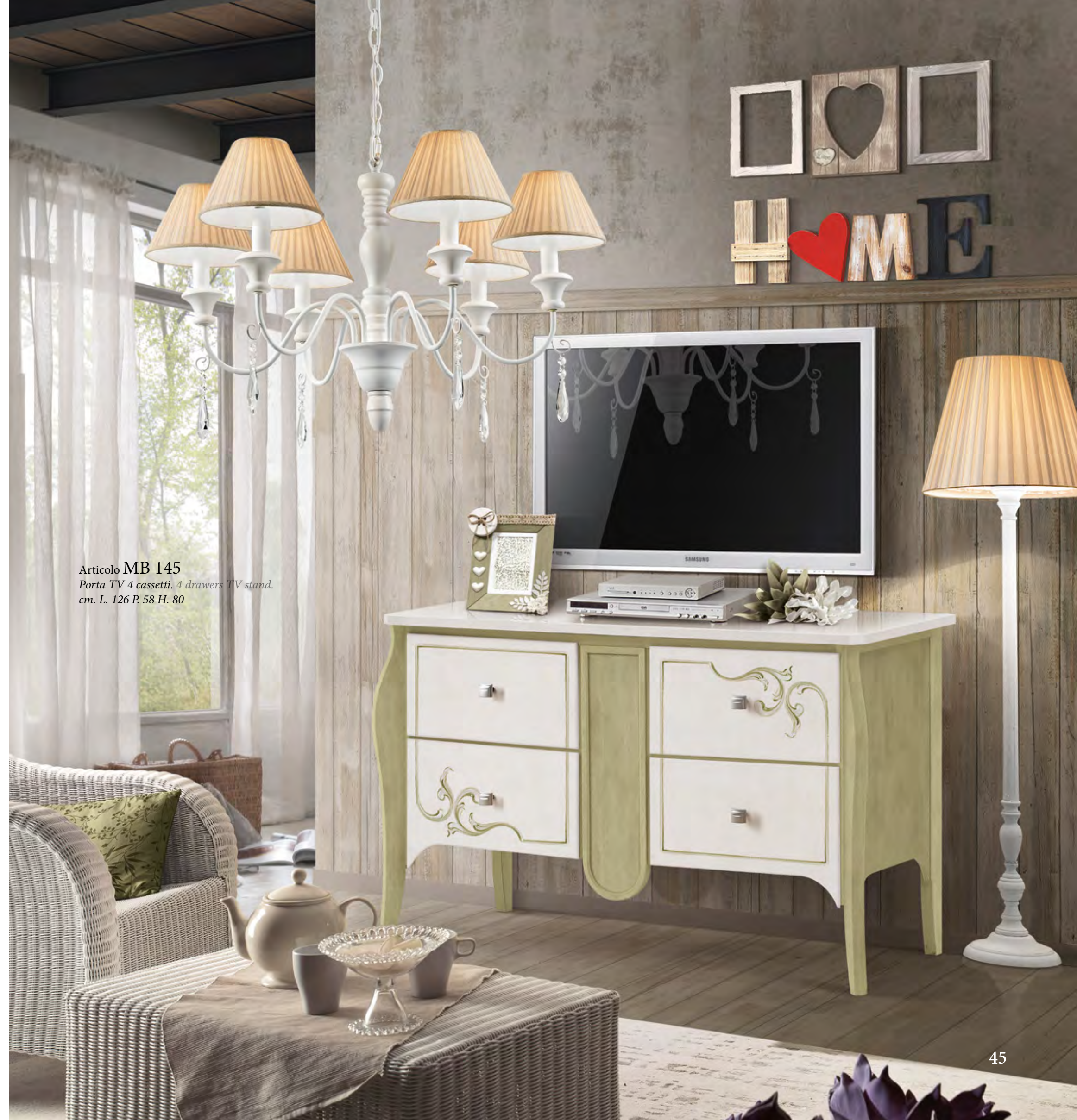
Articolo MB 145 Porta TV 4 cassetti. 4 drawers TV stand. cm. L. 126 P. 58 H. 80