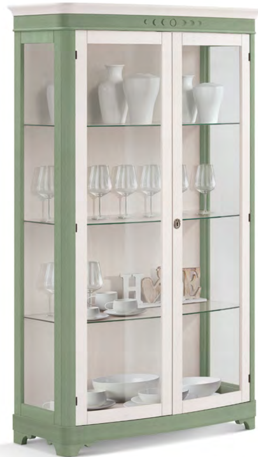
Articolo 452/G Vetrina 2 ante vetro. Showcase 2 glass doors. cm. L. 113 P. 47 H. 195