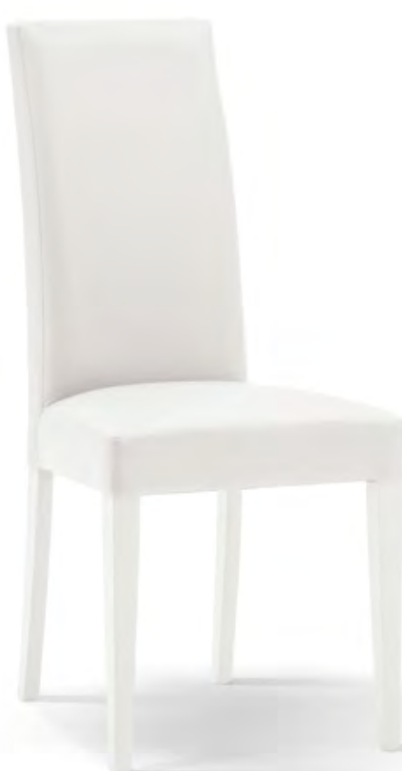
Articolo LF255 Sedia imbottita similpelle bianca con fusto bianco. White leatherette upholstered chair with white frame. cm. L. 46 P. 45 H. 100 H.s. 48