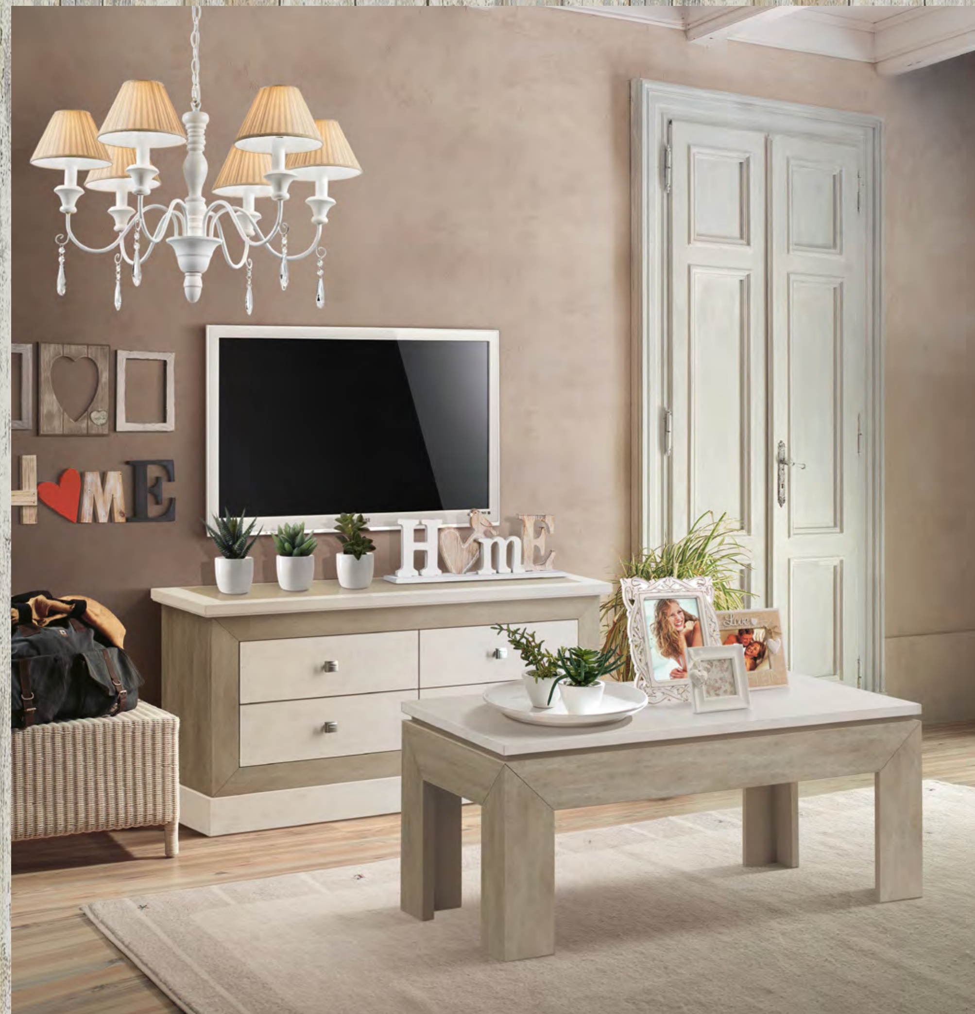
Articolo 684/G Tavolino rettangolare piano legno. Rectangular coffee table. wooden top. cm. L. 110 P. 55 H. 50