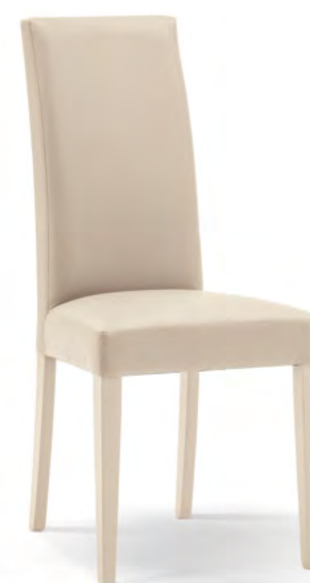
Articolo LF265 Sedia imbottita similpelle beige con fusto beige. Beige leatherette upholstered chair with beige frame. cm. L. 46 P. 45 H. 100 H.s. 48