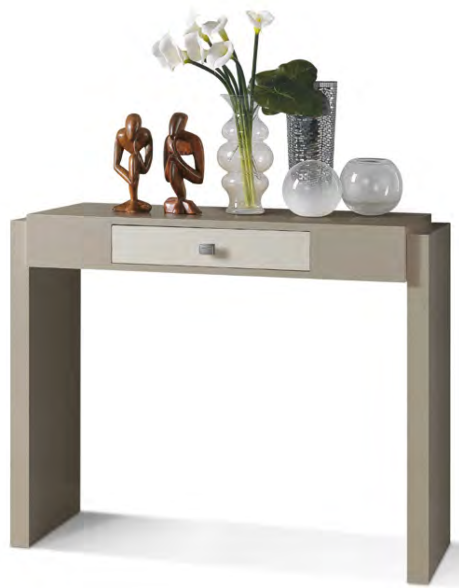
Articolo 674/G Consolle 1 cassetto. 1 drawer console. cm. L. 102 P. 34 H. 80