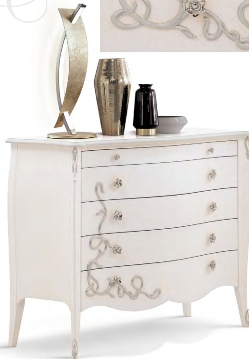
Articolo 1725/G Comò 5 cassetti con rilievo. Chest of 5 drawers with relief. cm. L. 140 P. 57 H. 112