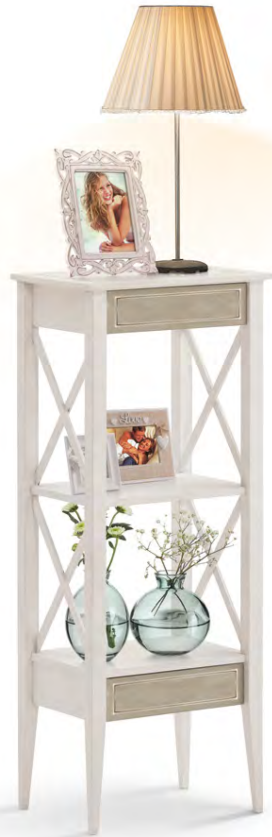
Articolo 676/G Consolle 2 cassetti. 2 drawers console. cm. L. 39 P. 30 H. 100