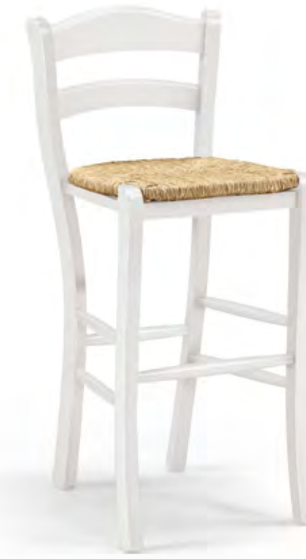
Articolo 380/GS Sgabello con fondino paglia. Stoll with straw seat. cm. L. 44 P. 45,5 H. 97,5 H.s. 69