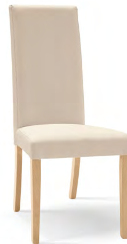
Articolo LF258 Sedia imbottita similpelle beige con fusto rovere. Beige leatherette upholstered chair with oak wood frame. cm. L. 46 P. 45 H. 100 H.s. 48