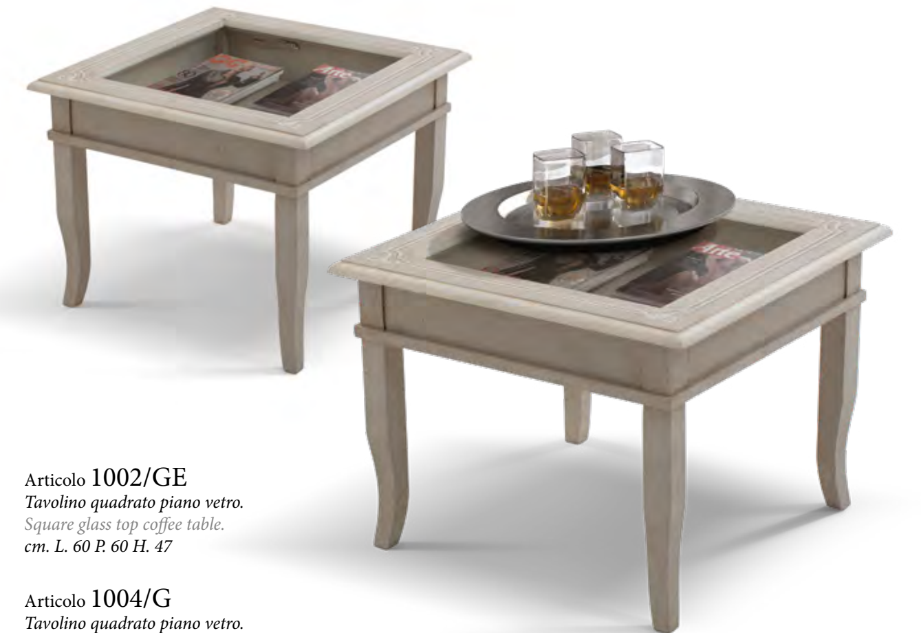
Articolo 1002/GE Tavolino quadrato piano vetro. Square glass top coffee table. cm. L. 60 P. 60 H. 47