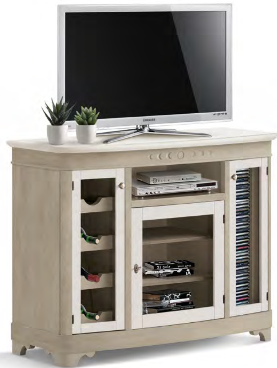
Articolo 457/G Porta TV 3 ante. TV stand with 3 doors. cm. L. 110 P. 47 H. 86