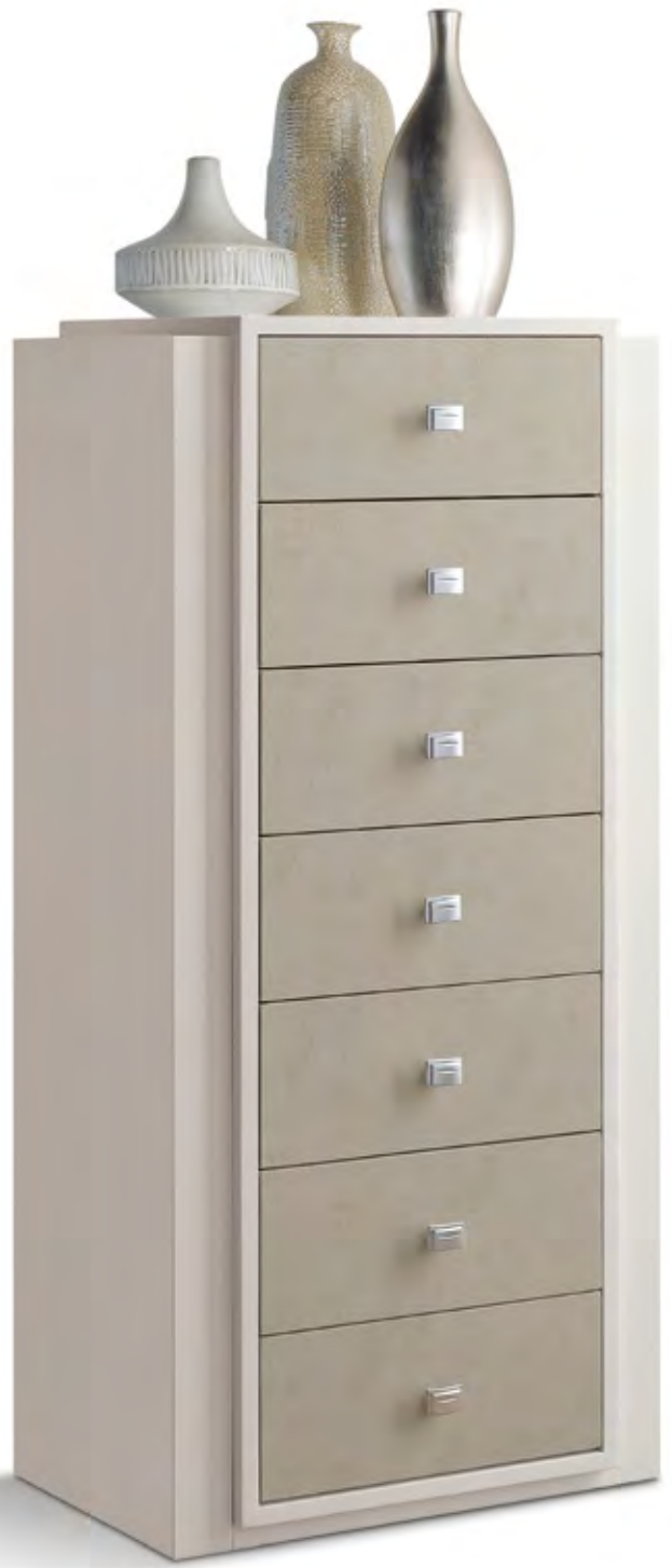
Articolo 673/G Cassettiera 7 cassetti. 5 drawers dresser. cm. L. 53 P. 42 H. 120