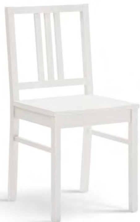
Articolo LF235 Sedia in faggio con fondino legno. Chair in beech with wooden seat. cm. L. 41 P. 48 H. 87 H.s. 46,5